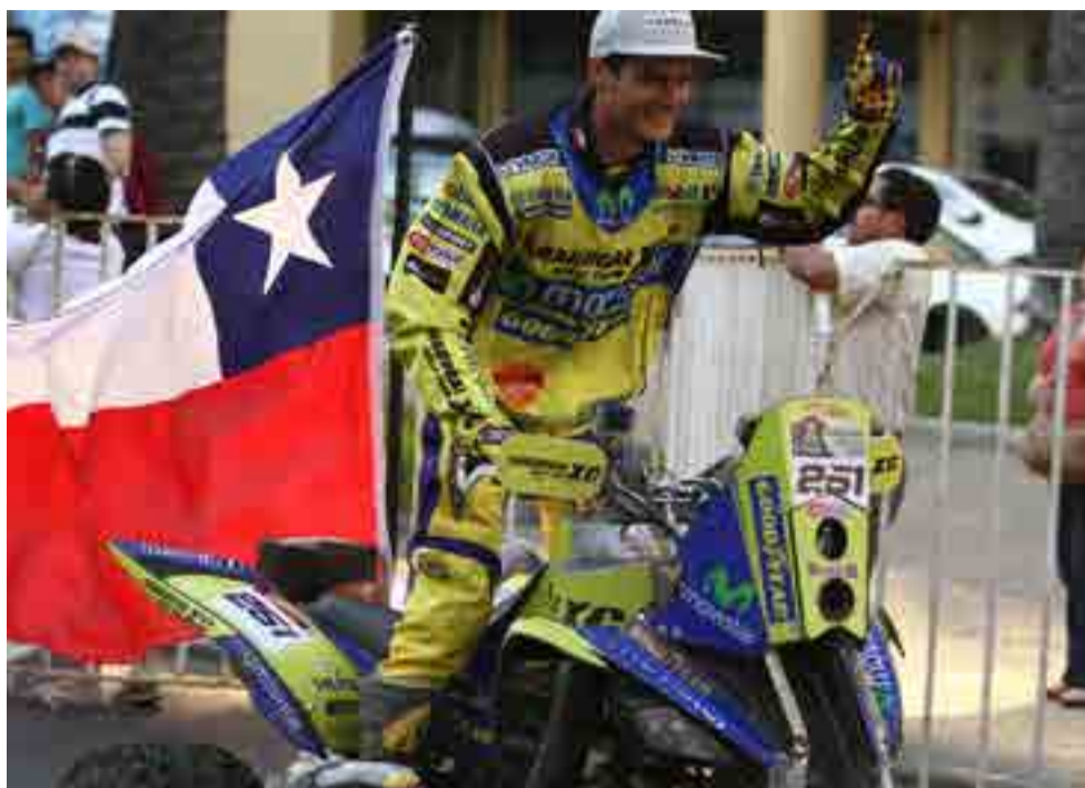
El chileno Ignacio Casale sumó su segunda corona en la modalidad de cuadríciclos.