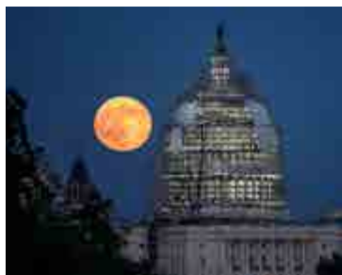
Superluna para ver Página 8