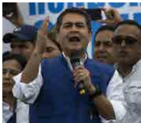
Presidente bajo protestas Página 2