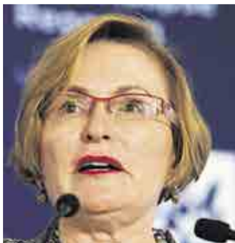
Gobernadora de la provincia de Cabo Occidental, Hellen Zille.

Para ello, subrayó, es necesario prepararse y tomar una serie de acciones como el registro en los municipios de los integrantes de cada familia para recibir el agua