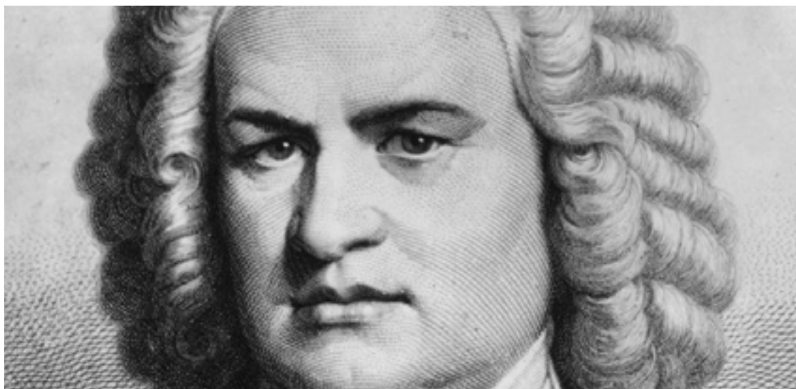
Johan Sebastian plagiado por la electrónica.

El 80 por ciento de esa información sirve para entrenar a Deep Bach en reconocer las melodías del verdadero Bach, mientras que el 20 por ciento restante es para producir su propio contenido.