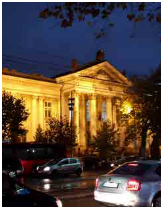
La modernidad y las construcciones antiguas resultan dos de los tantos atractivos de esta urbe balcánica.

Texto y fotos: Roberto Molina Corresponsal jefe/Belgrado