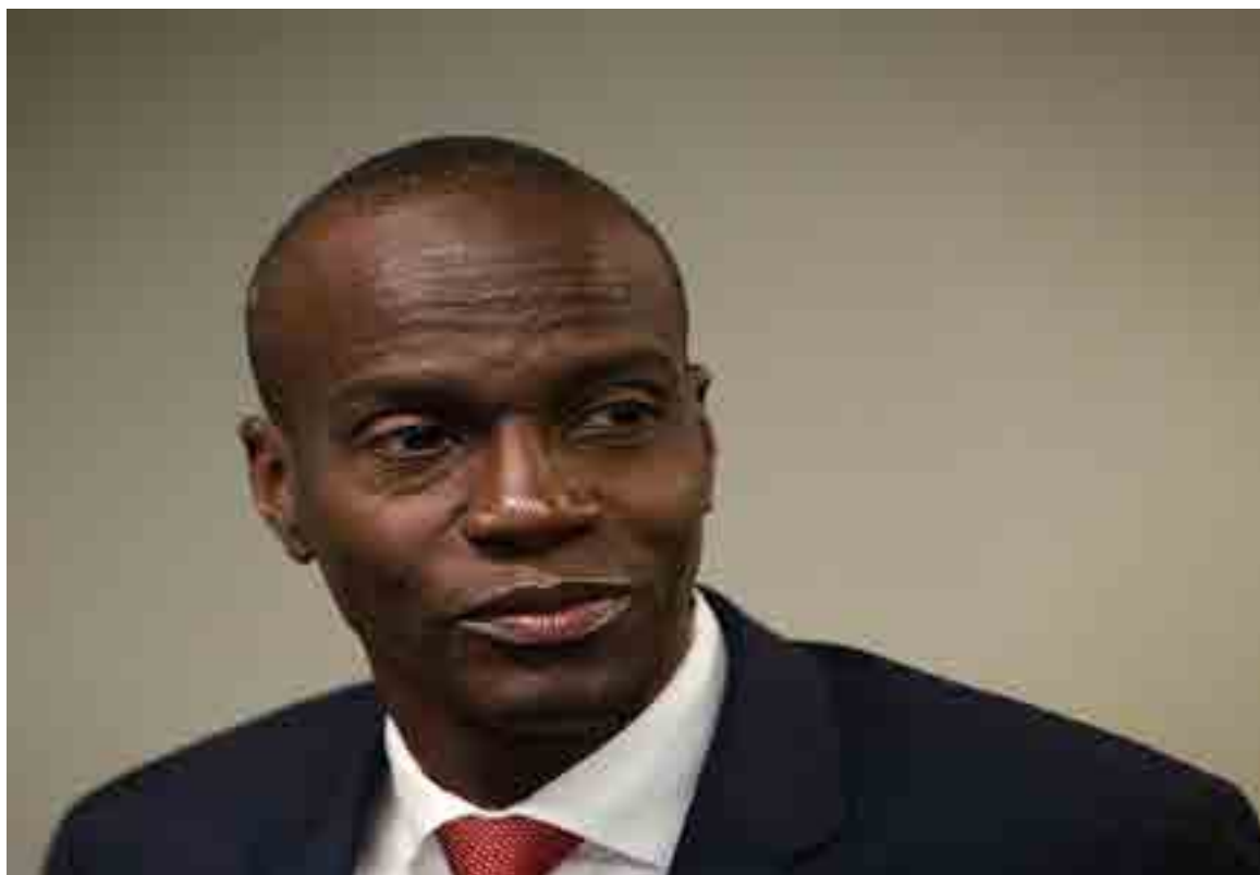
Jovenel Moïse ganó la presidencia de Haití, pero sus contrincantes desconocieron el resultado de las elecciones.