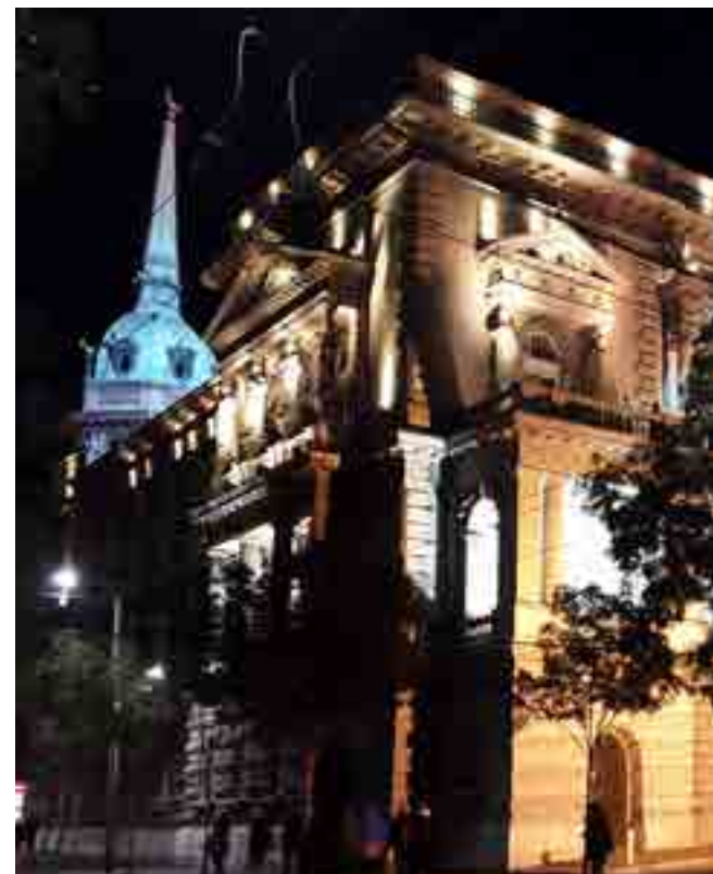
El actual Palacio de Gobierno, cuya construcción data del siglo XIX, fue sede del Ministerio de Relaciones Exteriores durante la dinastía de los Karadordevic.

Un paseo mínimo por esa Belgrado, es lo que Orbe quiere compartir con sus lectores en este fotorreportaje.