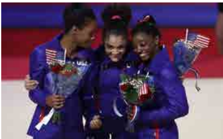
El equipo olímpico estadounidense tampoco escapa al abuso sexual.

Por Alejandro Martínez Martínez deportes@prensa-latina.cu