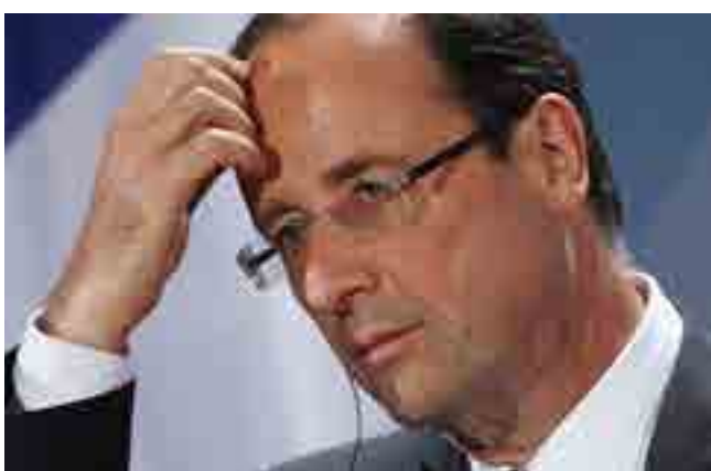
Resignado ante su impopularidad, Hollande renunció a la reelección.

Por su parte, el Partido Europa Ecología Los Verdes realizó unas primarias en las que Cecile Duflot —su cara más conocida— quedó sorpresivamente eliminada y resultó vencedor Yannick Jadot.