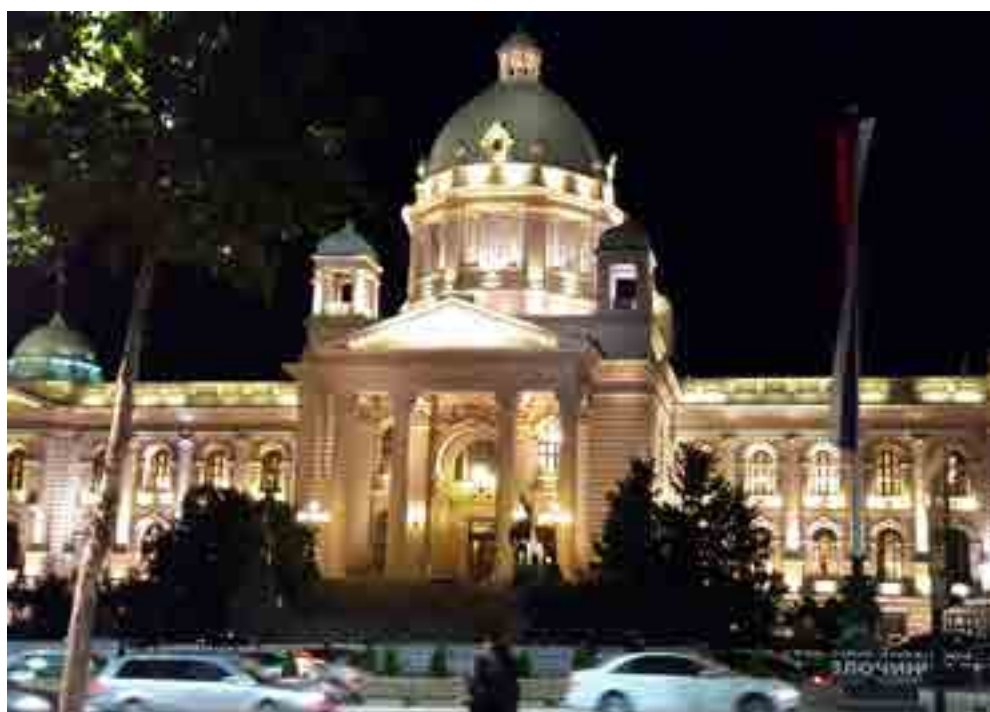
Luego de 17 años de construcción, la sede del Parlamento serbio quedó terminada en 1936.