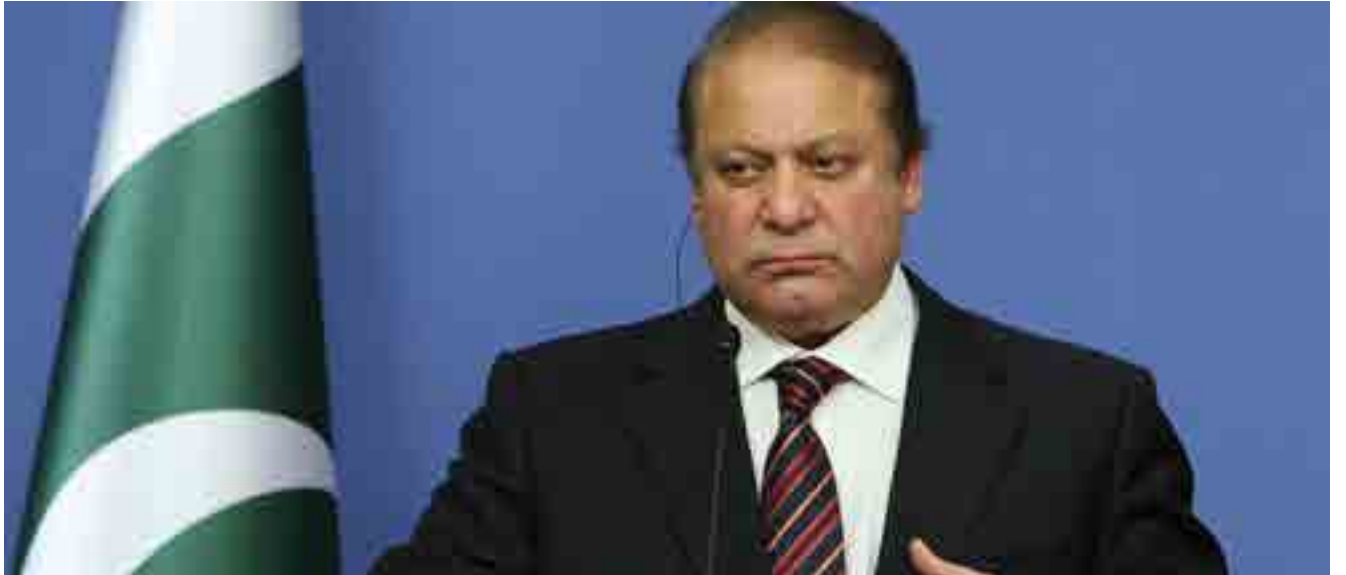
El jefe de Gobierno trata de distanciarse del escándalo.

De su lado, la Junta Federal de Ingresos ya envió avisos a aquellos relacionados con ambos casos cuyas identidades y direcciones exactas están disponibles, mientras la Dirección