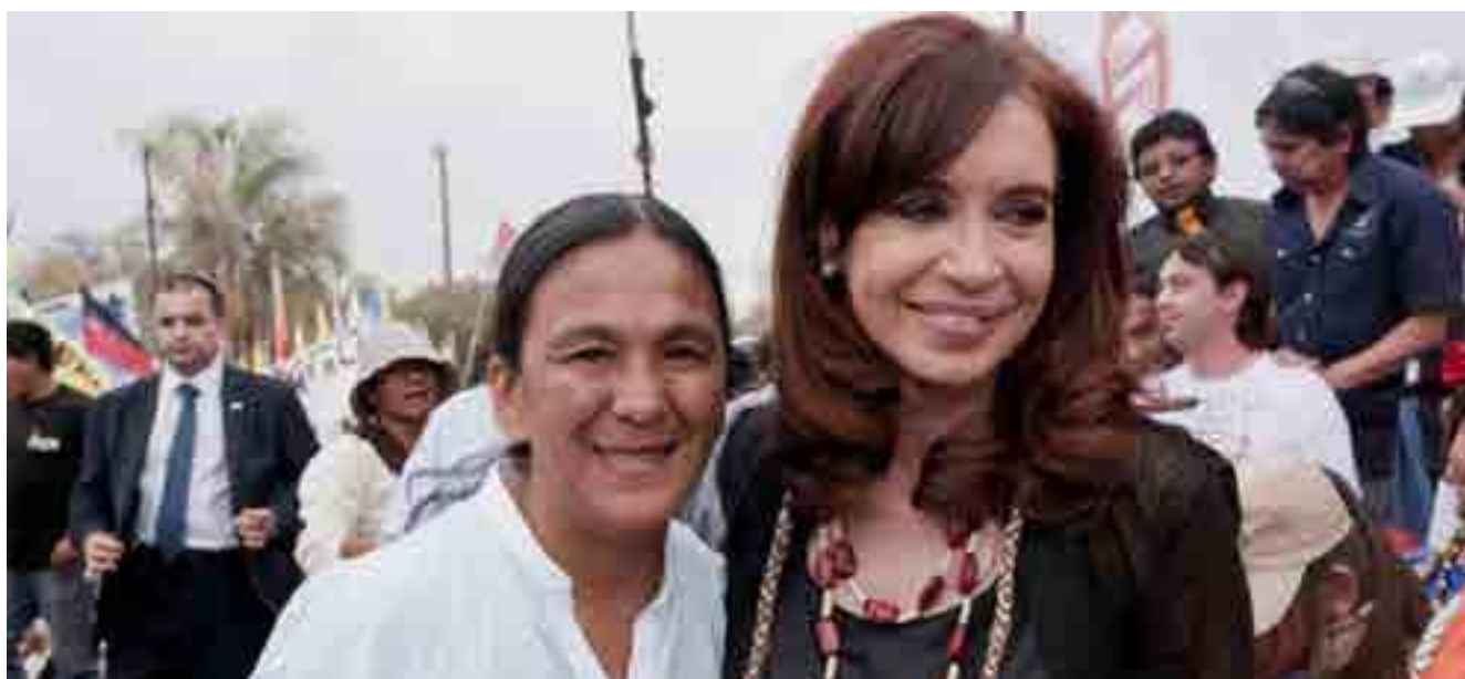
A Milagro Sala no le perdonan su apoyo a la exmandataria argentina, Cristina Fernández.

En octubre, el Grupo de Trabajo de Naciones Unidas pidió liberarla tras calificar su encarcelamiento como arbitrario