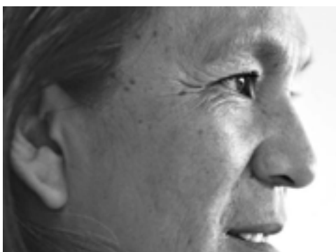
Milagro y su voz urticante