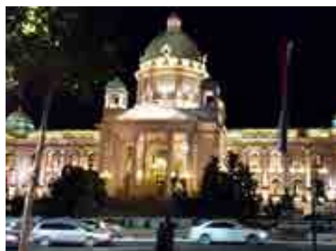
La ciudad blanca del Sava