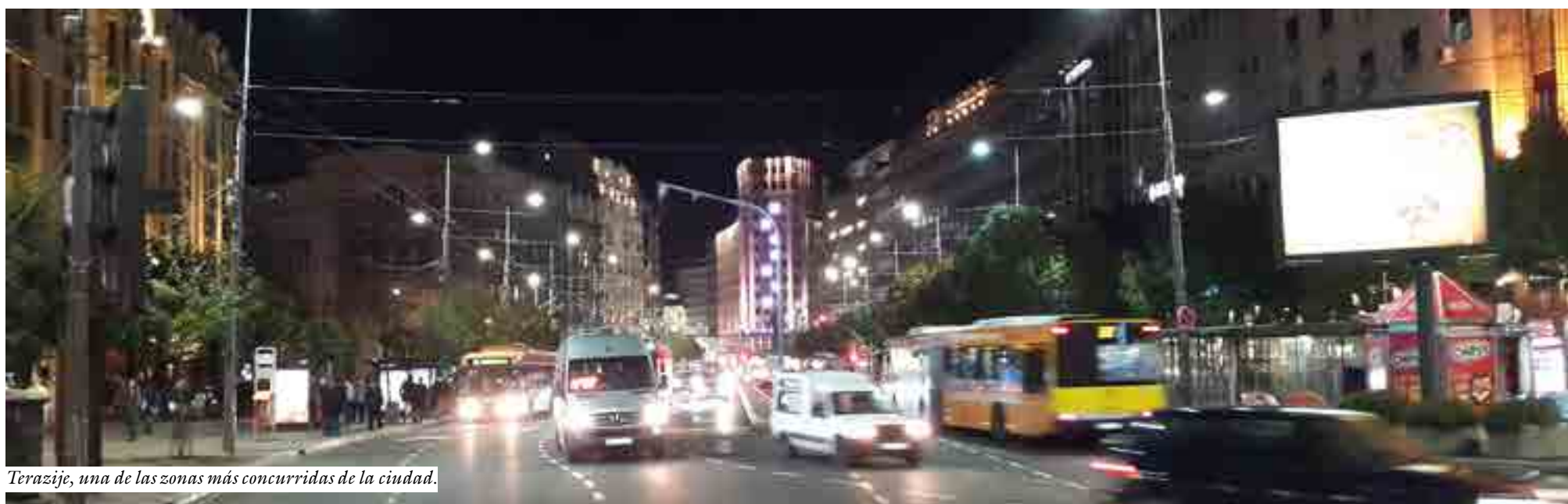
Terazije, una de las zonas más concurridas de la ciudad.