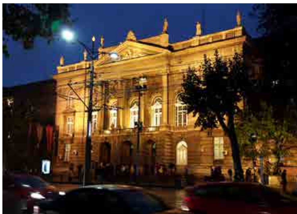
Vista parcial del campus de la Universidad de Belgrado.