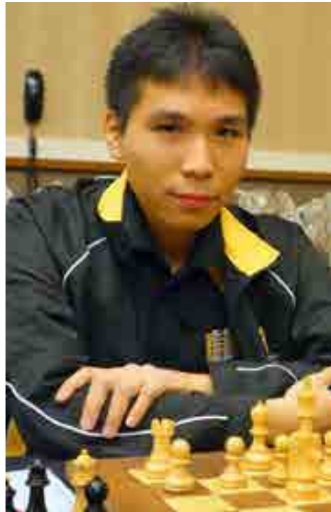
Wesley So, el genio filipino-estadounidense, ganó por fin un torneo grande.

Por su crecimiento como jugador y sus resultados más recientes, So es promocionado junto a Caruana como los dos jugadores más propensos a luchar por el campeonato mundial en el futuro cercano.