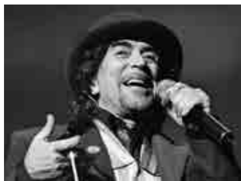
Siempre irreverente Sabina