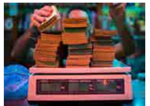
Venezuela rompe conjura del billete