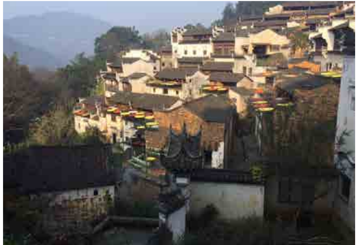
Los artistas llegan a este pueblo en busca de sosiego, hartos del bullicio ciudadano.