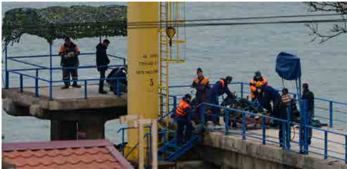
Las autoridades rusas movilizaron miles de efectivos y medios para rescatar los cadáveres.

Con 7 000 actuaciones ante más de siete millones de espectadores, el conjunto Alexandrov viajó a decenas de países para llevar el sello soviético y luego el ruso y acompañó a