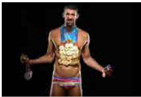
Phelps conquistó 23 títulos en Juegos Olímpicos.

Esas conquistas, sumadas a sus 26 títulos en campeonatos mundiales y 39 récords planetarios (seis vigentes), lo convierten en el tritón más deslumbrante de todos los tiempos, mejor incluso que los míticos Mark Spitz y Johnny Weissmuller, aquel Tarzán olvidado.