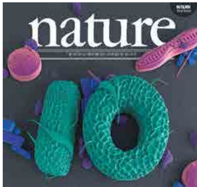
La prestigiosa publicación divulga su top 10 cada año.

Este antiguo juego oriental de estrategia es considerado como un gran reto para la inteligencia artificial, debido a la complejidad de planear las posiciones y los movimientos en el tablero.