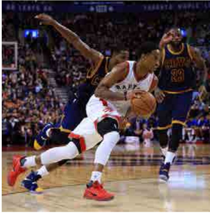
DeMar DeRozan, pieza fundamental en las aspiraciones de los Raptors.

Esta vez, la gestión está dando sus frutos y la progresión de jugadores como DeMar DeRozan y Kyle Lowry han resultado fundamentales para que los Raptors aparezcan entre los tres primeros conjuntos más anotadores por partidos, con 111,4 puntos, detrás de