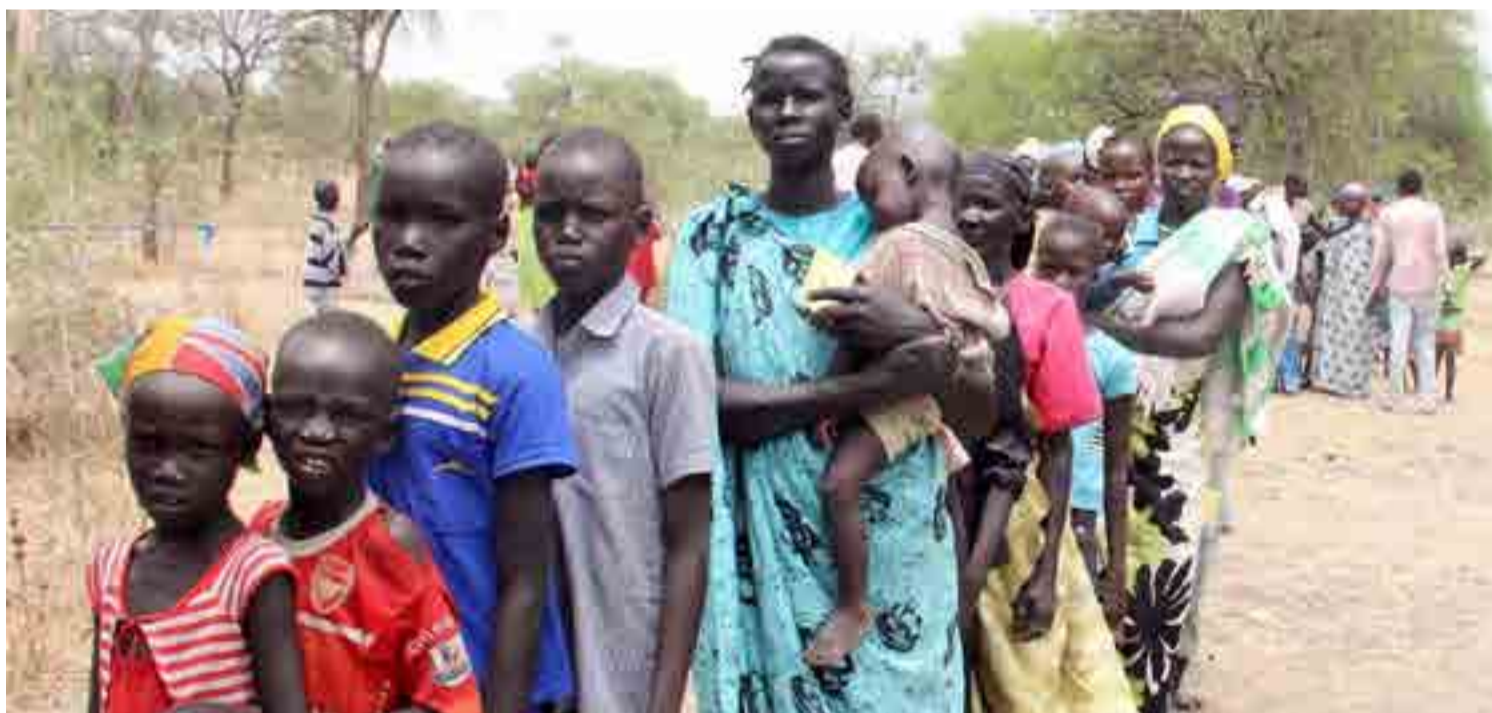
Además de las masacres de carácter étnico, el conflicto entre el presidente Salva Kiir y su vicepresidente, ocasionó un éxodo de desplazados.