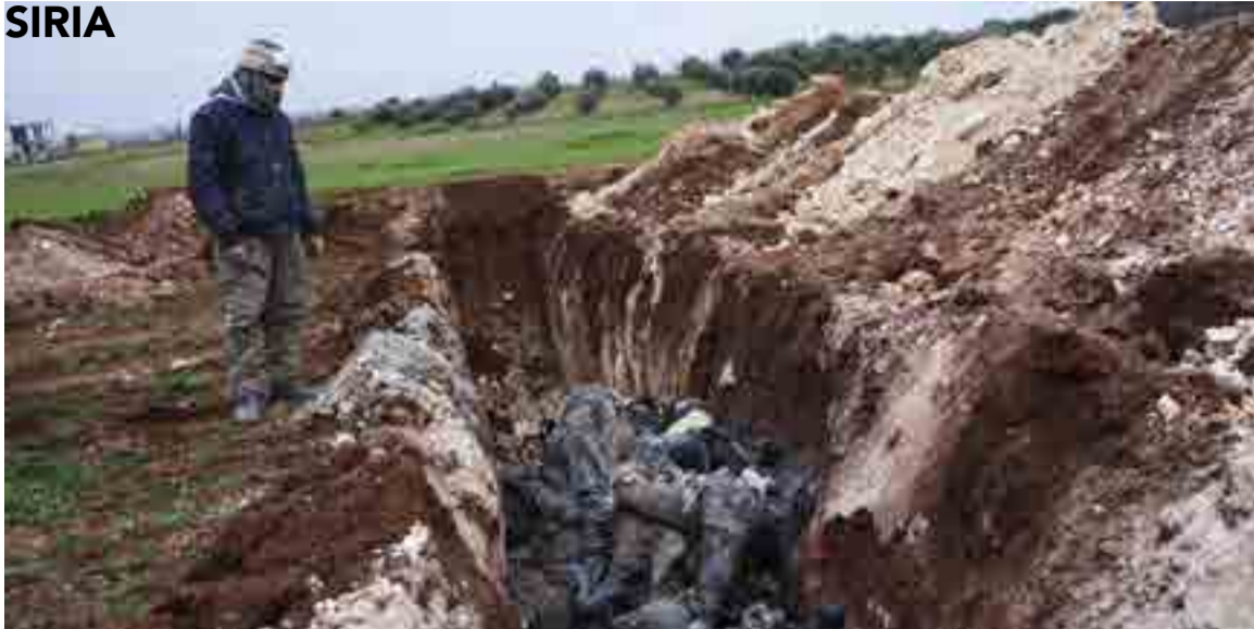
Los hallazgos de tumbas colectivas de civiles fueron la primera sorpresa tras la reconquista de Alepo.