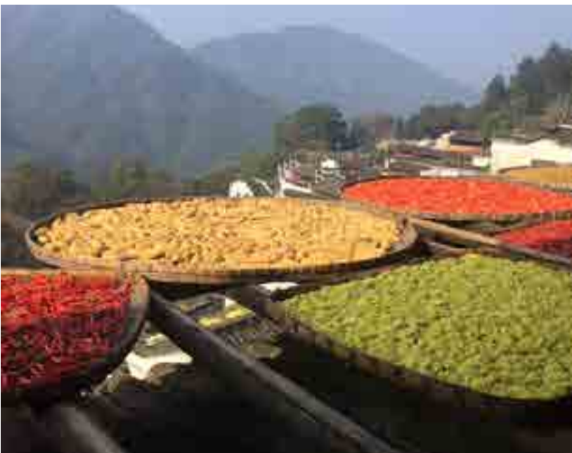
El secado de flores en los tejados: una costumbre que data de hace siglos.