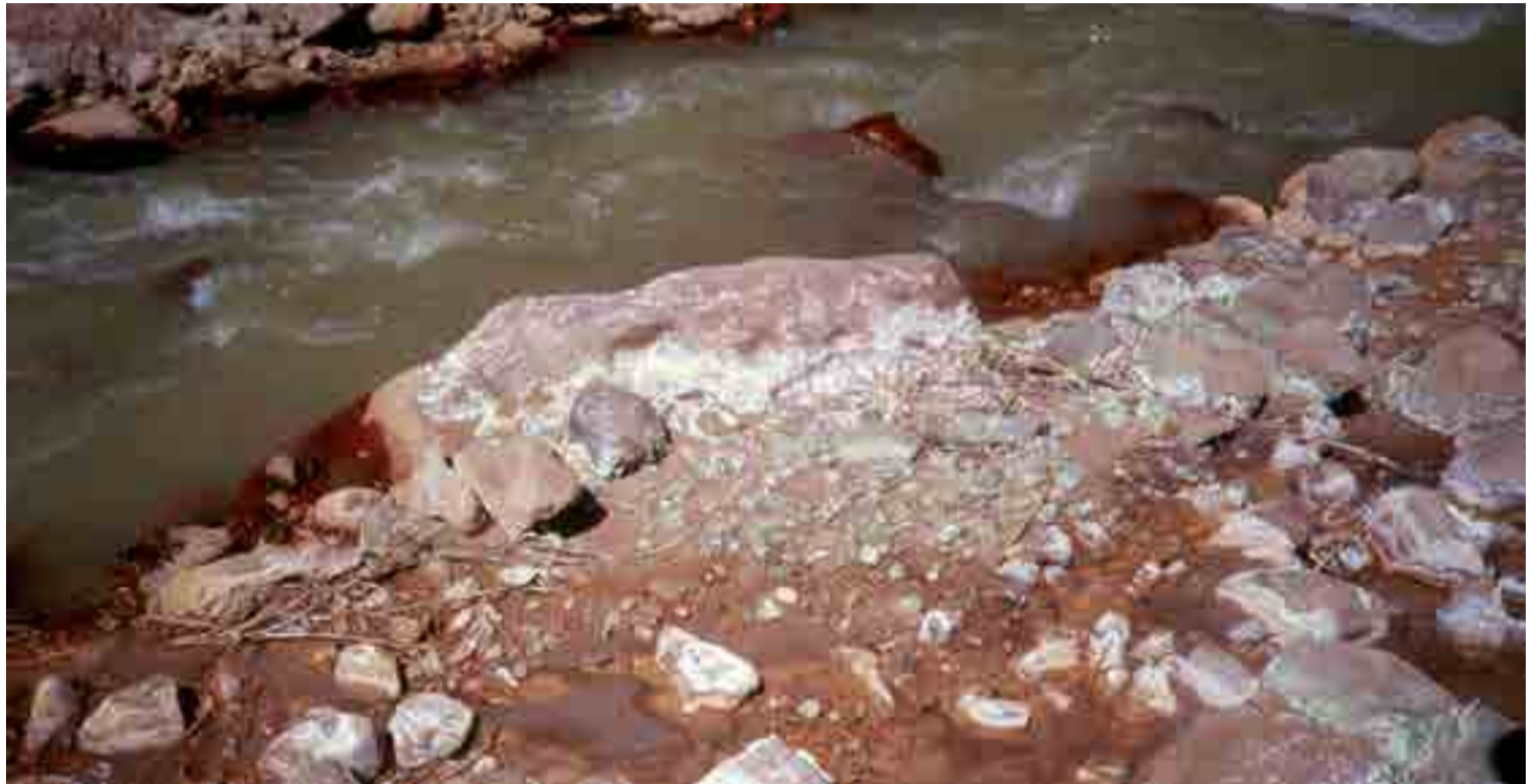
El agua data de hace 2 000 millones de años.

Para sorpresa general, esa agua fluía libremente y no estaba encapsulada en una formación rocosa como muchos geocientíficos habían supuesto.