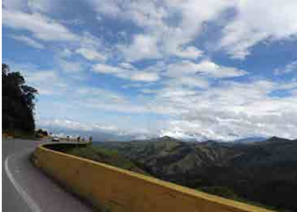
Entre el asombro y el vértigo, las montañas de Colombia.

Algunas de ellas forman parte del Parque del Café, un itinerario que permite apreciar el proceso para obtener el famoso "néctar negro".