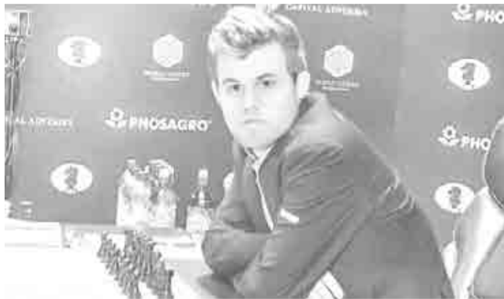
Carlsen rige en el ajedrez mundial.

De tal manera, la tensión continuó en los siguientes enfrentamientos para los dos ajedrecistas hasta que llegó la décima partida y considerada decisiva para Carlsen, toda vez que si perdía o empataba podría deponer prácticamente las armas, en tanto si ganaba se mantendría en liza por la reconquista de la corona del orbe, lo cual sucedió.