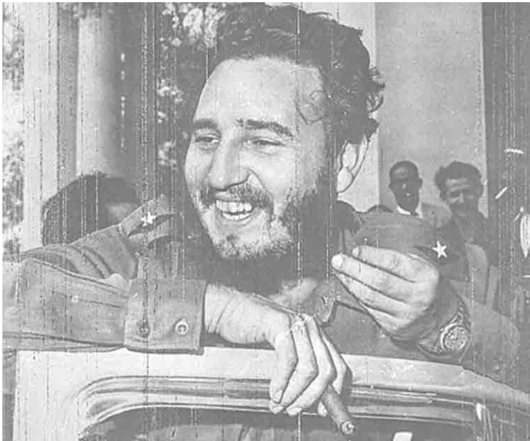
Primera radiofoto transmitida por Prensa Latina, enero de 1962.