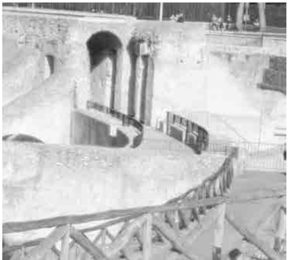
En las catacumbas los gladiadores esperaban el momento de vencer o morir.