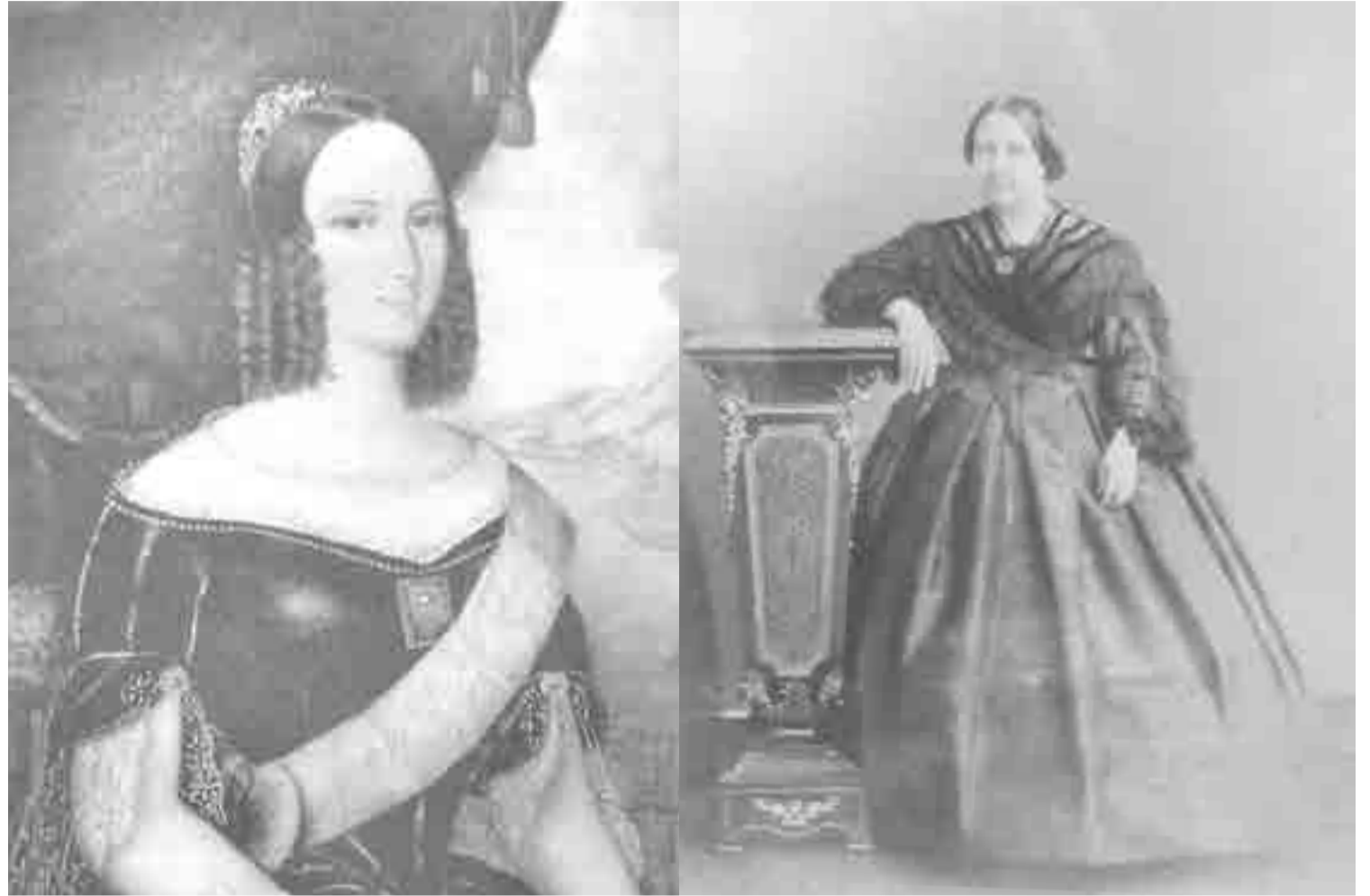
El emperador esperaba esto... y le mandaron esto.

El éxito del AirBrush en Brasil responde no solo a su funcionalidad y a las posibilidades que ofrece al editar fotos con calidad profesional, sino al hecho de ser gratuito, a