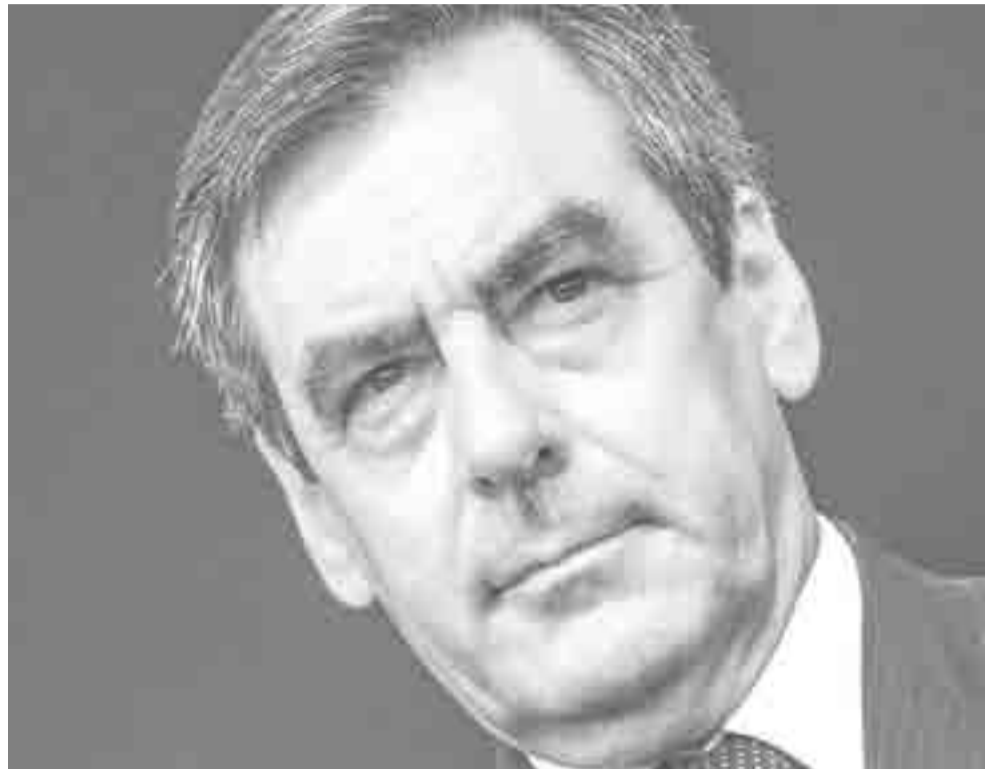
A sus 62 años, Fillon surge como alternativa a la ultraderecha gala.

Paralelo a ello, se vaticina que el ultraderechista Frente Nacional (FN) consiga mejo-