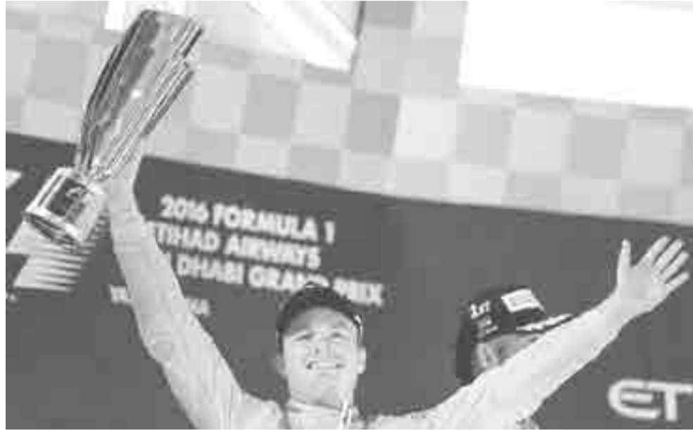
Rosberg se proclamó monarca mundial de Fórmula Uno por primera vez en su carrera.

La abrumadora estabilidad de Rosberg y Hamilton signó la temporada. Los pilotos de Mercedes se impusieron en las citas de Abu Dabi, Japón, Brasil, Singapur, México, Estados Unidos, Italia, Alemania, Hungría, Bélgica, Inglaterra, Europa, Austria, Canadá, Rusia, China, Bahrein, Mónaco y Australia. En total, solo dejaron escapar el sitio de honor en dos grandes premios.