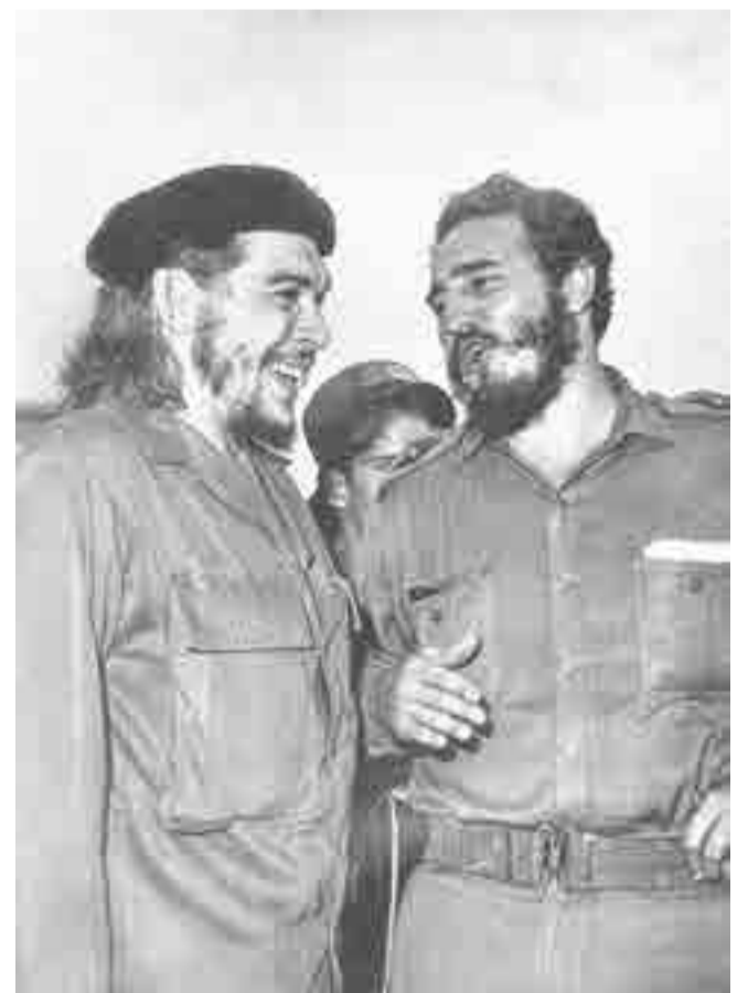
La Habana, 1963.