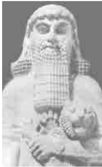
La epopeya de Gilgamesh contiene la primera mención conocida sobre el mito bíblico del diluvio.

Pero todavía resta una última revelación: el poema menciona un diluvio que sumergió villas y montañas, seres vivientes e inanimados, del que se salvó una pareja de hombres elegida por los dioses. Esta analogía llevó a la conclusión de que durante alguna de sus diásporas, el pueblo judío conoció el mito y lo utilizó para enriquecer el Antiguo Testamento con la saga de Noé y su insubmersible arca.