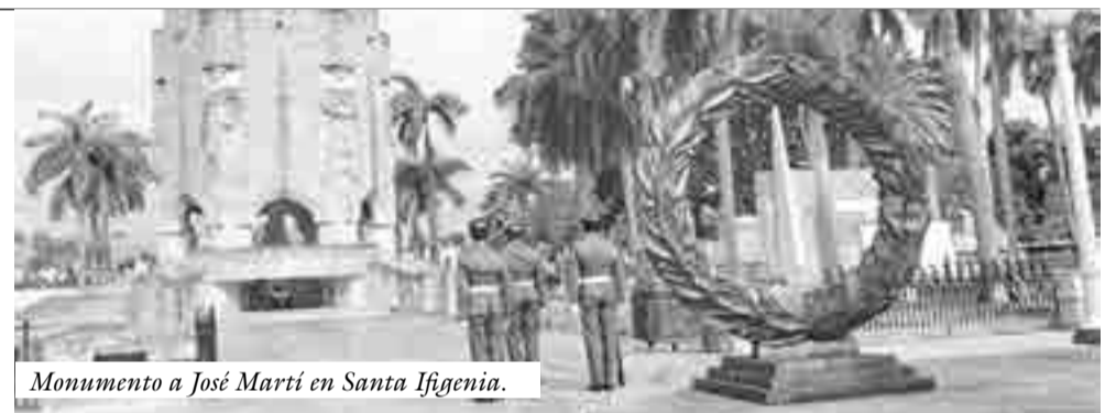
Monumento a José Martí en Santa Ifigenia.

De acuerdo con Ramonet, "es una manera de mostrar nuestra adhesión a lo que Fidel representa como líder y como persona, y también una manifestación de solidaridad con Cuba y con el pueblo revolucionario latinoamericano".