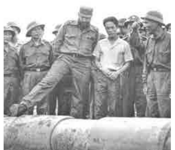
Vietnam del Sur, 1973.

Xi Jinping, presidente de China: "Sus conocimientos auténticos y perspicacia profunda me inspiraron".