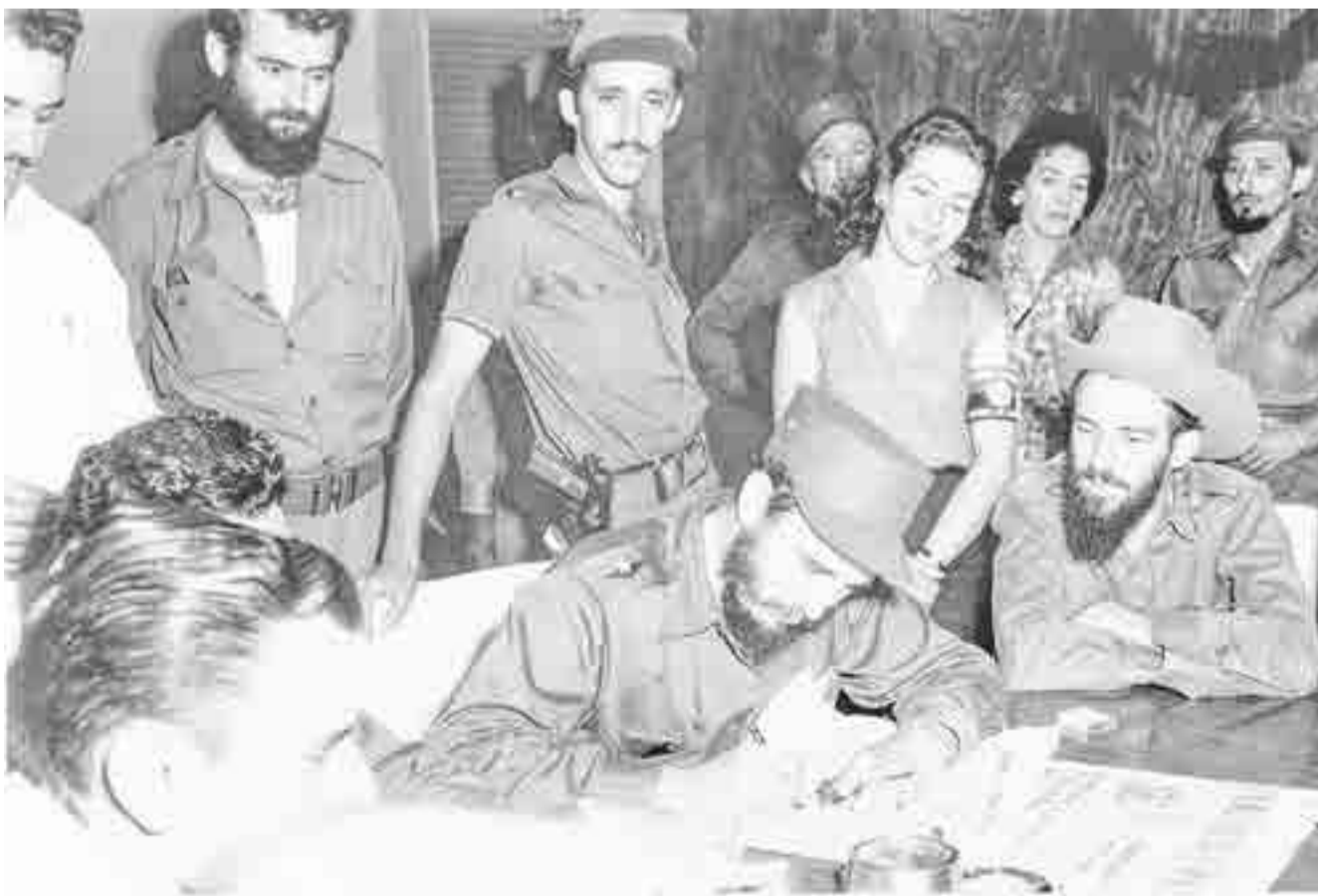
La Habana, 1959.