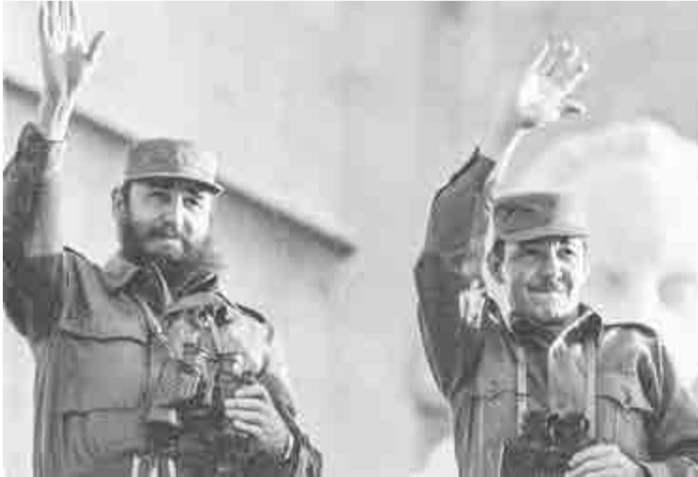
La Habana, 1973.