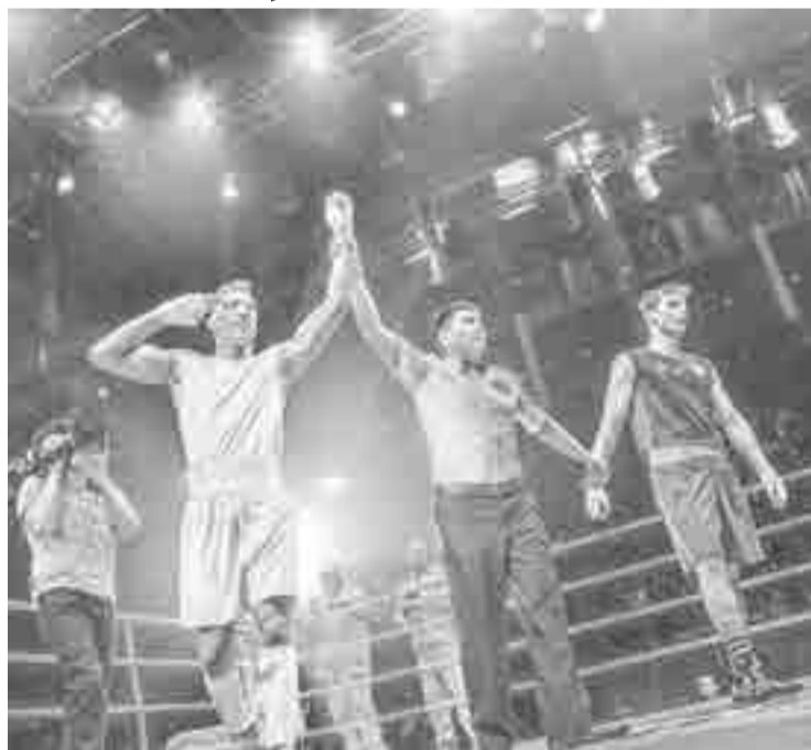
Cuba vuelve al primer plano en el boxeo juvenil mundial.

Por Alfredo Boada Mola deportes@prensa-latina.cu