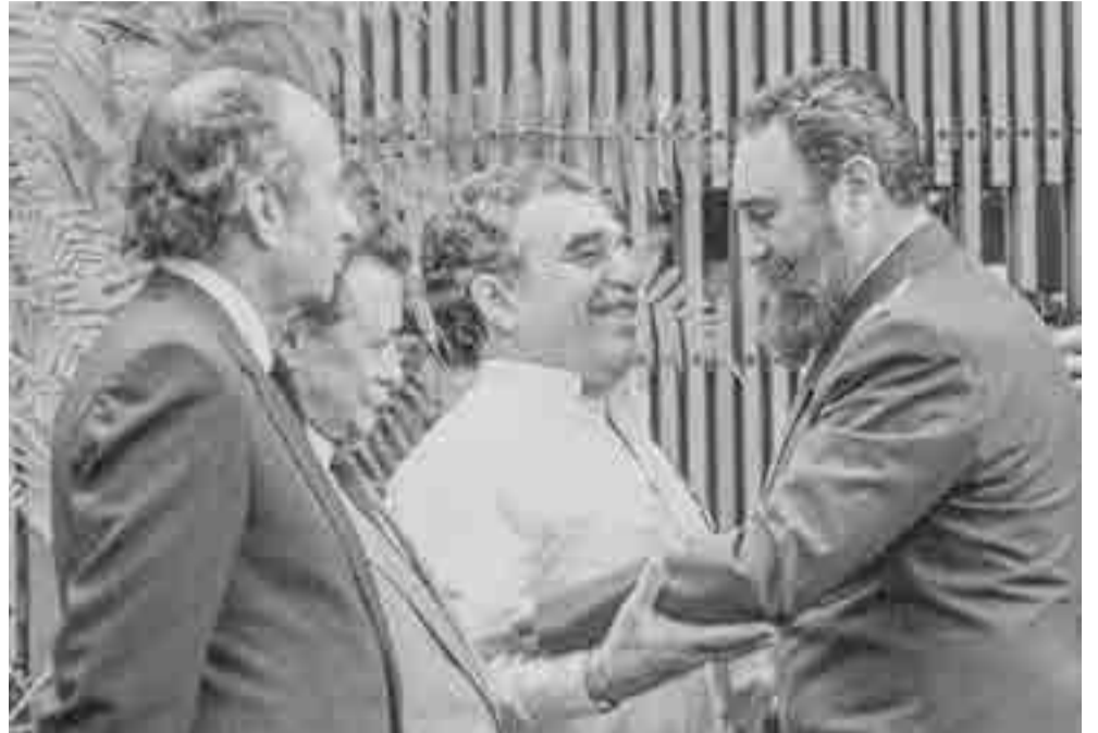
La Habana, 1983.