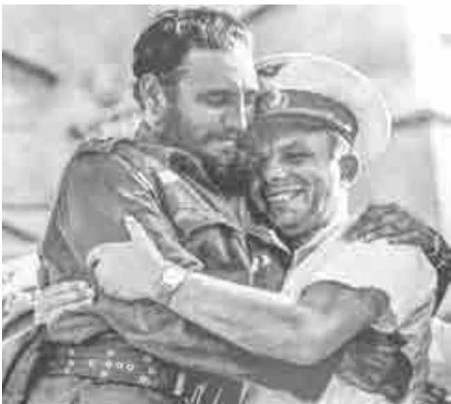
La Habana, 1961.

Abdelaziz Bouteflika, presidente de Argelia: "Con su desaparición, pierdo un amigo y un compañero de más de medio siglo".