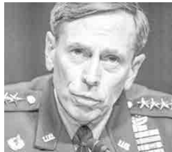
El general David Petraeus, involucrado años atrás en un escándalo de faldas, podría ser el próximo jefe de la diplomacia estadounidense.

El posible nombramiento de casi una decena de exgenerales para altos cargos, constituye para algunos una evi-