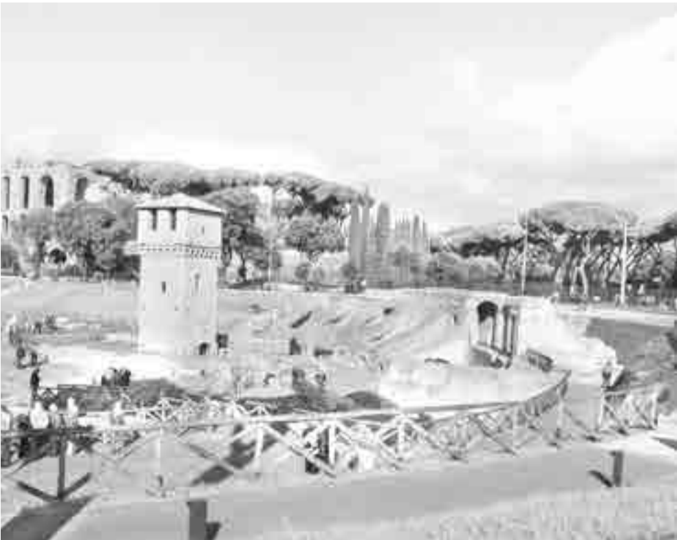
La ruinas atraen a miles de turistas cada año.