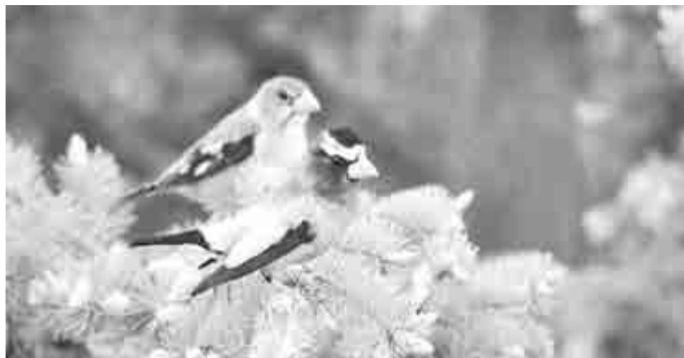
Su capacidad para negociar pudiera ser la envidia de miles de comunidades en el mundo.

Los investigadores han recogido datos de los periodos de incubación de 32 especies de aves durante más de 20 años, desde 1994 hasta 2015. En total, han estudiado