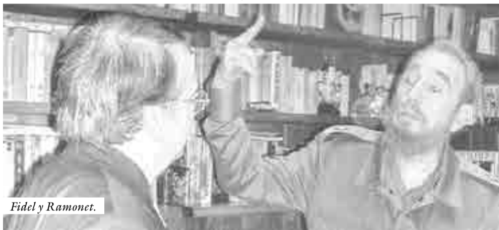
Fidel y Ramonet.