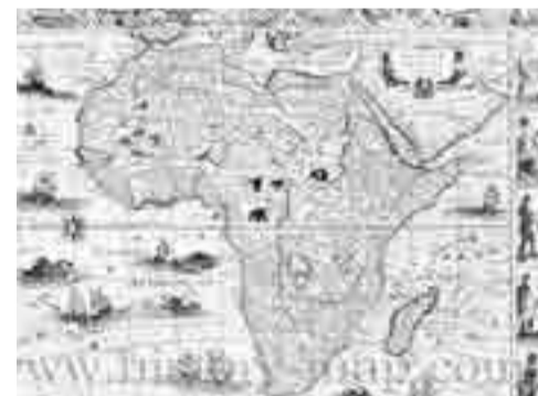
Para los especialistas, la historia de África ya era vieja cuando Europa nació.

Las entregas de esa región a la ciencia son tales y tan subestimadas que el científico británico Gerald Massy en su libro Antiguo Egipto: la Luz del Mundo (1907), se lamentaba