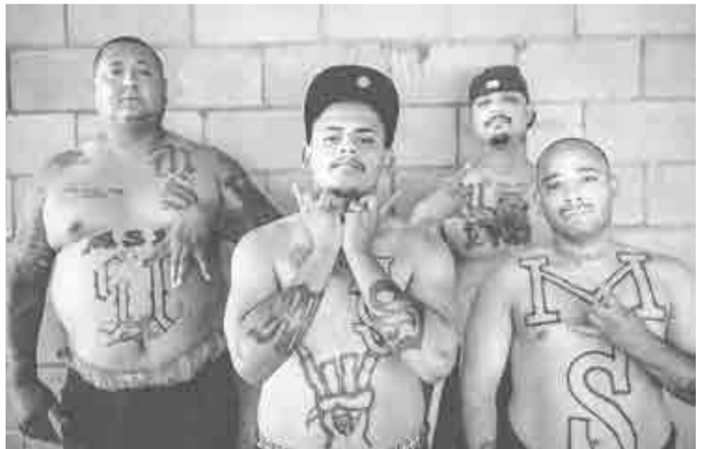
Las maras en la mirilla de la recién creada fuerza multinacional.

Esta iniciativa ha sido elaborada respetando la legislación de cada país, las leyes internacionales y los convenios sobre derechos humanos, según declaraciones de los presidentes.