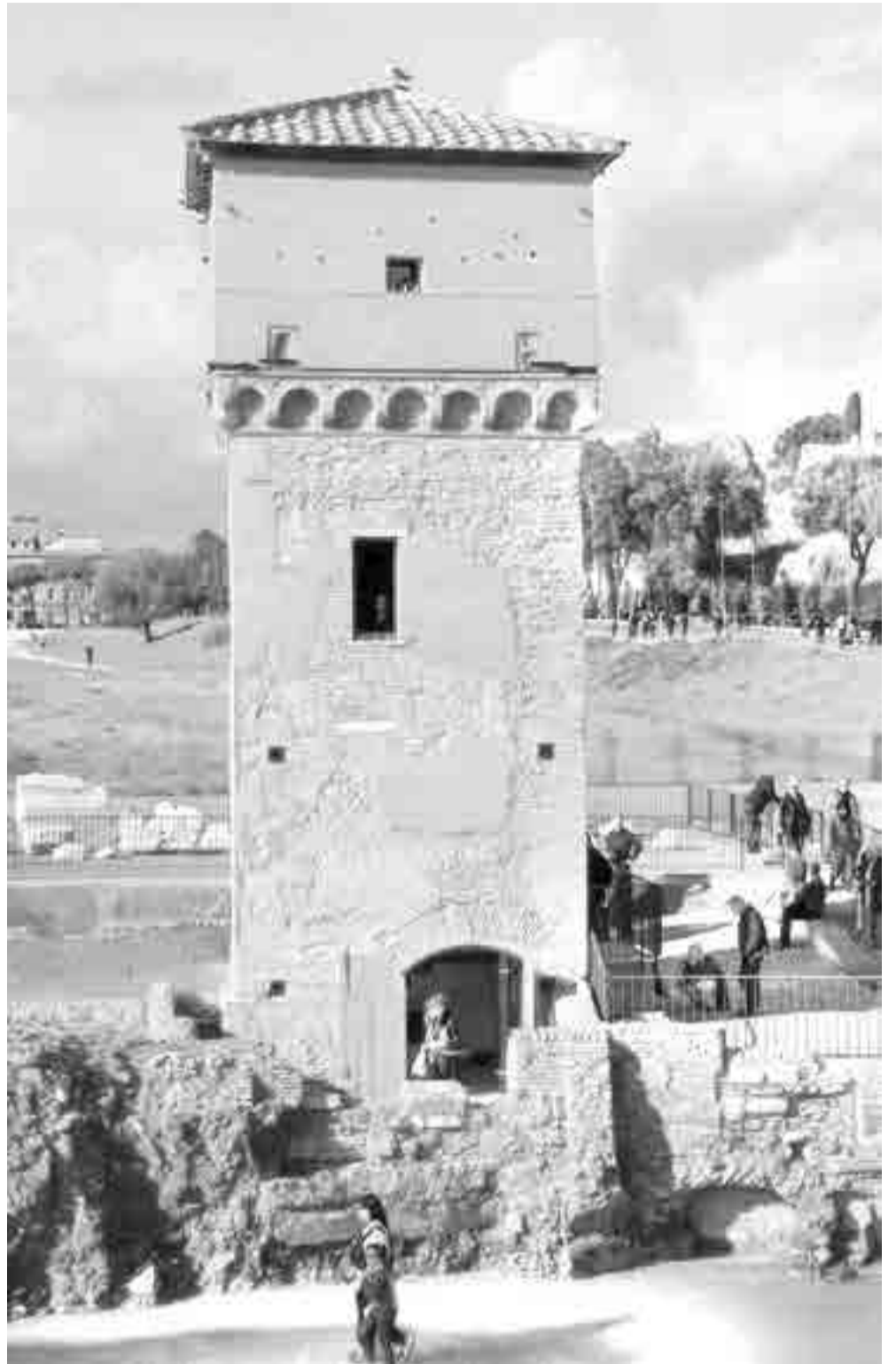
Erigida en el siglo XII a.n.e., la torre de la Moletta fue restaurada para reforzarla.

Pero la atracción popular del Circo Massimo llega hasta nuestros días. En julio de 2006 acogió los festejos por la Copa Mundial de Fútbol ganada por Italia y en el 2014, el grupo musical The Rolling Stone ocupó este lugar en su gira 14 OnFire.