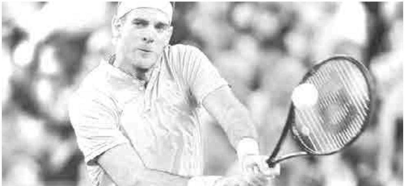
Del Potro fue la clave del triunfo de Argentina.

En este momento llueven los elogios y nacen las leyendas. Ni los más escépticos pueden lanzar sus mantos de apatía y