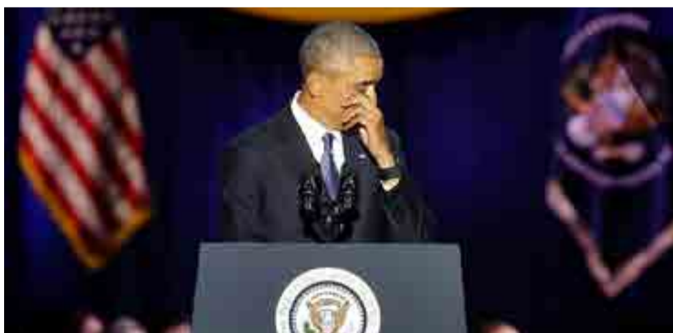
Obama se marcha con su legado en ascuas.

"El trabajo de la democracia es duro, polémico y en ocasiones sangriento. Por cada dos pasos hacia adelante, a menudo parece que damos uno hacia atrás", reconoció el mandatario saliente, cuyo legado peligra con Trump.