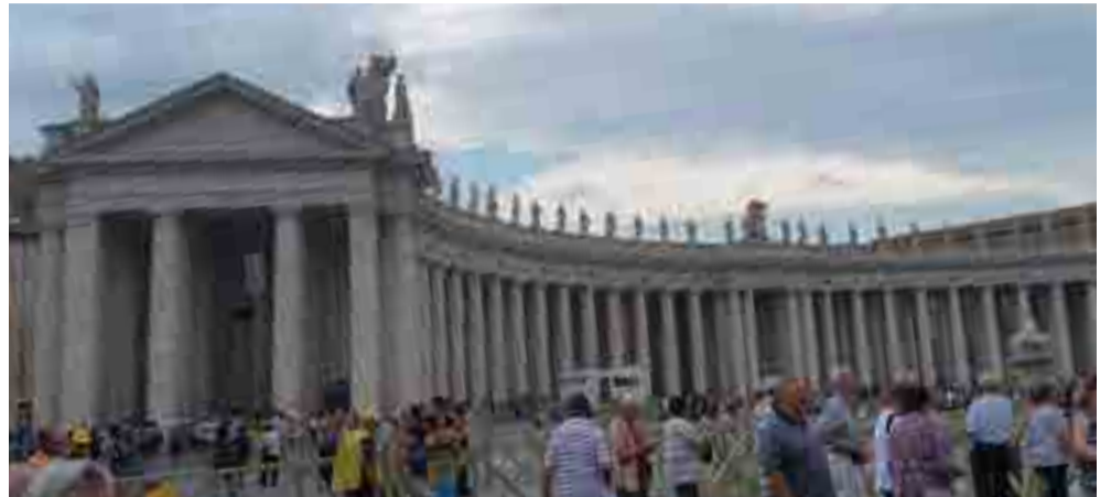
La columnata de Bernini rodea la gran plaza, en un abrazo que simboliza la unión de la humanidad cristiana.

La plaza Navona es punto de encuentro de pintores, músicos y artistas callejeros, quienes regalan y venden su arte al visitante.