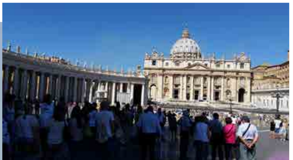
En la Basílica de San Pedro reposan los cuerpos de la mayoría de los papas.