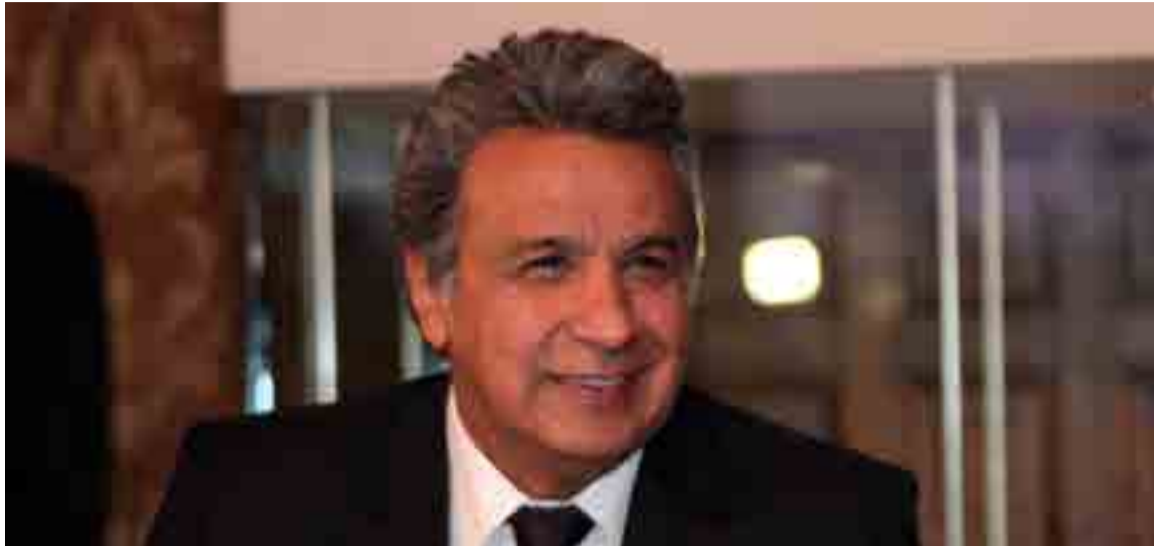
Lenín Moreno está llamado a continuar la Revolución Ciudadana iniciada por el presidente Rafael Correa.