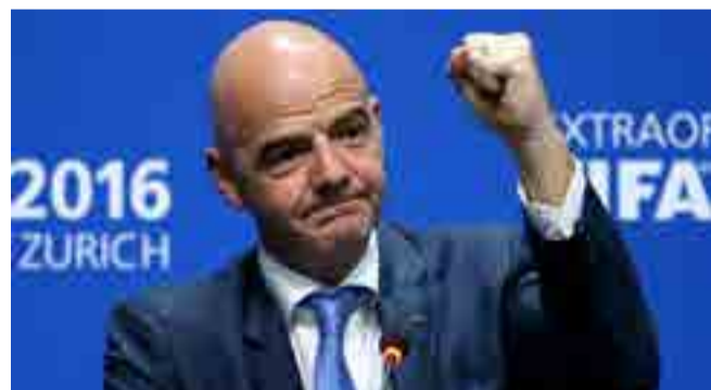
Gianni Infantino, principal artífice de la reforma.