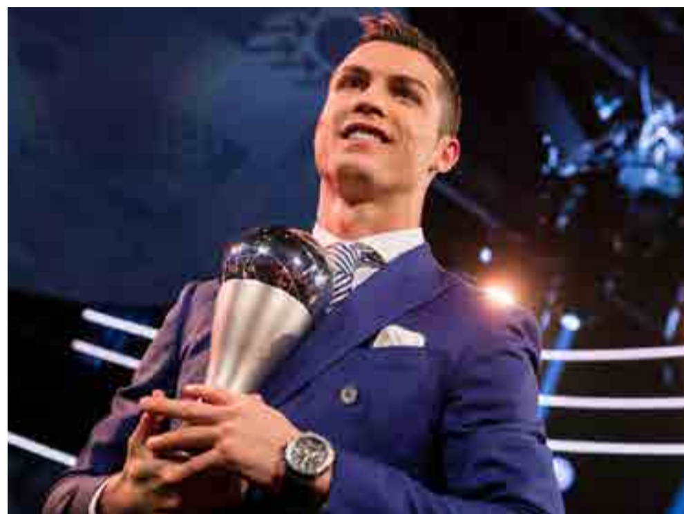
Ronaldo ganó el trofeo The Best.

En su debido momento, Ranieri será canonizado en Leicester City. San Claudio aseguró un puesto de privilegio en la historia del fútbol inglés. El primer título de todos los tiempos de los foxes, un club fundado en