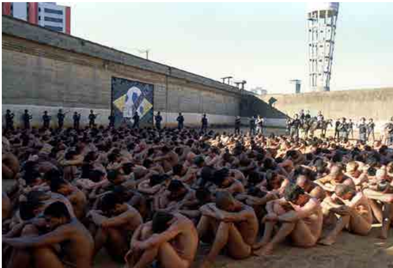
El Infierno de Dante escenificado en dos cárceles brasileñas.

Amazonas es el estado brasileño con mayor superpoblación penal, pues el número de reclusos en la actualidad es 230 veces superior a las capacidades de que dispone el sistema penitenciario allí.