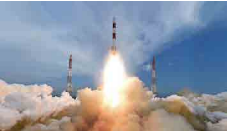
La prueba del nuevo cohete portador indio exacerbó la carrera armamentista con Pakistán.

Por Roberto Castellanos Corresponsal jefe/Nueva Delhi