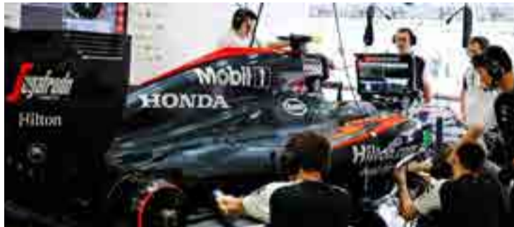
McLaren Honda pudiera ser la gran sorpresa en 2017.

A todas luces viene una nueva era para McLaren Honda. Con esas evoluciones, los monoplazas de esa escudería se acercarán a los 1 000 caballos de potencia y reducirán las diferencias con los motores de Mercedes, el gran dominador de la Fórmula Uno en las últimas tres temporadas.