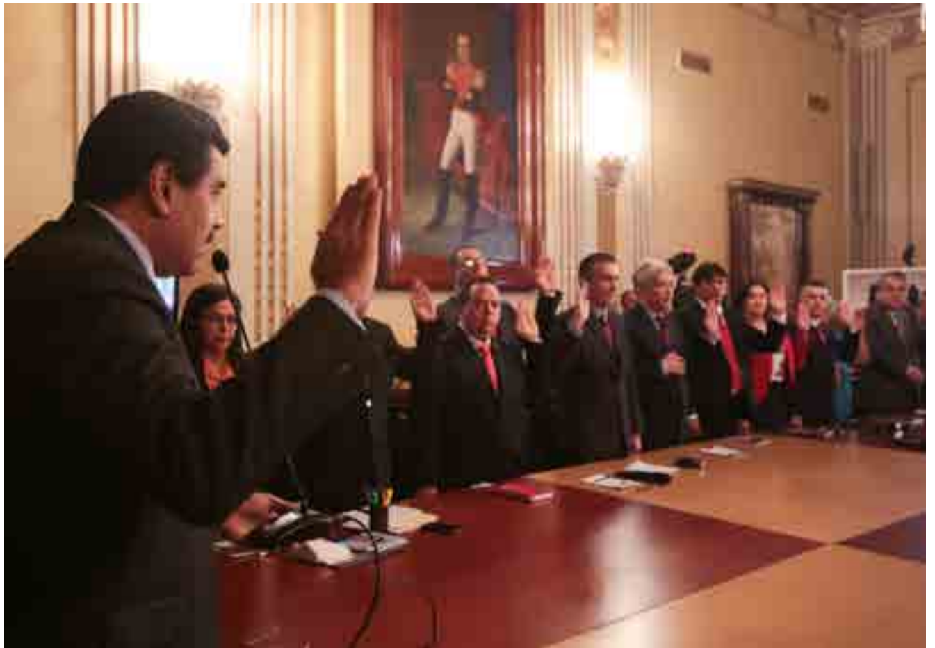
Los cambios buscan fortalecer la gestión del Gobierno ante la población.

Antes de emprender la ruta, sin embargo, el mandatario sustituyó a varios de los que dirigieron la resistencia durante 2016 y a otros les cambió sus responsabilidades, con el alegato de que así garantiza la eficiente aplicación del Plan de la Patria, legado programático del comandante Hugo Chávez.