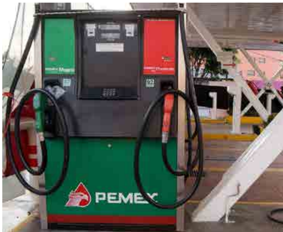
Casi dos centenares de estaciones de expendio de gasolina han cerrado sus puertas desde la entrada en vigor de la medida.

También anunció un programa de apoyo al transporte masivo, que podría extender-