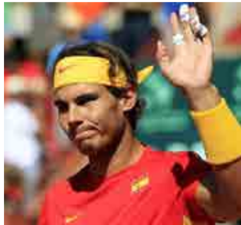
Nadal estuvo ausente y España cayó ante Serbia.

Julien Benneteau y Nicolas Mahut dieron a Francia la victoria en dobles sobre Jamie Murray y Dominic Inglot. Lucas Pouille y Jérémy Chardy vencieron respectivamente a Kyle Edmund y Daniel Evans. Luego, Evans derrotó a Benneteau, y Chardy a Edmund, para poner las cifras definitivas al encuentro.