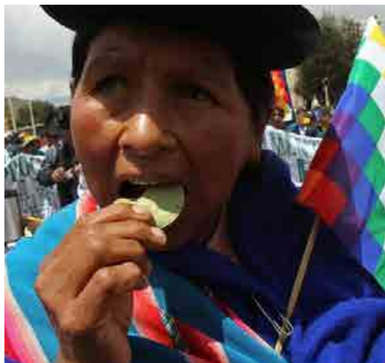
En Bolivia el masticado ya es permitido.

El reto ahora es industrializarla, convencer a la comunidad internacional sobre sus beneficios y acabar con los prejuicios en torno a este cultivo milenario.