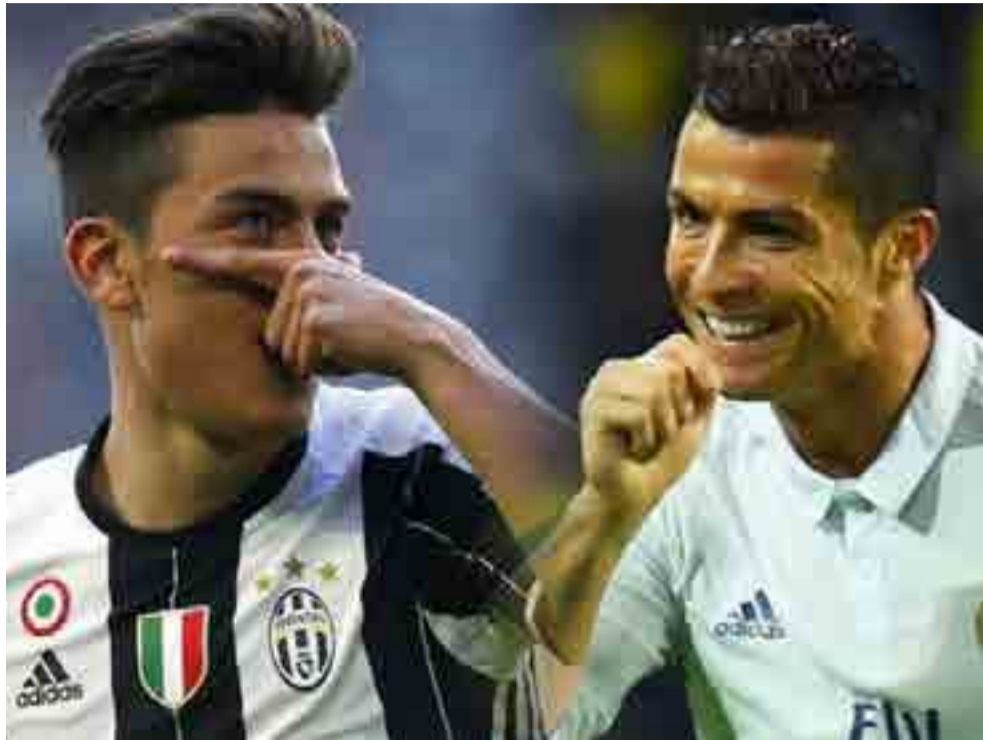
Dybala y Cristiano, los comandantes de Juventus y Real Madrid.

Si la faena de Juventus resultó impecable, también puede calificarse de excepcional la victoria del Real Madrid por 2-1 sobre el Bayern Munich, con doblete de Cristiano, el gran titán de los merengues, el hombre quien, pese a estar en pleno declive, pasará a la historia como uno de los más temibles y voraces atacantes del balompié moderno.