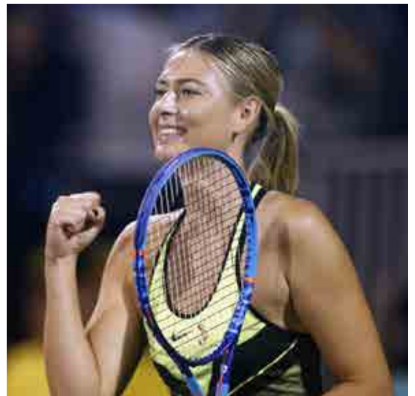
Sharapova ostenta cinco títulos de Grand Slam en su palmarés.

“He estado entrenando muy duro durante los pasados cuatro meses. Un entrenamiento no es lo mismo que un partido, pero sé que mi mente y mi cuerpo tienen la motivación para jugar el mejor te-