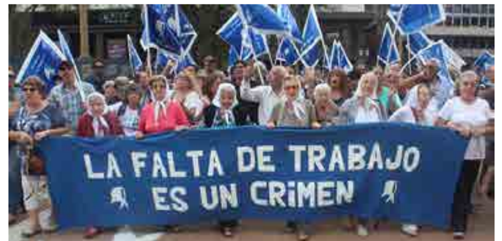
Marcha en apoyo al paro general de los trabajadores.