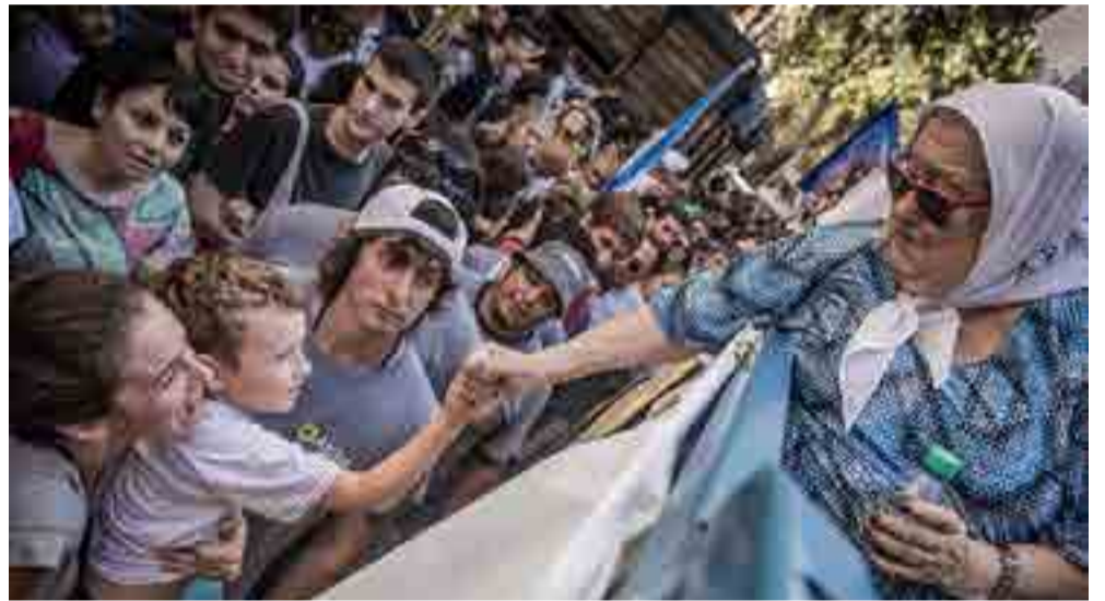
La lucha de Hebe de Bonafini y las Madres es inquebrantable.

podemos estar separados de los niños con hambre ni de la gente que muere en hospitales por falta de atención”.