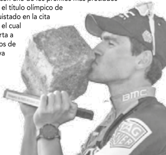
Van Avermaet conquista el primer monumento de su carrera.

Precisamente en la temporada pasada, el rutero belga coronó su actuación con uno de los premios más preciados en el mundo, el título olímpico de la ruta, conquistado en la cita carioca y con el cual lanzó una alerta a sus adversarios de cara a la nueva temporada.