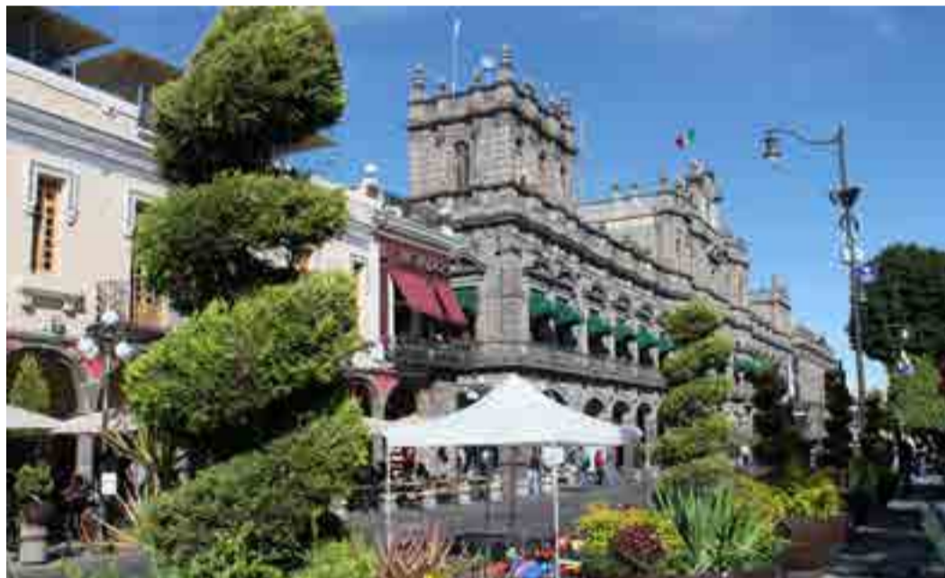
La urbe, enclavada en el centro de México, fue declarada en 1987 Patrimonio Cultural de la Humanidad por la Unesco.