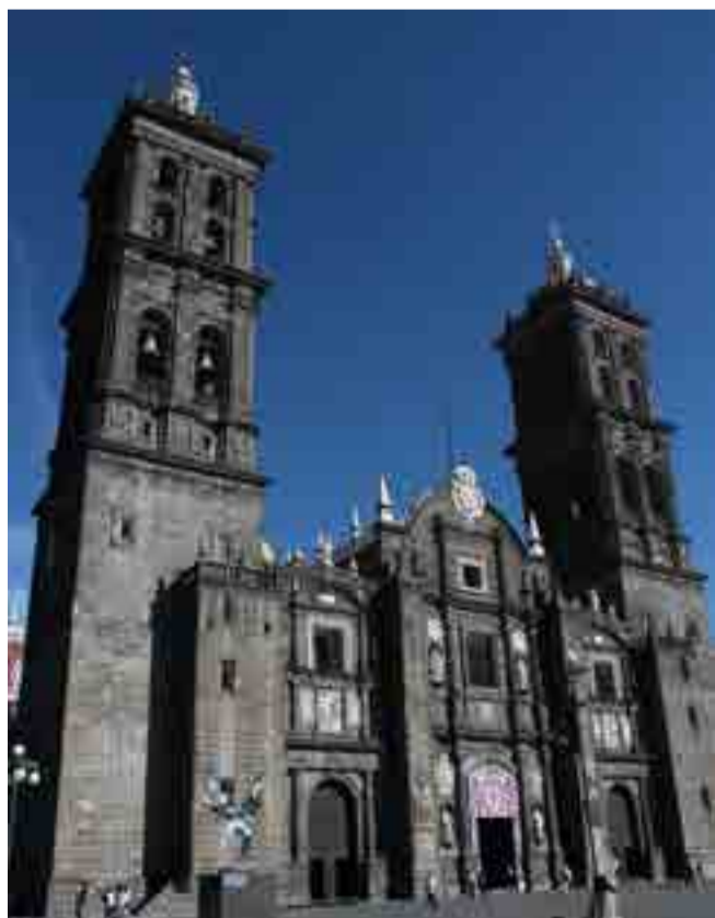
Catedral Nuestra Señora de la Inmaculada Concepción.