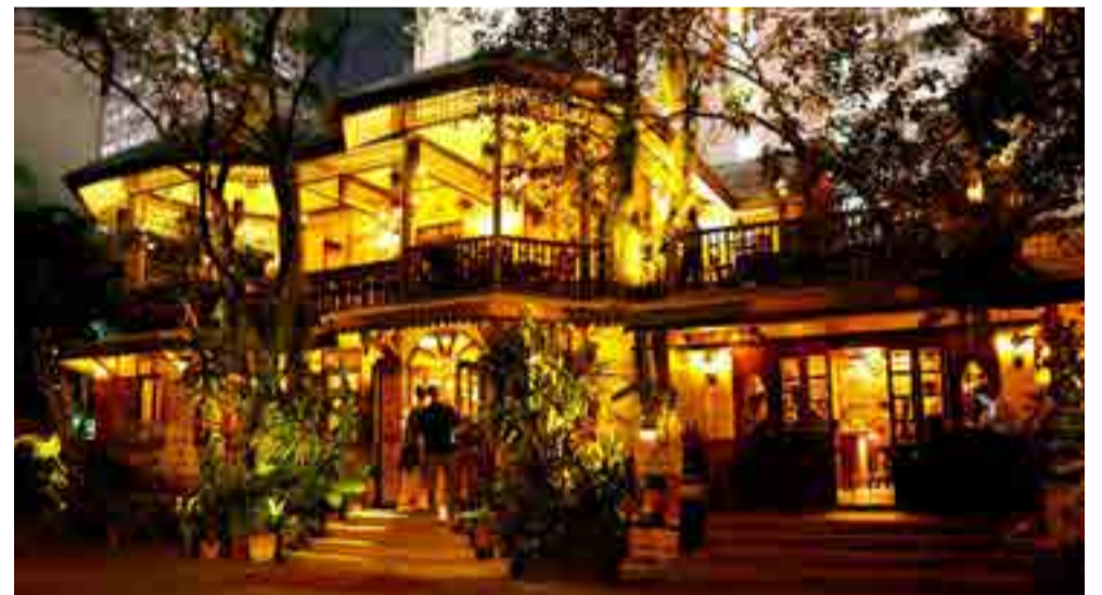
El urbanismo desenfrenado amenaza a este antiguo hotel.

Solo una veintena de los 10 000 edificios históricos en Bangkok están protegidos, lo que da vía libre a las constructoras para poblar la ciudad, a la par que se alerta sobre un potencial desinterés de Bangkok por parte de los turistas.