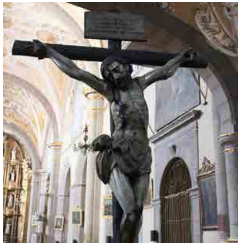
Se le llama "Puebla de los Ángeles", por una fantástica fábula que viajó en el tiempo.

A más de 480 años y en cada amanecer, los poblanos siguen escuchando el repique del carrillón, la gran mole de bronce que los ángeles colocaron en la cúpula de la catedral.