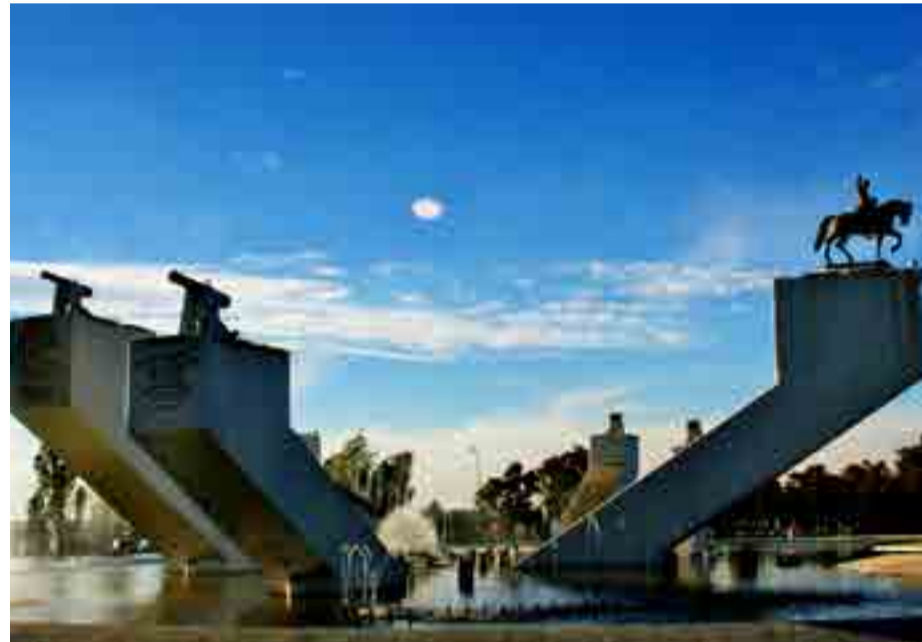
La creatividad está presente en las fuentes que rodean la Catedral.