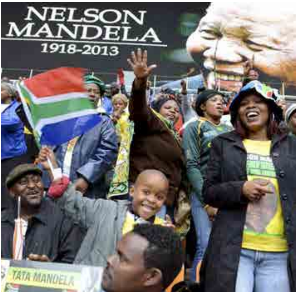
Siguiendo la costumbre, la gente común despidió con alegría al gran Nelson Mandela.