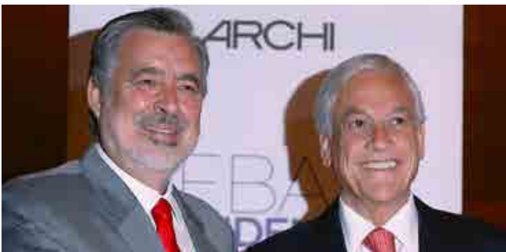
Los candidatos Alejandro Guillier y Sebastián Piñera.