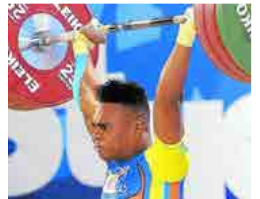
Actuación de peso