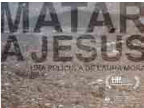
PL premia en Festival de cine