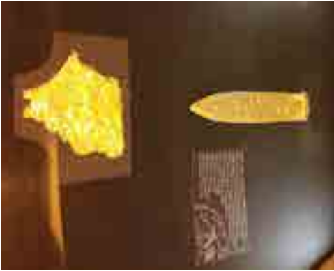
Tesoros de Tutankamón