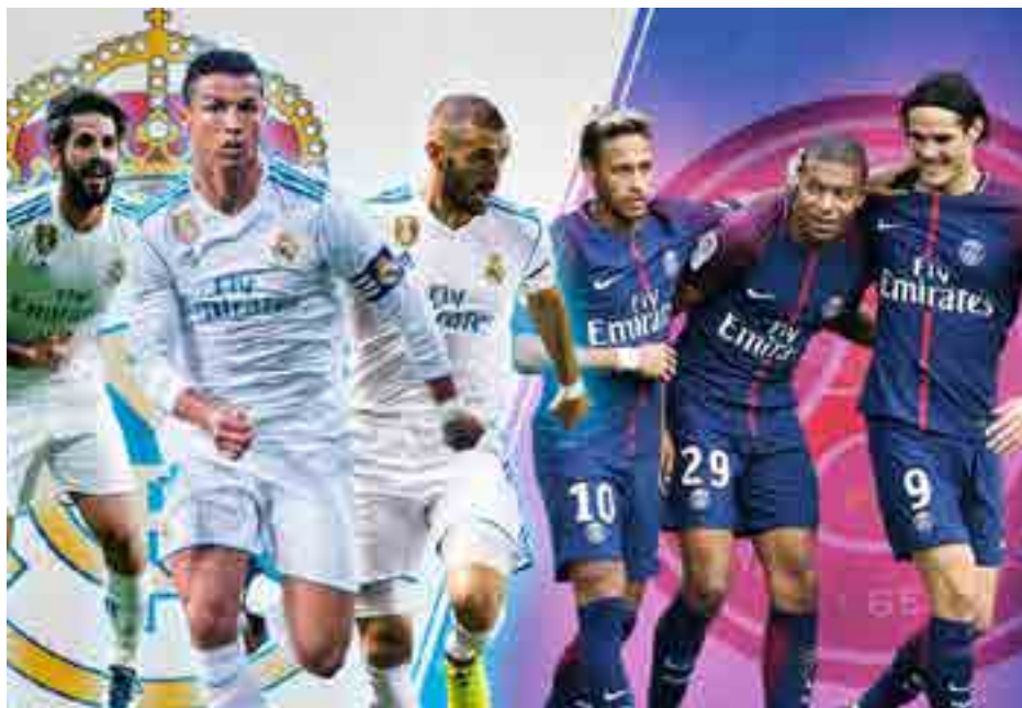
Cristiano portará el estandarte del Madrid ante el PSG

Los restantes enfrentamientos pondrán frente a frente a Tottenham-Juventus, Liverpool-Porto, Roma-Shakhtar Donetsk y Besiktas-Bayern de Múnich, otro de los habituales favoritos a la corona.