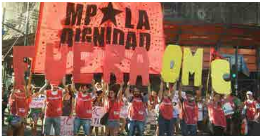
Se hizo sentir la voz de los pueblos en una anticumbre con fuerza en las calles.

En múltiples ocasiones se ha manifestado que el sistema mundial de comercio está en una encrucijada, sostuvo la