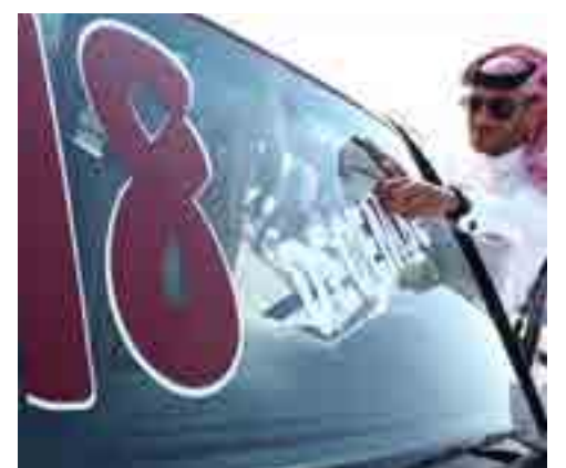
Qatar en su día