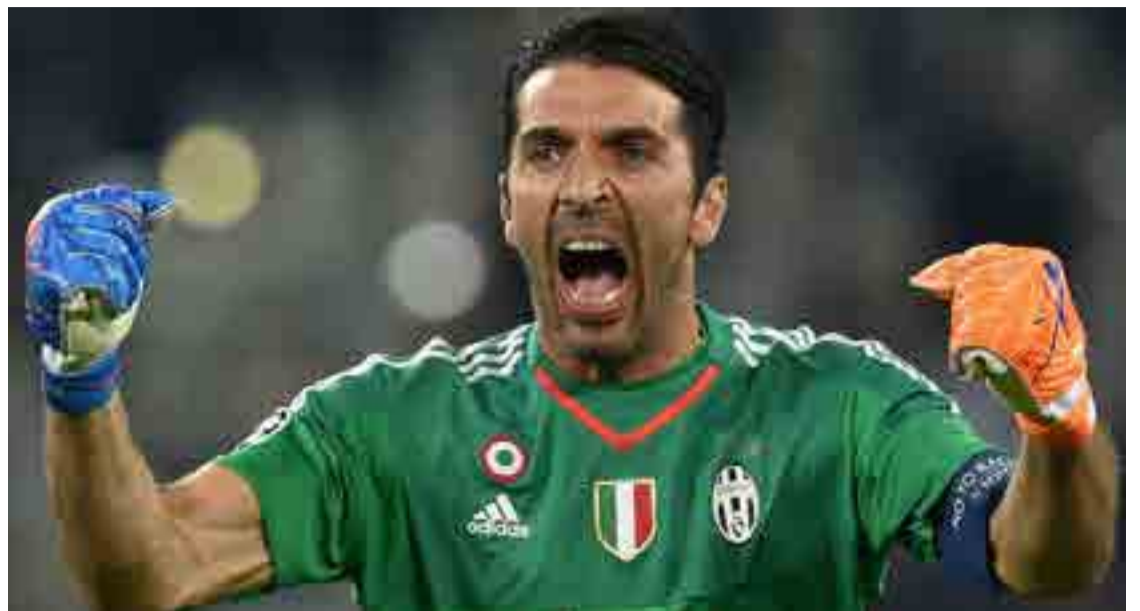
Buffon más cerca de su primer título en Liga de Campeones.

Ambos irán a Sochi con las expectativas de dar un buen espectáculo y seguir sumando rayitas para su cuenta particular, algo al parecer vedado para un multicampeón mundial, el español Fernando Alonso, quien vive en una eterna decepción con su McLaren-Honda.