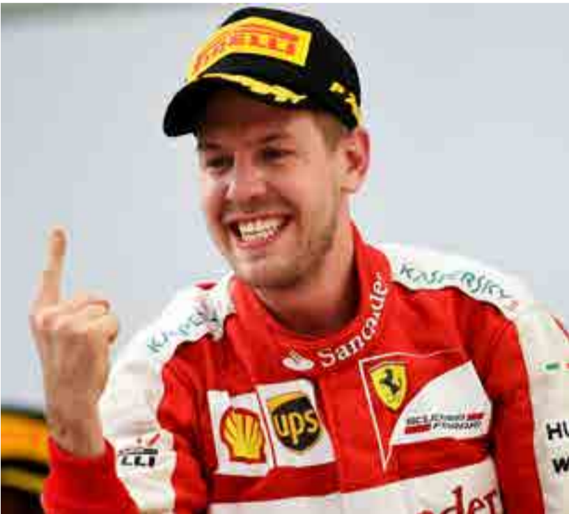
Vettel ya se lo cree, y Ferrari apunta al cetro.

Por Carlos Bandinez Machín deportes@prensa-latina.cu