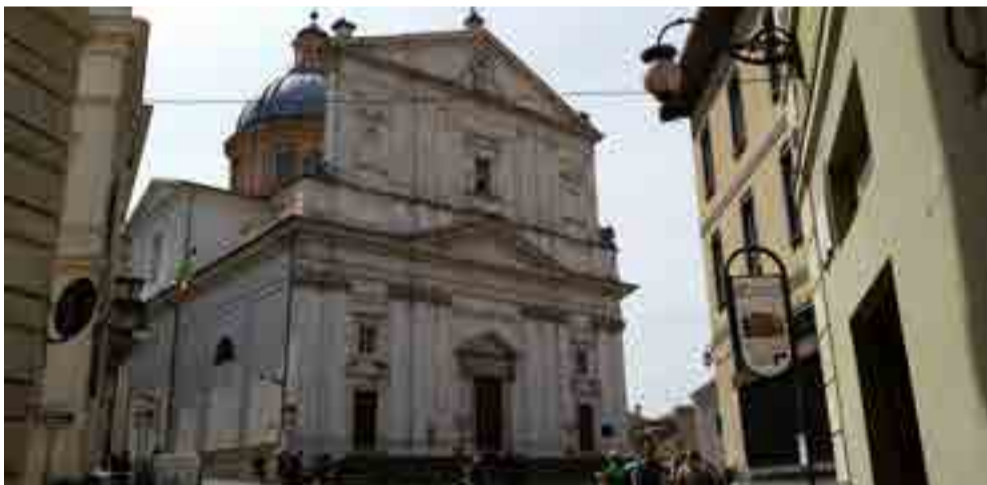
Unos sobre otros, se suceden edificios renacentistas, neoclásicos... y algunos modernos.