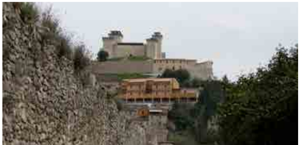
Viejas fortalezas medievales y restos de murallas, le confieren a la ciudad un aire distinguido.