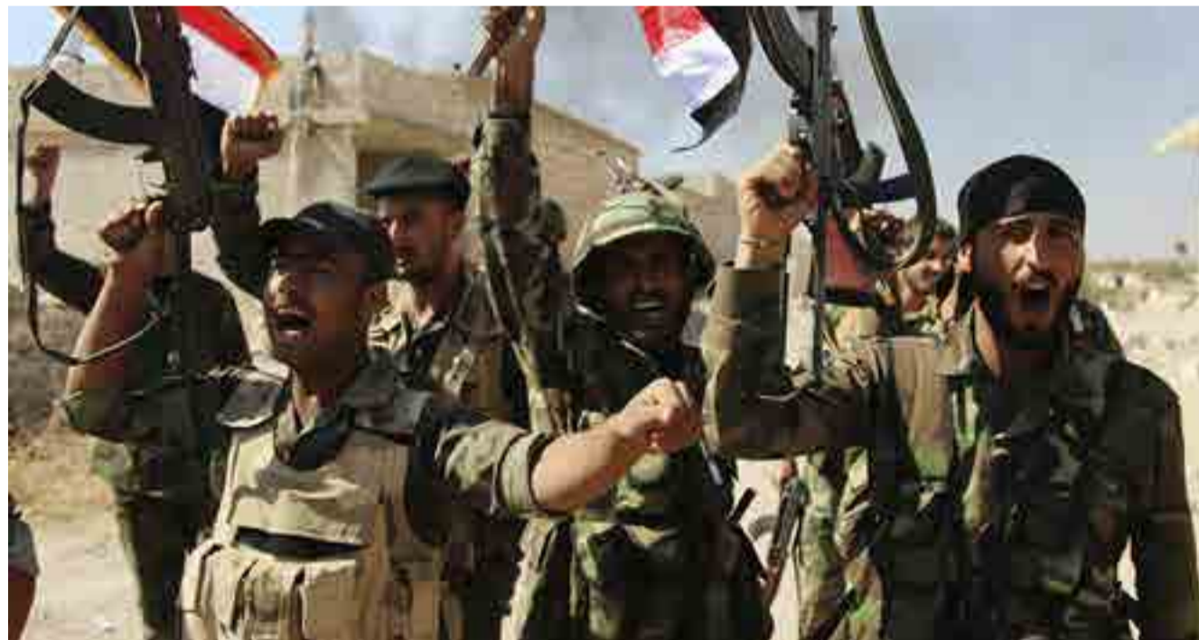
Desde fines de 2011, la guerra impuesta a Siria no ha podido quebrantar el espíritu de lucha de su pueblo.

A este panorama se unen las tropas tucas asentadas al norte de Aleppo, dentro del territorio sirio y la presencia de casi 3 000 militares de Estados Unidos que construyen al