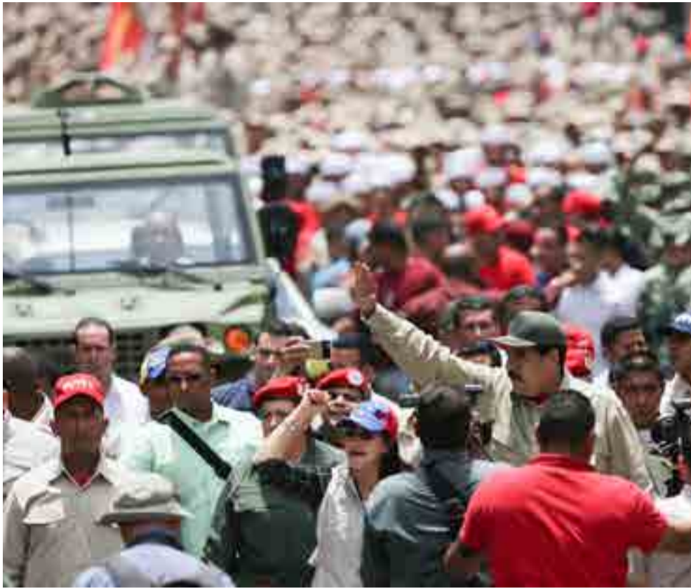
Una marea roja recorrió las calles de Caracas para rechazar las acciones violentas.

En ese sentido, recordó que en el sur de la Florida y en San Juan, Puerto Rico, viven tranquilos responsables de crímenes que han enlutado al país antillano.