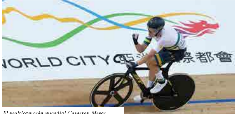
El mult campeón mundial Cameron Meyer.

tres títulos —todos en el sector varonil—, cinco medallas de plata y otras tres de bronce.