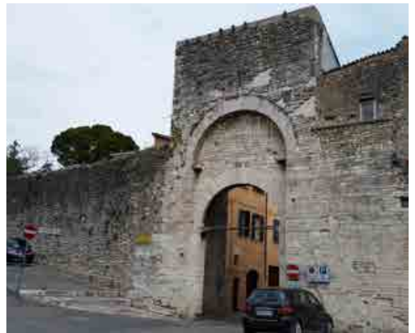
Estos muros han sido testigos de toda la historia de Spoleto.