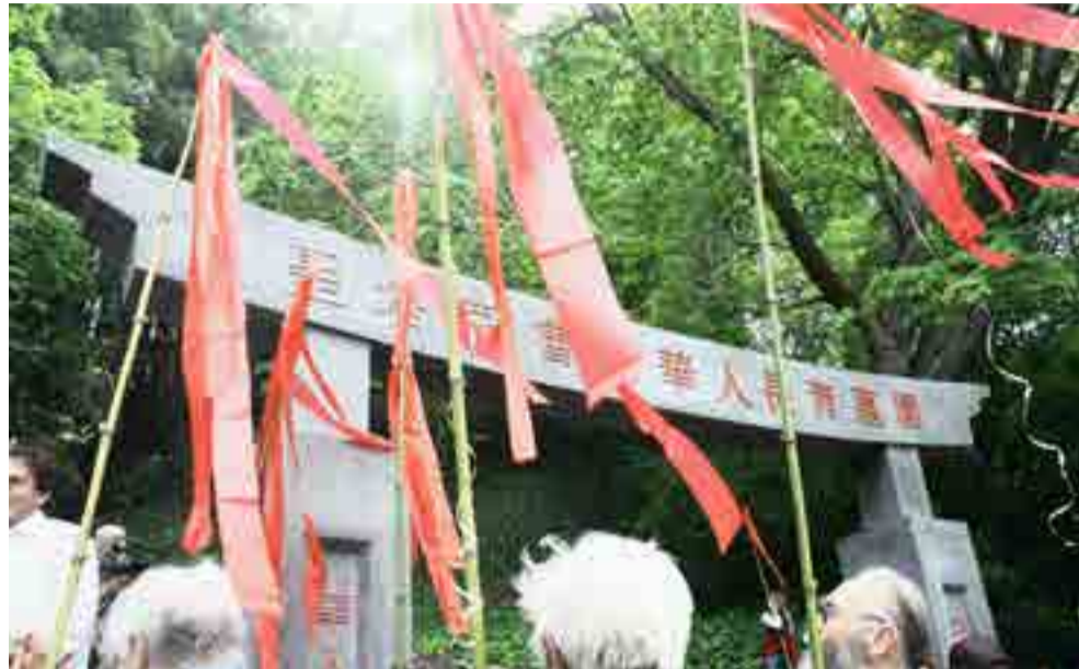
Muchos oran por sus ancestros, otros lloran frente a los nichos.

Durante el Festival, las personas barren las tumbas de sus familiares, amigos, padres o de otros que respetan o que tienen a su cuidado y también estimula otras prácticas