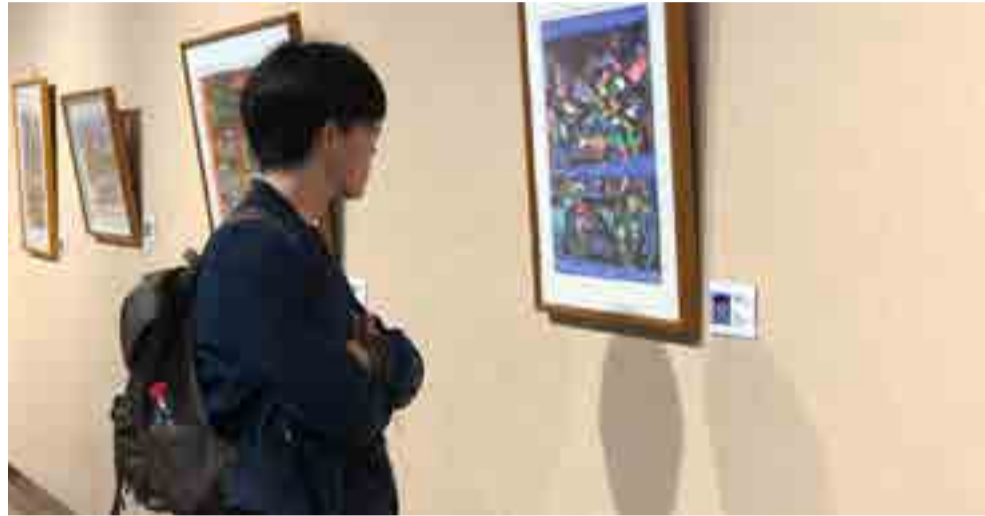
"Trazos y transparencias" interpreta el alma de la naturaleza ecuatoriana.

En declaraciones a Orbe , el creador manifestó que en sus obras intenta mostrar las esencias culturales del mundo andino y elementos característicos de la tradición ecuatoriana como la arquitectura hispánica y prehispánica.