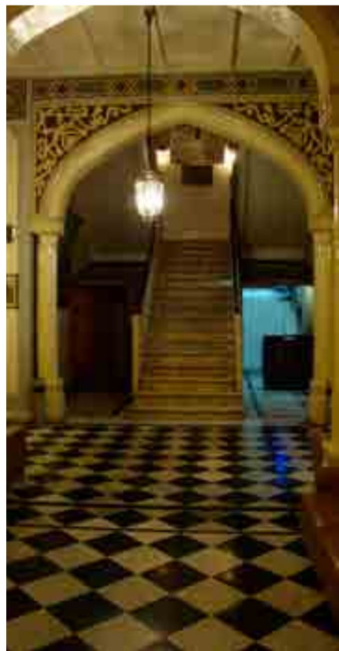
Por este recibidor desfilaron grandes personajes, como Charles de Gaulle y David Rockefeller.