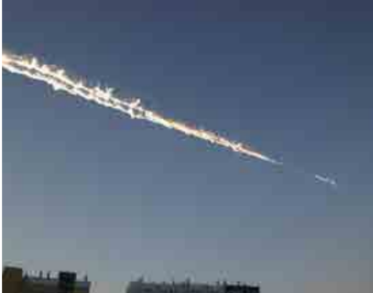
La enciclopedia recoge nuevas categorías como la estela, rastro de vapor de los aviones.

Por Ana Laura Arbesú cyt@prensa-latina.cu