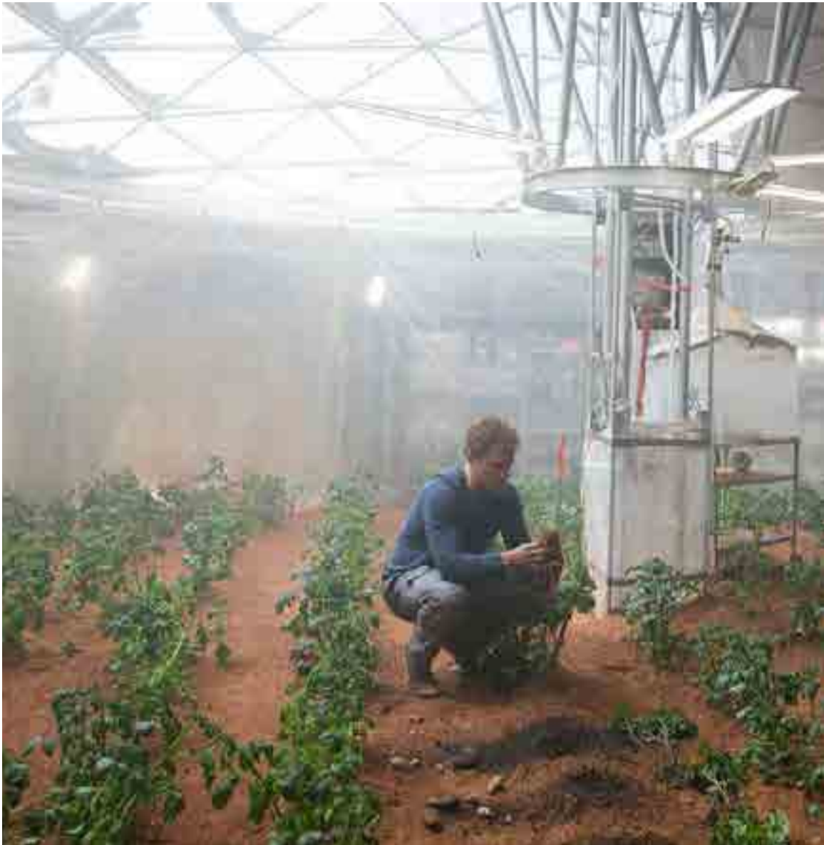
El actor estadounidense Matt Damon en la cinta The Martian siembra patatas para sobrevivir en el planeta rojo.