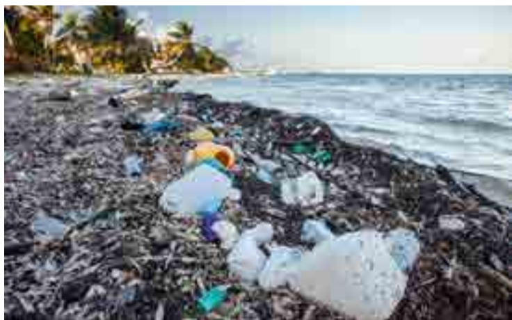
En el transcurso de 2017, #MaresLimpios anunciará medidas ambiciosas adoptadas por los países y las empresas.