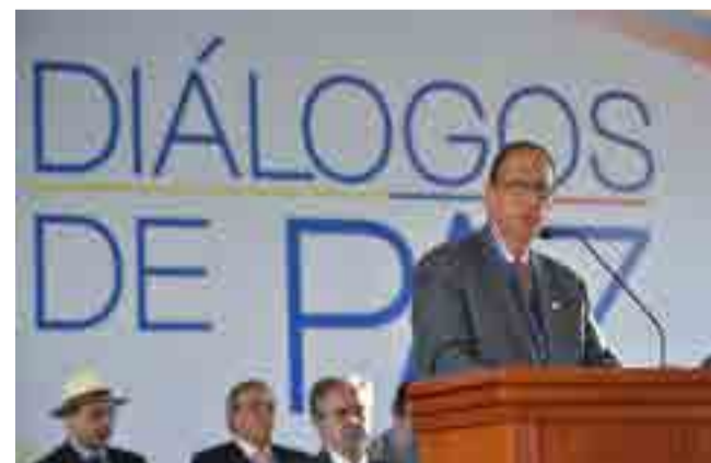
Queremos ir rápido pero no de manera atropellada, manifestó el vocero gubernamental.

Politólogos, defensores de derechos humanos y otras personalidades aseguran que el resurgimiento de dichas estructuras constituye una de las principales amenazas para la construcción de la paz en Colombia y la vida de sus defensores.