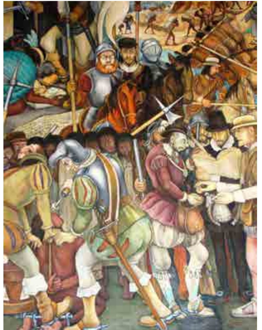
Todos los vicios humanos tuvieron representación en la grandiosa historia mexicana.

El último panel decorado por Rivera se encuentra en el corredor oriente y es conocido como "El desembarco de los españoles", donde plasmó la decadencia del mundo prehispánico después de la conquista.