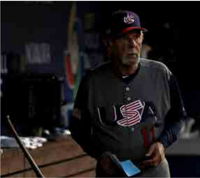
Leyland guió a Estados Unidos al trono del Clásico.

Por Héctor Miranda Enviado especial/ Los Ángeles