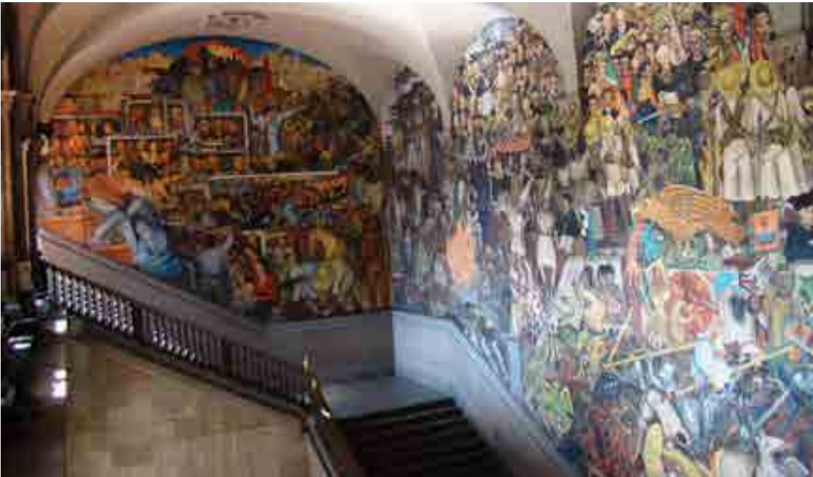
En su momento estas imágenes escandalizaron a muchos.