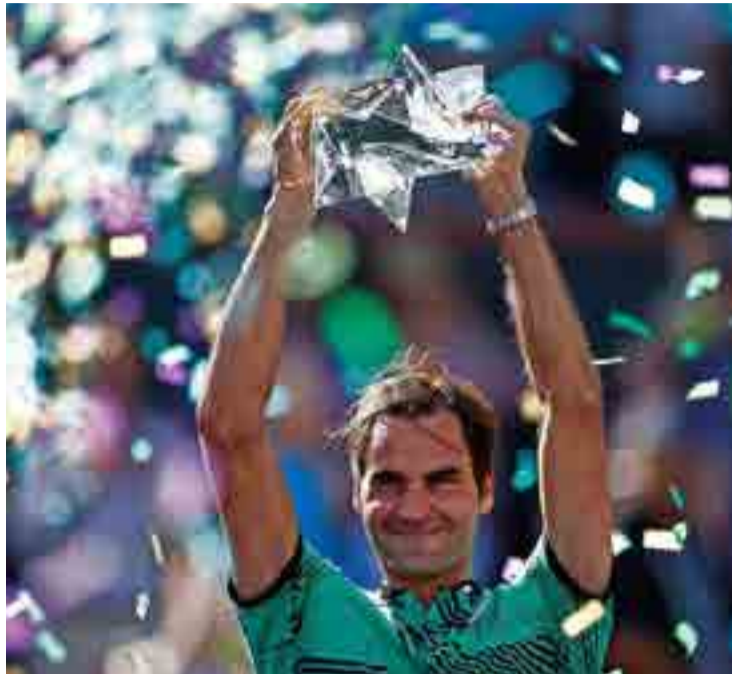
Federer alza su trofeo tras ganar en Indian Wells.

"Su majestad" arribó al desierto californiano para bajar de la competencia al francés Jo Wilfried Tsonga, al estadounidense Steve Johnson, nuevamente a Nadal, al australiano Nick Kirgios, al local Jack Sock y en el cierre a Wawrinka.