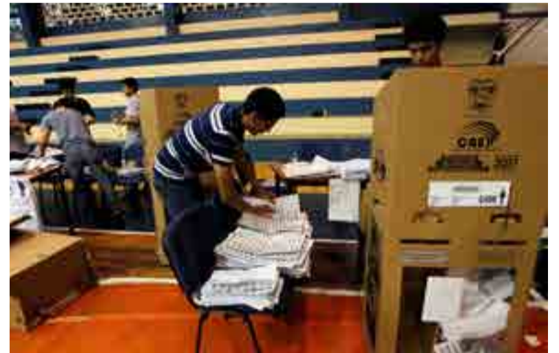
En los comicios del 2 de abril deberán sufragar 12 816 698 electores.