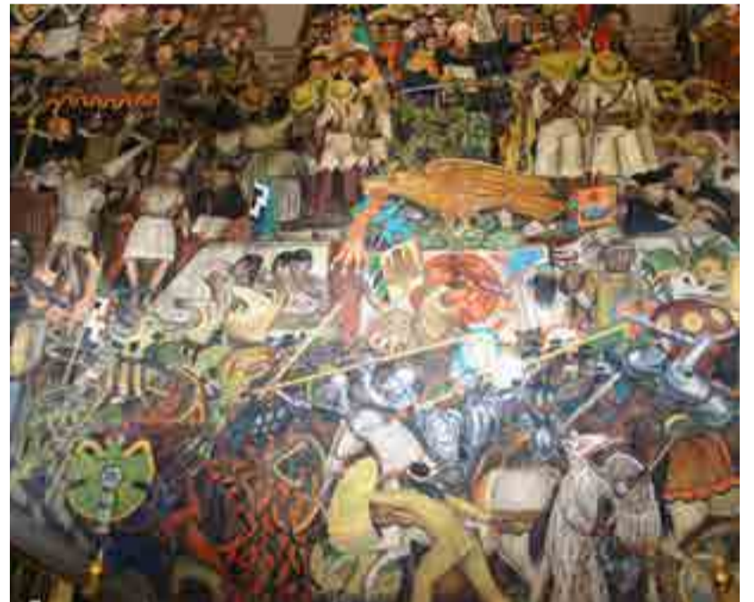
La épica social de Diego Rivera aparece en los murales en todo su esplendor.