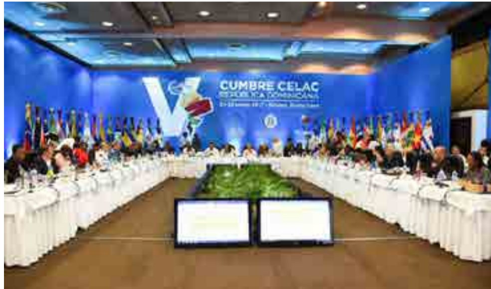
La más reciente Reunión de Coordinadores Nacionales de la Celac en El Salvador contribuirá a enfrentar los retos de la región.

A esto se suma, además, la reunión cumbre de la Comunidad del Caribe que tuvo lugar el 16 y 17 de febrero en Georgetown, Guyana, y marcó las posiciones de sus inte-