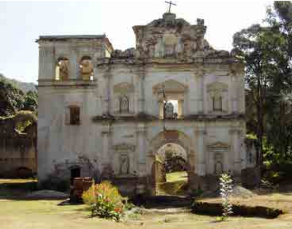
Las ruinas dejan ver vestigios de un antiguo esplendor.