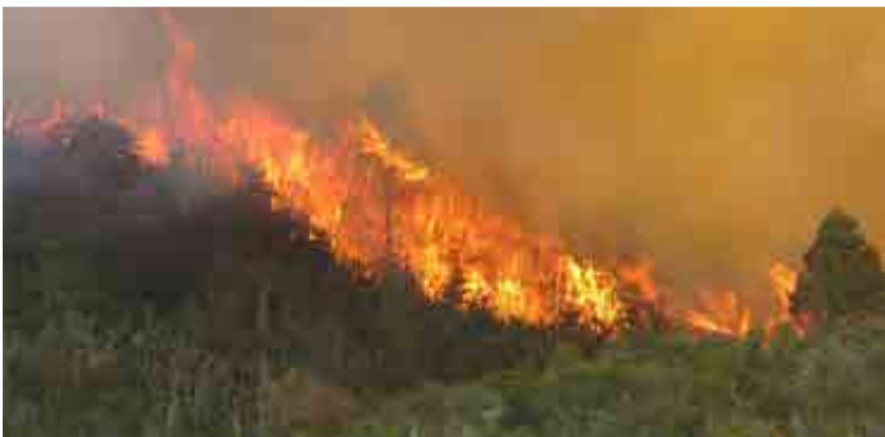
La acción de miles de personas no ha logrado detener el paso de las llamas.