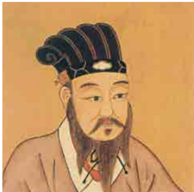
Desde la época de Confucio, occidente observa la sabiduría china como una colección de frases ingeniosas.

Por Damy Vales Corresponsal jefa/Beijing