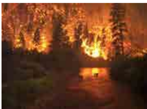
Agua y fuego asolan a Argentina y Chile