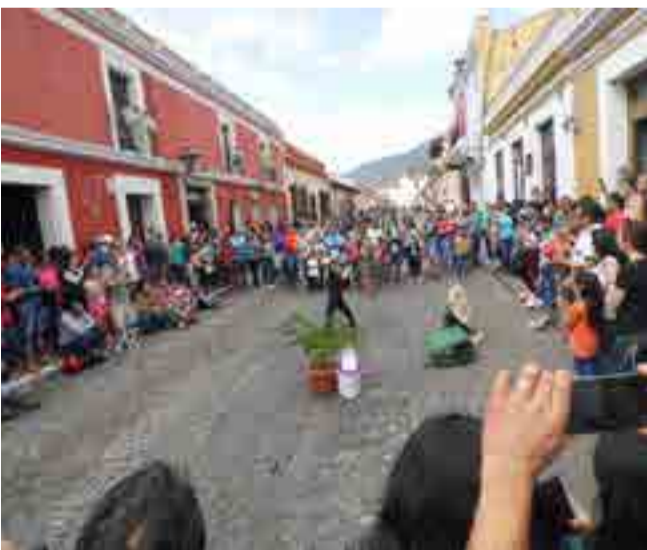
La población local y flotante hace que Antigua Guatemala parezca en movimiento a toda hora.