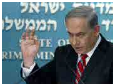
Netanyahu revive política del espacio vital