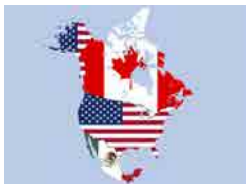
Tlcan pende de un plumazo