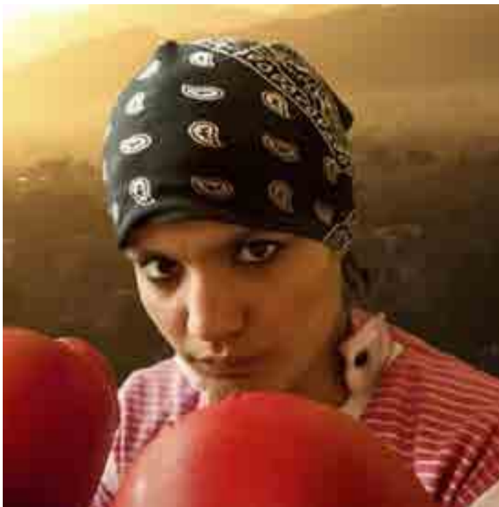
Las egipcias, además de bellas, saben golpear duro.

En la actualidad, la joven egipcia es fuerte, con una conducta más abierta y menos sumisa. La tolerancia le ha permitido practicar cualquier deporte y mostrar su igualdad con el hombre.