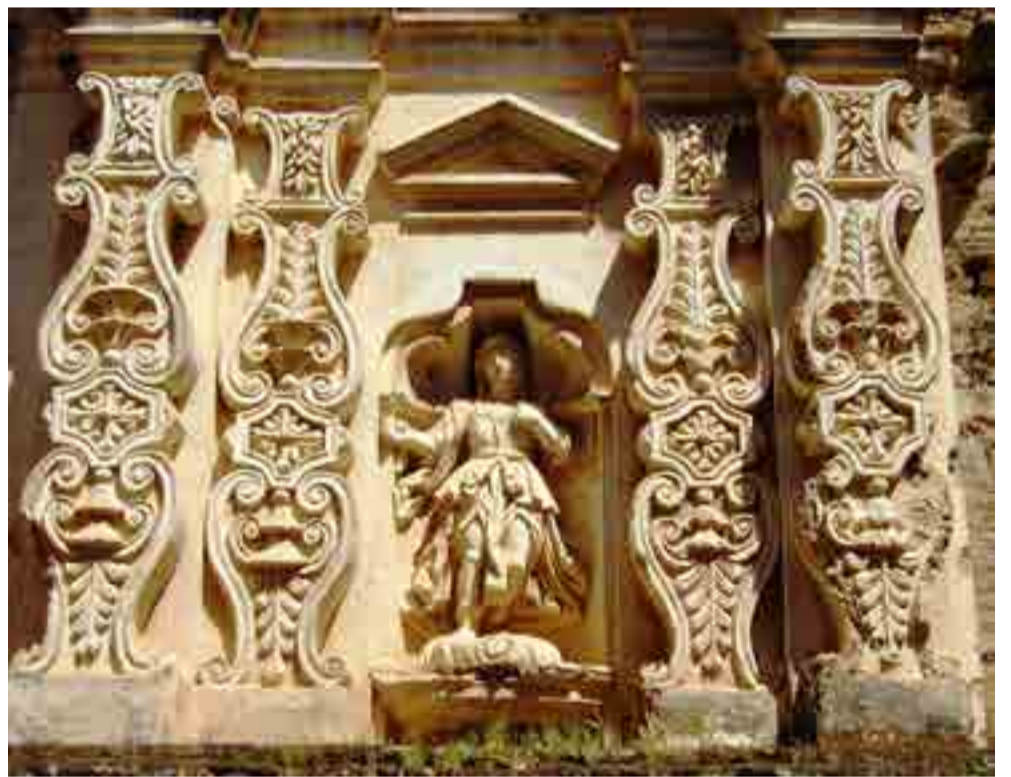
Las fachadas cargadas de adornos curvados manifiestan el gusto barroco de sus diseñadores.

La población local y flotante hace que Antigua Guatemala parezca en movimiento a toda hora, porque el enjambre de caminantes apenas se detiene, sin importar si hay frío o calor en el territorio situado a unos 1 470 metros sobre el nivel del mar.