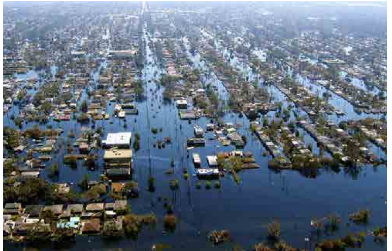
Zonas enteras están anegadas; en otras rugen los incendios.

El impacto ambiental que se produjo por los incendios será gravísimo y las pérdidas económicas también, el fuego fue incontrolable por el viento, las altas temperaturas, la baja humedad, la cantidad de pasto y la sequía, la gente de la zona dice que nunca vio algo así, informó a la prensa el Director General de Defensa Civil de La Pampa.