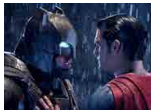
Esos premios de los que todos huyen