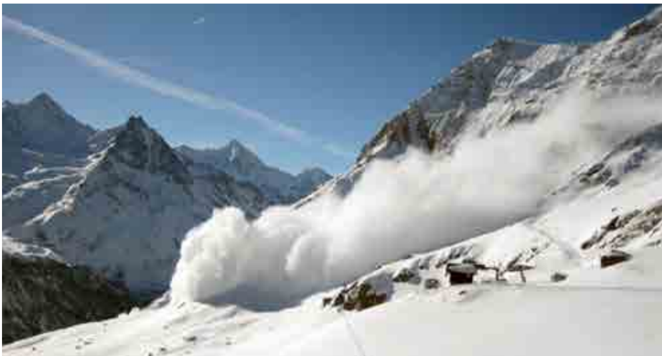
La enorme masa de nieve golpeó el hotel con fuerza brutal.

El equipo debió llegar a las 15:00 hora local pero, por alguna razón aún desconocida, su arribo fue pospuesto para las 19:00 y mientras todos aguardaban impacientes dentro