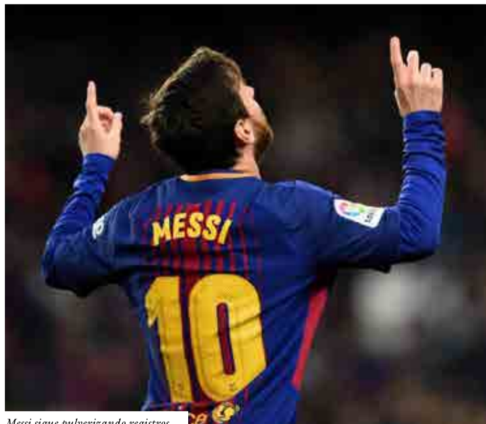
Messi sigue pulverizando registros.

Por supuesto, no quiero ni imaginar que dirán esos escépticos arrogantes si por alguna casualidad llegara a alzar el cetro en el Mundial de Rusia-2018. ¿Solo a partir de ese justo momento sería mejor que Maradona y Pelé? ¿En serio?