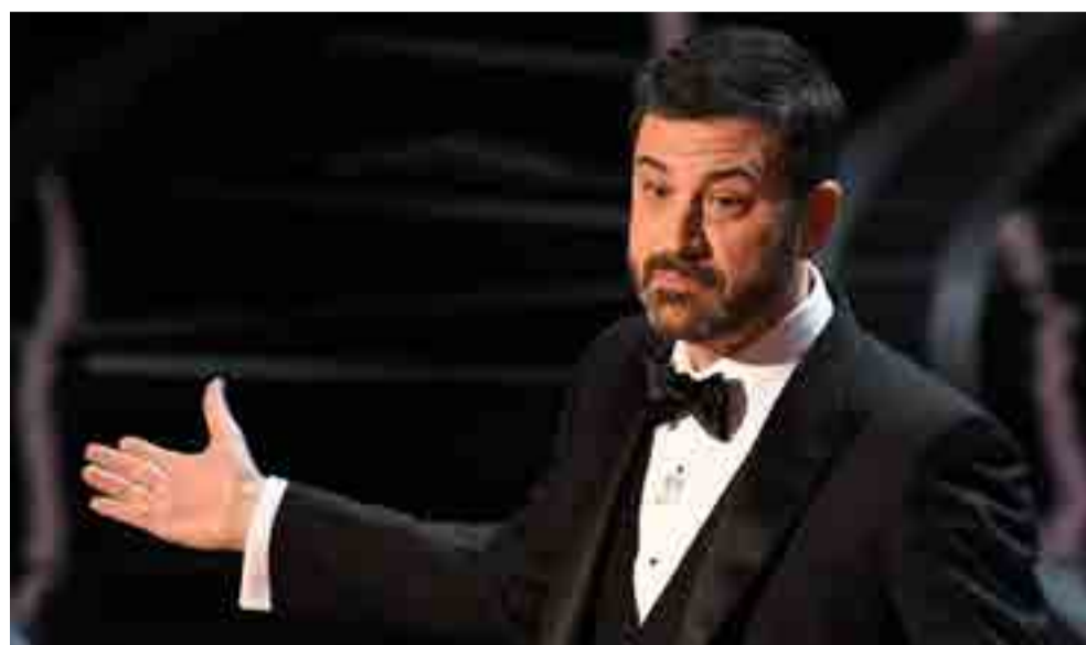
Jimmy Kimmel volverá a ser el anfitrión de la gala.

Desde su Olimpo, Hollywood ya está habituado a desentonar, incluso en las decisiones "políticamente correctas" va la marca de un conservadurismo que intenta mantenerse a flote y que expone, en cambio, las fisuras de la industria cinematográfica estadounidense.