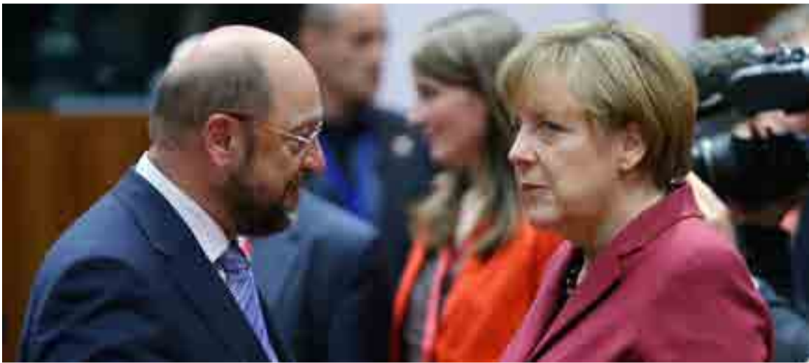
Martin Schulz, presidente del Partido Social Demócrata, y la canciller alemana Angela Merkel.