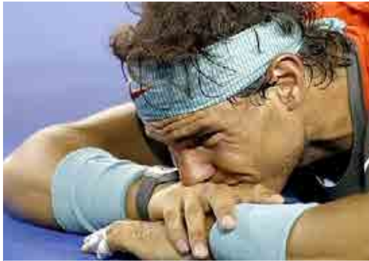
Nadal atiza a la ATP por continuas lesiones de tenistas.

De acuerdo con el canadiense, el circuito masculino es extremadamente exigente y largo, con partidos que alcanzan hasta los cinco