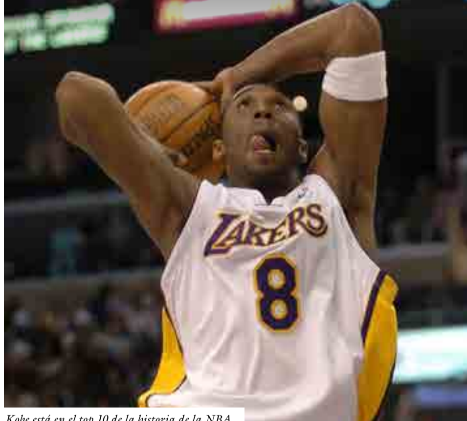
Kobe está en el top 10 de la historia de la NBA.

Por Raúl del Pino Salfrán deportes@prensa-latina.cu