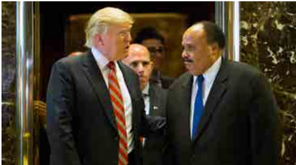
El presidente norteamericano recibió duras críticas de Martin Luther King III.

Aunque la Casa Blanca ha tratado de desmentir el hecho y el propio gobernante tildó los reportes de prensa de "inexactos", el senador por Illinois, Dick Durbin, único demócrata en la reunión, confirmó que Trump usó un lenguaje "lleno de odio, vil y racista" para describir a los inmigrantes de países pobres.