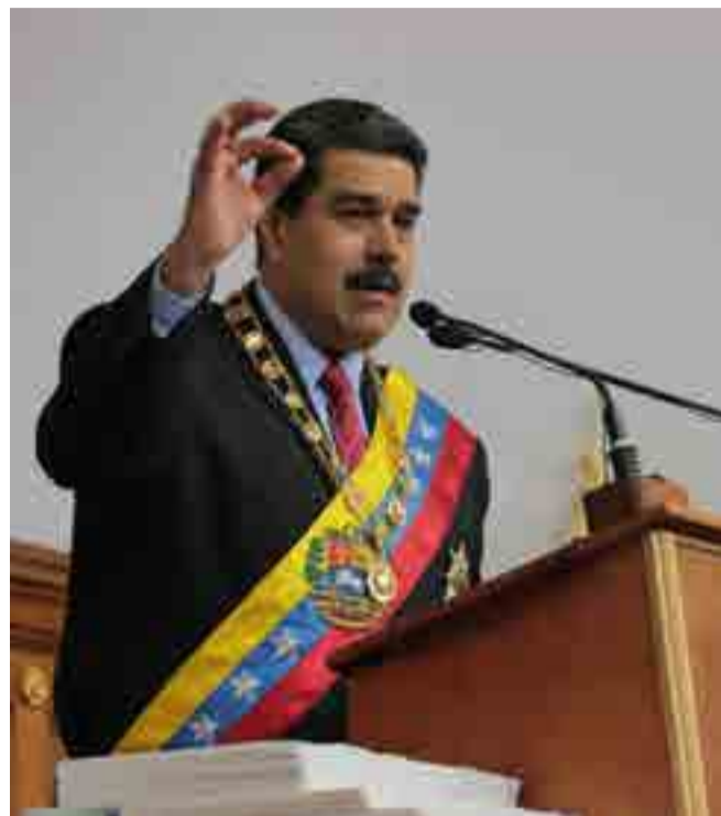
Por William Urquijo Pascual Corresponsal/Caracas