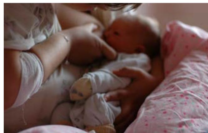
Entre las causas de las diferencias señalan la educación de la madre y su poder adquisitivo, así como el origen étnico y racial.

Para ello, la Unicef impulsa la campaña Cada vida cuenta, en aras de exigir y brindar soluciones, además de hacer un llamado urgente a los gobiernos, proveedores de servicios de salud, donantes, sector privado, familias y empresas a mantener la supervivencia de los bebés. "La gran mayoría de las muertes maternas en América Latina y el Caribe pueden prevenirse con una atención médica de calidad durante el embarazo, el parto y el puerperio", expresó Perceval. Por