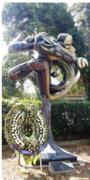
Su obra Prometeo , destaca la tumba de Alfaro Siqueiros.

Alemania e Italia (en esta última está el mausoleo de Tina Modotti). Desde 1876 existe la Rotonda de las Personas Ilustres, un círculo de tumbas acompañado de una gran bandera patria donde reposan los restos de más de un centenar de