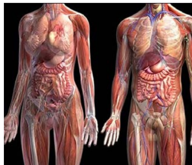
Los compartimentos interconectados y llenos de líquido, pueden amortiguar posibles desgarres.

Dicha función auxiliadora cuenta con el apoyo de una red de proteínas de tejido conectivo fuertes (colágeno) y flexibles (elastina). Para los investigadores el hallazgo explicaría la alta expansión del cáncer en esta parte del cuerpo, pues es una capa formada por una carretera de fluido en movimiento. Por otra parte, los académicos constataron que las células de ese espacio y los haces de colágeno que recubren cambian con la edad y pueden contribuir a las arrugas de la piel, la rigidez de las extremidades y la progresión de enfermedades escleróticas e inflamatorias. Además, los autores destacaron que su estudio es el primero en definir el intersticio como un órgano en sí mismo y uno de los más grandes del cuerpo. Ello se logró con una novedosa tecnología denominada endomicroscopía confocal láser, basada en sondas, que ofrece una vista microscópica de los tejidos vivos. (PL)