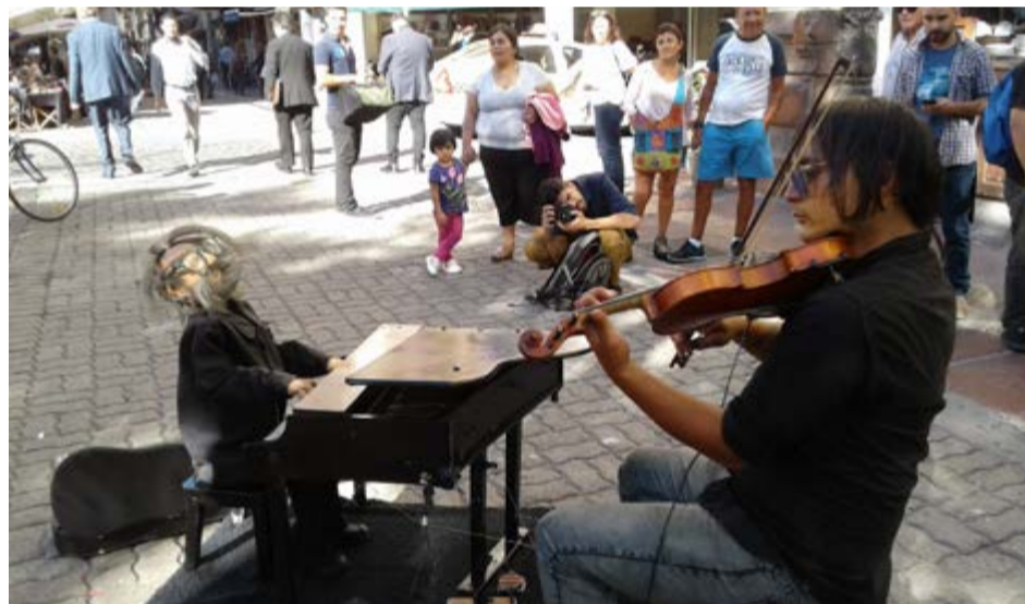
Un violinista clásico y una marioneta pianista, operada a pedal por el primero motivaron la atención en una calle principal de Montevideo.