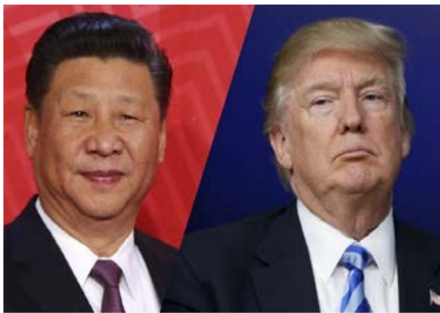
Trump cree, que las guerras comerciales son fáciles de ganar, en tanto Xi dice que no habrá vencedores en la economía global.