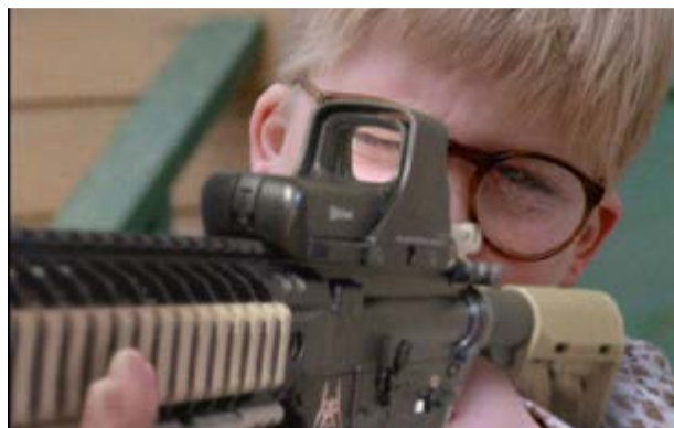
El fusil de asalto AR-15 se puede encontrar a partir de 500 dólares, tanto en armerías como en internet.

Por Martha Andrés Román Corresponsal/Washington