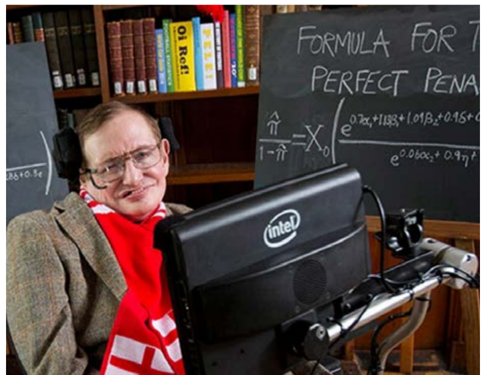
Una de sus investigaciones aborda estadísticamente las formas más efectivas de realizar un tiro de penal y la denominó "teoría del penalti perfecto".