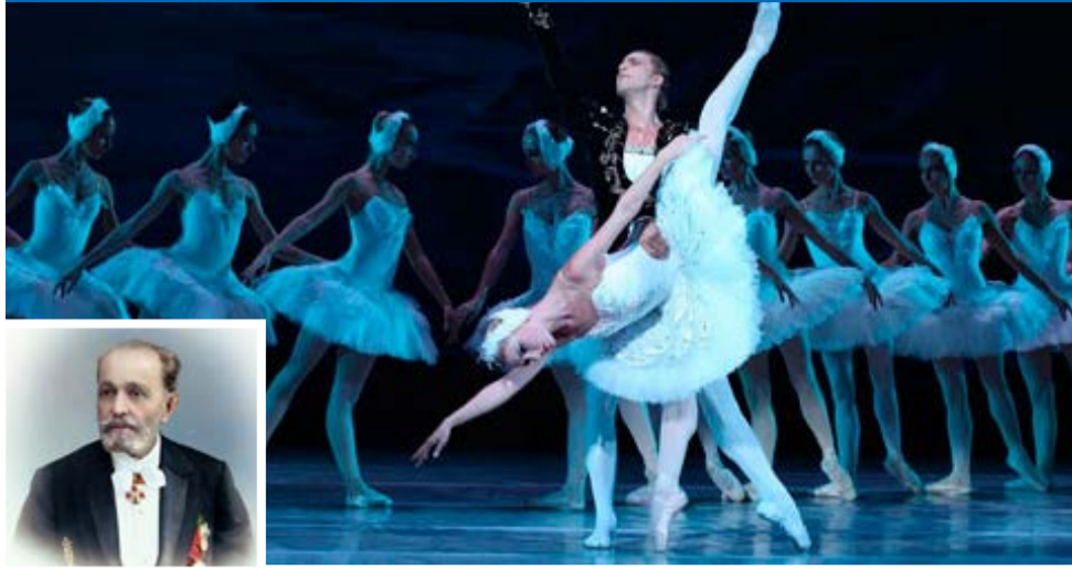
El lago de los cisnes (foto), abucheado en el Bolshói de Moscú en 1877, fue "rehecho" por Petipa e Ivanov y convertido en el ballet más demandado en los cinco continentes hasta la actualidad.