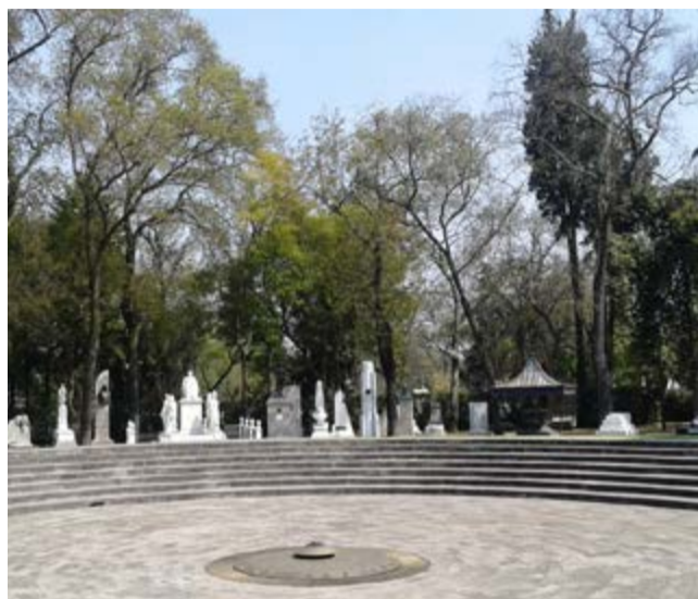
La Rotonda tiene 23 demarcaciones exclusivas, entre ellas la de los Constituyentes de 1917 y la de las Águilas Caídas del Escuadrón 201.

Por Orlando Oramas León Corresponsal/Ciudad de México