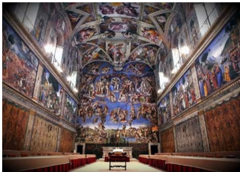
La Capilla Sixtina es el atractivo más importante del lugar.

800 piezas distribuidas en 55 salas con lo más representativo del movimiento artístico del siglo XX, obras donadas por coleccionistas o por los propios artistas. La escalera helicoidal, diseñada por el arquitecto italiano Giuseppe Momo entre 1929 y 1932 a instancia del papa Pío XI, constituye uno de los grandes tesoros arquitectónicos, por donde el visitante desciende al final del recorrido de una visita inigualable.