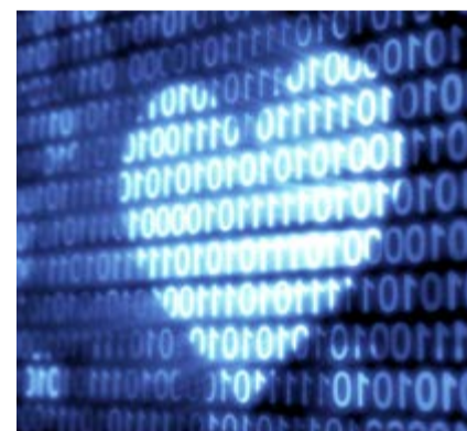
La plataforma WAVE anticipa patrones no reconocibles para el ojo humano.

Según un estudio de la Universidad Johns Hopkins, el 10 por ciento de todas las muertes ocurridas en los Estados Unidos se debe a errores médicos. Y estos decesos inesperados que ocurren en los hospitales, muchas veces debido a la incapacidad del personal de salud para detectar, comunicar y actuar ante signos de deterioro clínico. Los creadores de la plataforma WAVE creen que muchos de esos fallecimientos podrían evitarse. El sistema utiliza el monitoreo ya existente en la mayoría de los hospitales. Por ende, se puede augurar que estamos próximos a adelantarnos al final de la existencia.