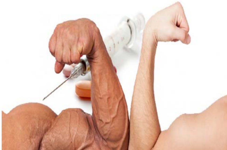
La obsesión por los esteroides es un mal que a diario se expande entre quienes desean romper récords o simplemente tener un cuerpo más atlético con menos tiempo de gimnasio.

Pero la lista de dopados es mucho más extensa. Los esteroides profanan el deporte desde hace décadas y, como consecuencia destruyen la carrera de muchos deportistas, salpicados por acusaciones o uso de sustancias prohibidas para mejorar su rendimiento. Pero el consumo de esteroides no es solo un burdo intento de hacer trampa para ganar dinero, conseguir el éxito o inflar estadísticas. Un ejemplo nocivo de esta práctica fue lo que sucedió con la venezolana Fannie Barrios, quien se convirtió en campeona nacional de fisiculturismo en 1997 y 1998; y conquistó los torneos del 2001 y 2002. Estos logros, sin embargo, no los pudo disfrutar por mucho tiempo, producto de un derrame cerebral a los 41 años cuando aún parecía estar en forma deportiva. Situaciones similares ocurrieron con Florence Griffith Joyner, la plusmarquista mundial de la velocidad pura y Kimbo Slice, luchador urbano de artes marciales mixtas.