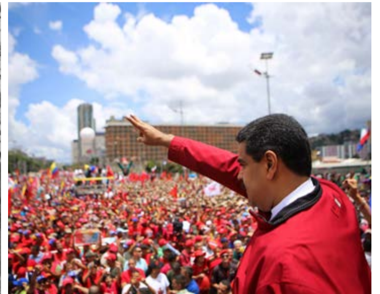
Ayer Cuba (1961), hoy Venezuela, el enemigo es el mismo y el desafío se mantiene: vencer para que prevalezcan la dignidad y la soberanía de los pueblos de América Latina.

junto con sus cómplices y vasallos, ya dibuja los escenarios para lo que, con un cinismo mayúsculo, llaman el día después de la caída de Nicolás Maduro.