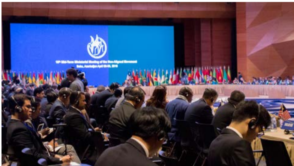
Las agresiones a Palestina, Venezuela y Cuba por Estados Unidos o lacayos con su apoyo fueron, entre otras, condenadas por la conferencia ministerial del Mnoal en Bakú.

La erradicación del hambre, la pobreza y la exclusión social continúan como un