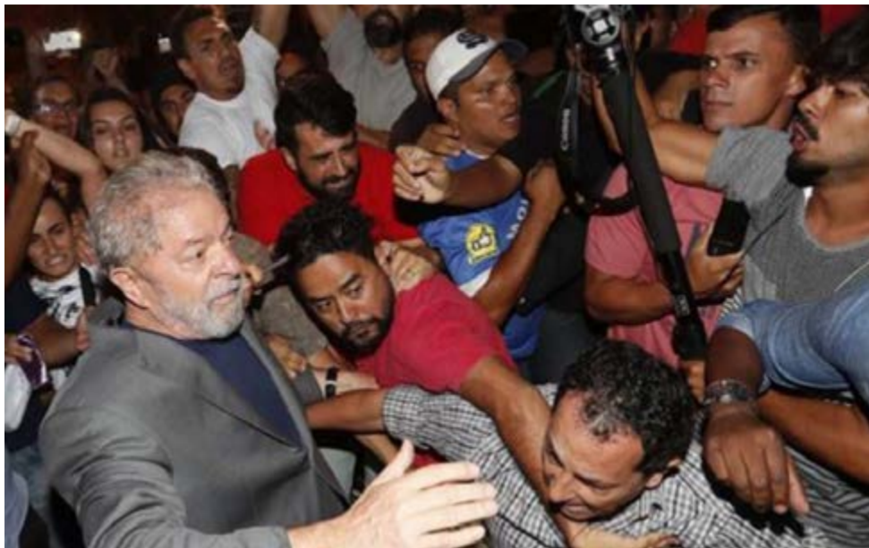
Atravesando una multitud que lo protegía en el sindicato metalúrgico, Lula se dirige al vehículo de la policía federal.

Por Moisés Pérez Mok Corresponsal/Brasilia