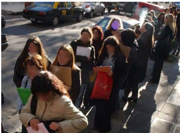
Según el estudio de la OIT, la participación femenina en el mercado laboral es 26,5 puntos porcentuales más baja que la de los hombres.

Desde la perspectiva de género, también prevalecen notables diferencias en cuanto a la participación en el mercado laboral: en 2018 la tasa mundial de participación femenina es del 48,5 por ciento; es decir, 26,5 puntos porcentuales más baja que la de los hombres, indicó el estudio. A juicio de la OIT, este fenómeno predomina en África del norte, Asia meridional y los estados árabes, y “no se prevén cambios en el futuro cercano, sobre todo a juzgar por el nivel sumamente bajo de las tasas de