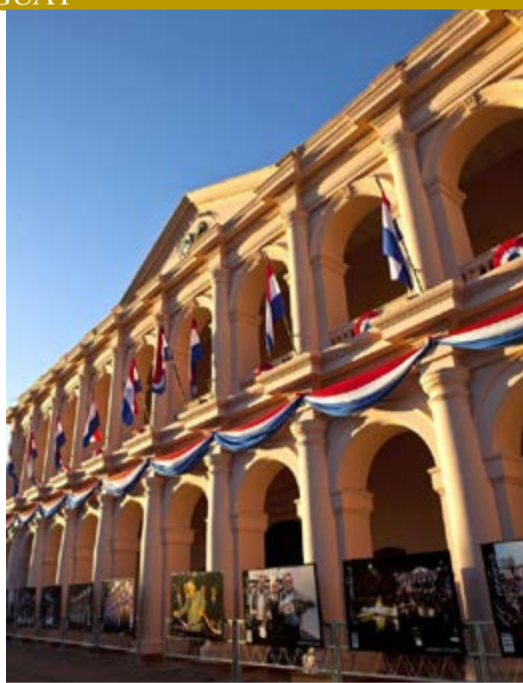
Edificio cuyo zócalo es garantizar el "acceso a los productos de la cultura," definió Roa Bastos.

Originalmente fue construido hacia 1844 para asiento de los poderes Ejecutivo y Legislativo, pero el primero fue trasladado en noviembre de 1894 y quedó solo para el segundo. Ya como recinto cultural fue inaugurado el 14 de mayo de 2004 por iniciativa de Carlo Mateo Balmelli, entonces presidente del Congreso Nacional, con el apoyo de todos sus miembros, y la Cámara de Senadores que albergaba la trasladaron a la nueva sede erigida específicamente para el Palacio Legislativo. En la interrogante de cómo contribuir al proceso de democratización de las producciones culturales del país, se concibió su creación como un espacio dinámico en el cual