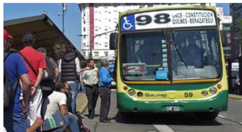
El boleto mínimo de un colectivo (buses), pasó de ocho a nueve pesos (0,45 centavos de dólar) en tanto los trenes también cuestan un poco más.

Abril llegó, además, con otros aumentos en servicios como el gas (natural y garrafa), el combustible y los peajes. En marzo, los porteños ya habían sufrido el impacto en el