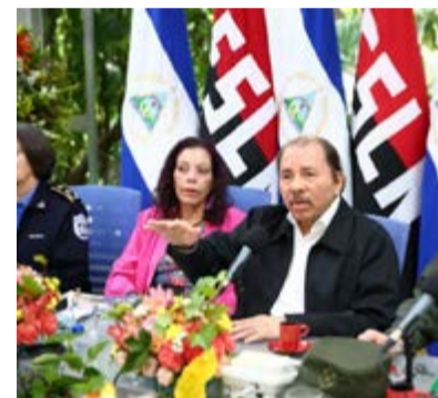
El presidente Daniel Ortega aboga por construir la paz.

Los miembros de la CIDH recabarán así información sobre los sucesos violentos acaecidos desde hace un mes, con un saldo de muertos, heridos y daños económicos aún por precisar.