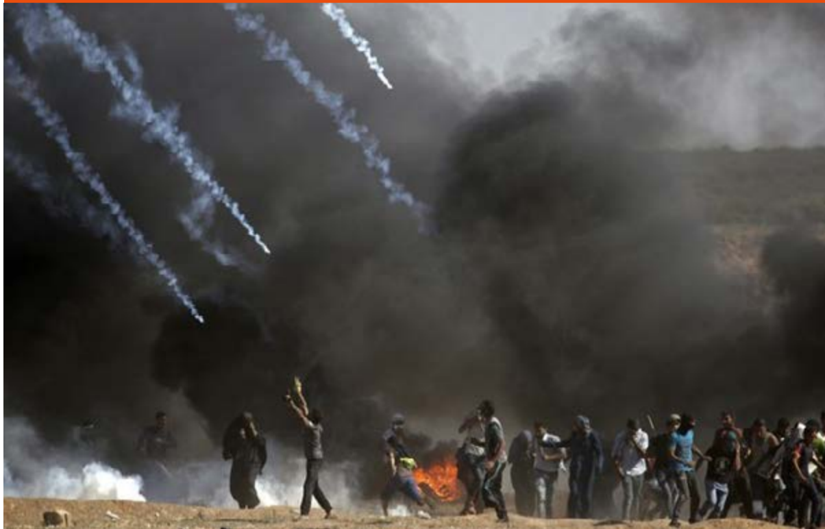
Ejército israelí siembra muerte y terror en tierras palestinas.