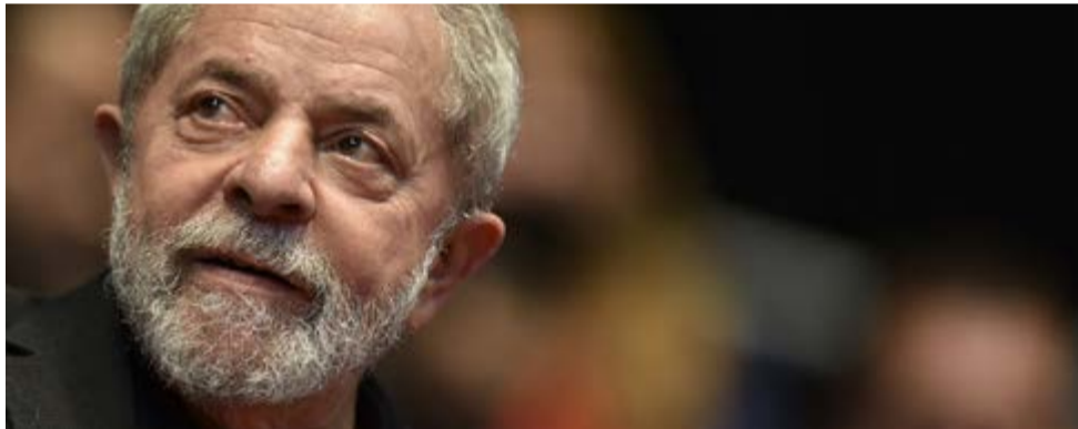
Lula continúa resuelto a enfrentar la persecución jurídico-mediática.

Señalaron, además, que la acción en razón de la cual fue proferida esa decisión