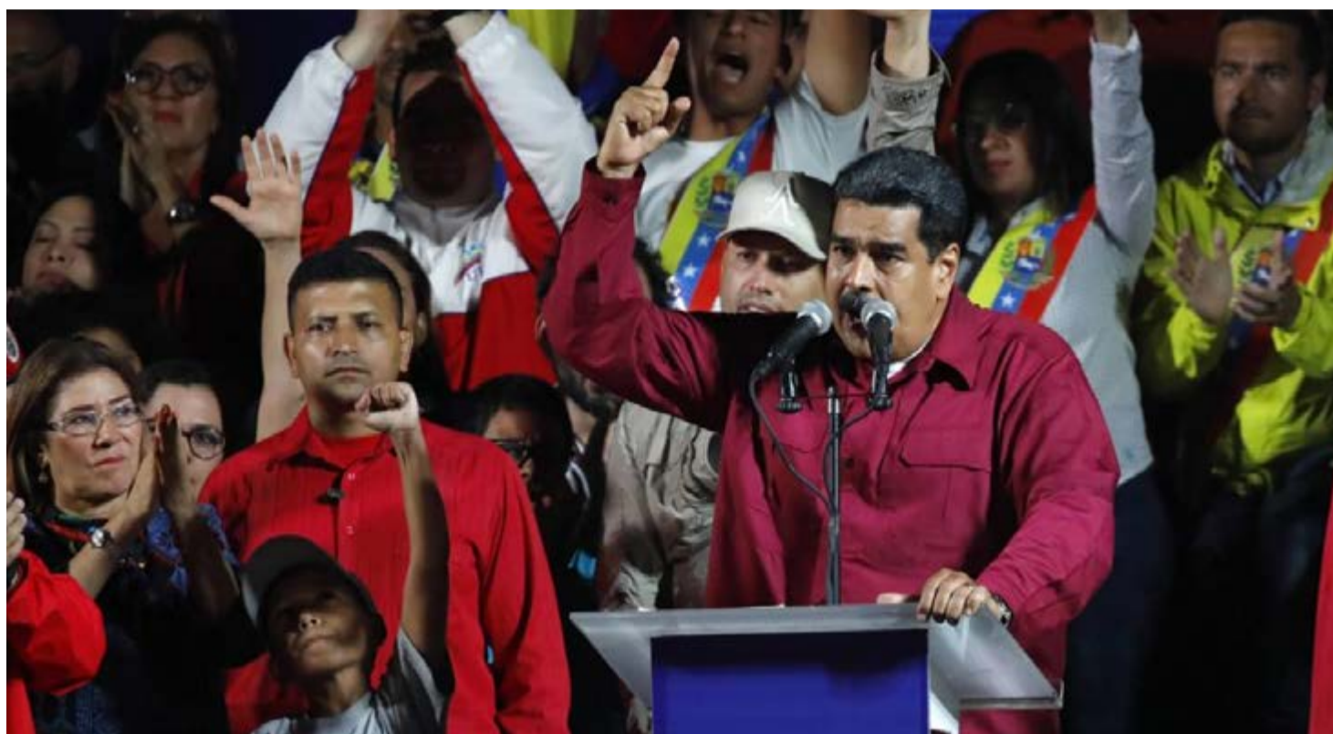
Diálogo para lograr la recuperación económica y derrotar la agresión externa, propuso el presidente Maduro tras la victoria.

Durante la campaña, Maduro reiteró su disposición a potenciar el diálogo político en búsqueda de la reconciliación nacional, un gran acuerdo económico y la recupera-