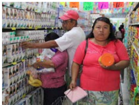
El salario resulta insuficiente para adquirir la canasta básica.

El salario mínimo se establece por la Comisión Nacional de los Salarios Mínimos (Conasami), presidida desde 1991 por