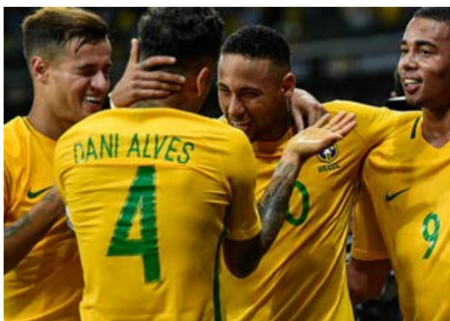
Neymar será el líder de Brasil en la Copa del Mundo.

Por Moisés Pérez Mok Corresponsal/Brasil