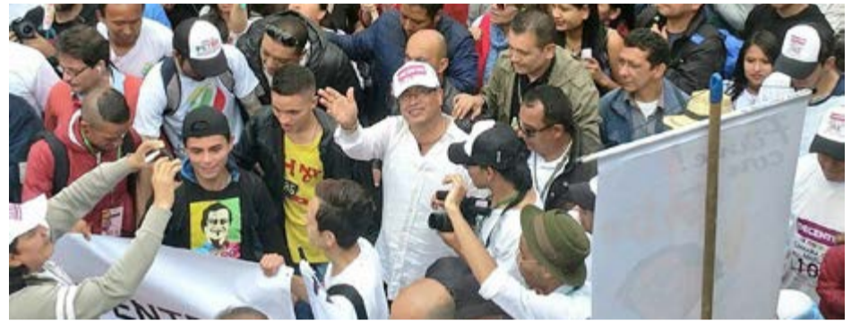
Las multitudes que atrae Petro en las plazas públicas preocupan al establishment.

Esta nueva resolución judicial deja todavía más evidente que el expresidente es víctima del lawfare , una práctica consistente en el mal uso y en el abuso en la aplicación de las leyes y de los procedimientos jurídicos para fines de persecución política.