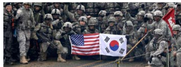
Tras el encuentro entre los mandatarios coreanos, Washington y Seúl iniciaron ejercicios militares.

Desnuclearizarse “a lo estadounidense” no es una opción que se visualiza ni en el lejano horizonte del norte de la península coreana.