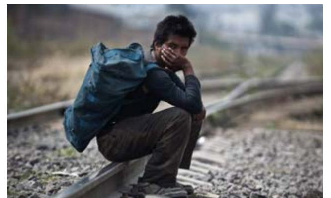
Unidos que puso esa fecha como plazo para poder debatir el convenio trilateral. (PL)

Ello debe ocurrir antes del 17 de mayo, para que pueda conseguir la vía del 'fast track' en el Congreso de Estados