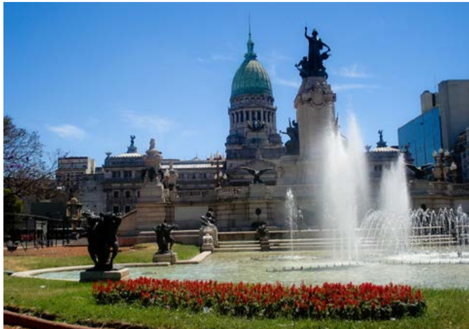
Los porteños hacen propuestas para construir juntos una mejor ciudad.

Hasta el próximo 30 de mayo se puede votar por aquellas que más les interesen y hay algunas realmente sorprendentes como la sugerida por un usuario llamada