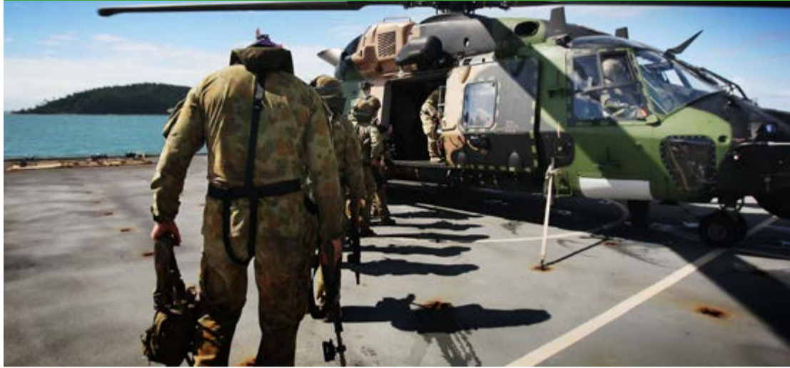
Bajo el disfraz de "ayuda", Estados Unidos extiende su área de influencia militar en América Latina.