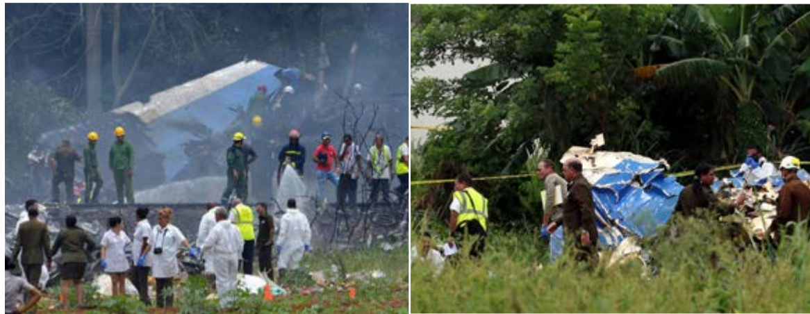
Junto al equipo cubano, trabajan dos expertos mexicanos, país al que pertenece la compañía Damojh.

Las investigaciones para esclarecer las causas del desastre aéreo ocurrido en La Habana y el proceso de identificación de las víctimas fatales continúan a cargo de expertos cubanos.