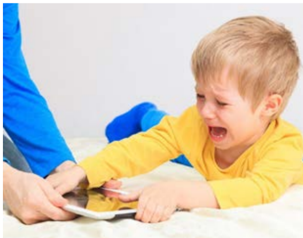
La Organización Mundial de la Salud reconoció la adicción a los videojuegos como un problema mental.

De tal suerte, identifican los especialistas tres temas que son sustanciales a la hora de definir si una persona es adicta a los videojuegos. Una de ellas es la falta de control sobre el juego (frecuencia, intensidad, duración):