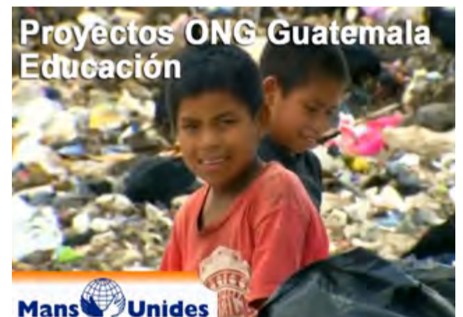
Las ONG se multiplicaron en las últimas dos décadas.

Aunque también es verdad que los procesos de urbanización/oenegización post Acuerdos de Paz no alcanzaron ni desmovilizaron a todos los territorios indígenas y campesinos del país. Existen fuerzas sociales emergentes que se mueven con agendas propias, más allá del marco de los Acuerdos.