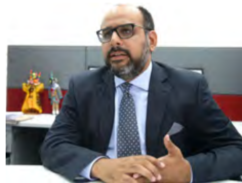
Daniel Alfaro, ministro de Educación.