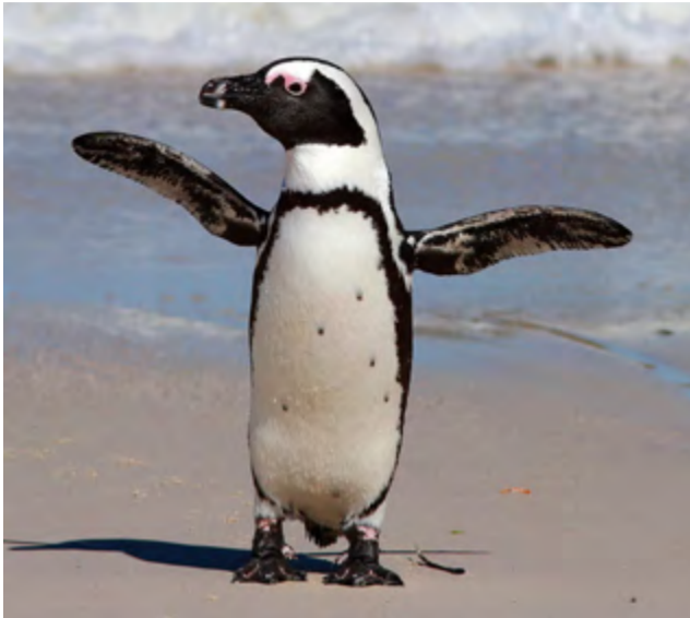
La especie de El Cabo es la única que sobrevive de todas las que vivieron en África

Los investigadores concluyeron que estas especies se extendieron casi por todo el espectro de tamaños conocidos, desde un diminuto pingüino de 30 centímetros de