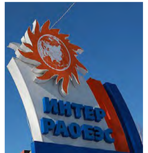
Empresa Inter RAO de proyectos energéticos.

En su momento, Kiev fue responsabilizado con el sabotaje a dos torres de alta tensión, encargadas de transportar electricidad a Crimea. Tal sabotaje llevó a la península y a Moscú, tras el regreso de esa región a la jurisdicción de este país, a iniciar la construcción de dos termoelectricas para garantizar la independencia energética de esa región. (PL)