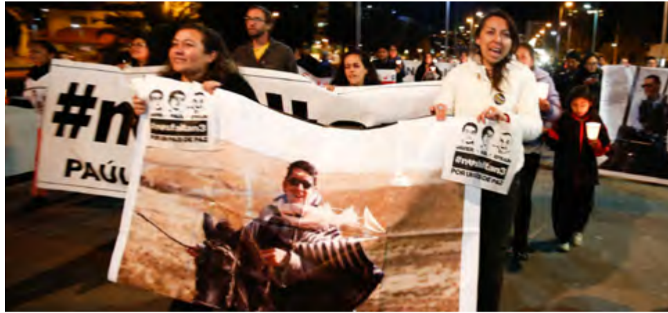
El crimen unió al pueblo ecuatoriano, en vigiliyas y actos públicos.