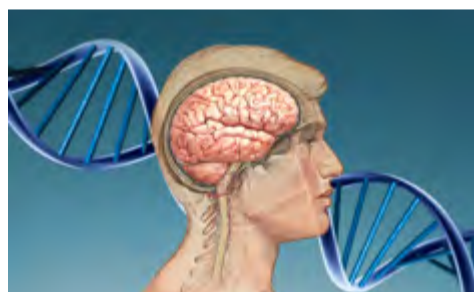
En la función cognitiva la genética desempeña un papel importante.

Para llevar a cabo el estudio, los especialistas analizaron la asociación del genoma completo de unas 270 000 personas pertenecientes a 14 grupos independientes de ascendencia europea, y luego extendieron