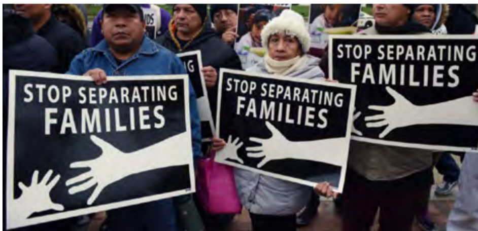
Fuerte rechazo ha recibido la política de Trump “tolerancia cero” sobre la inmigración.

Esos comentarios, que son muy populares entre la base conservadora del mandatario, además de que pueden ser tildados de