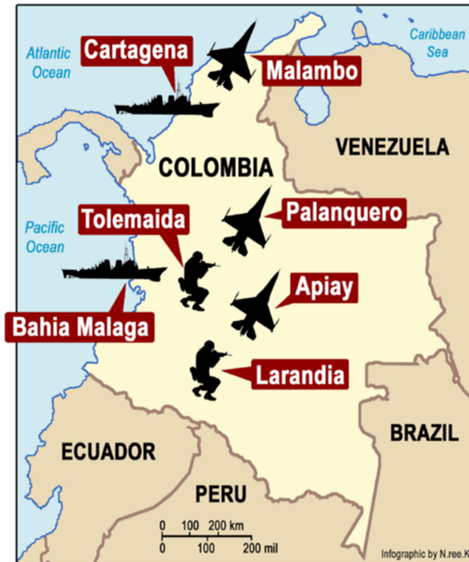
Medios internacionales y el presidente de Bolivia, Evo Morales, denunciaron preparativos contra la patria de Bolívar, utilizando bases militares estadounidenses en Colombia.

Recientemente, medios internacionales y también el presidente de Bolivia, Evo Morales, denunciaron la existencia de aprestos contra la patria de Bolívar utilizando bases militares estadounidenses en Colombia. Las acciones denunciadas por Maduro se