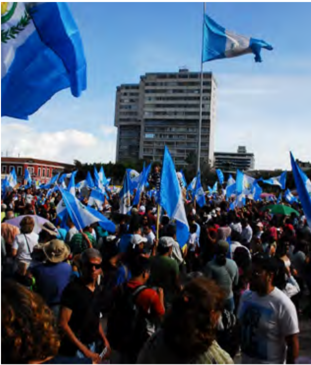
La incorformidad ciudadana tiene en las manifestaciones callejeras su más conocida expresión.

Los revolucionarios involucionaron. Todos los movimientos sociales e indígenas beligerantes al momento de los Acuerdos de Paz fueron creados y dirigidos por actores