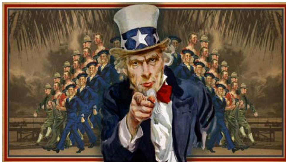
Vigente lo escrito por Vicuña Mackenna en 1866: “...los yankees se imaginan que el Nuevo Mundo todo, entero, es una gran casa de la que solo ellos son los propietarios...”.

tación en los archivos y que se considerara la primera visita de un funcionario de tan alto rango a la Isla.