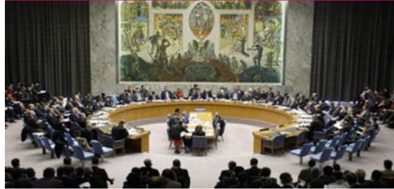
Siria siempre denunció ante Naciones Unidas y su Consejo de Seguridad el empleo de armas químicas por parte de bandas terroristas.