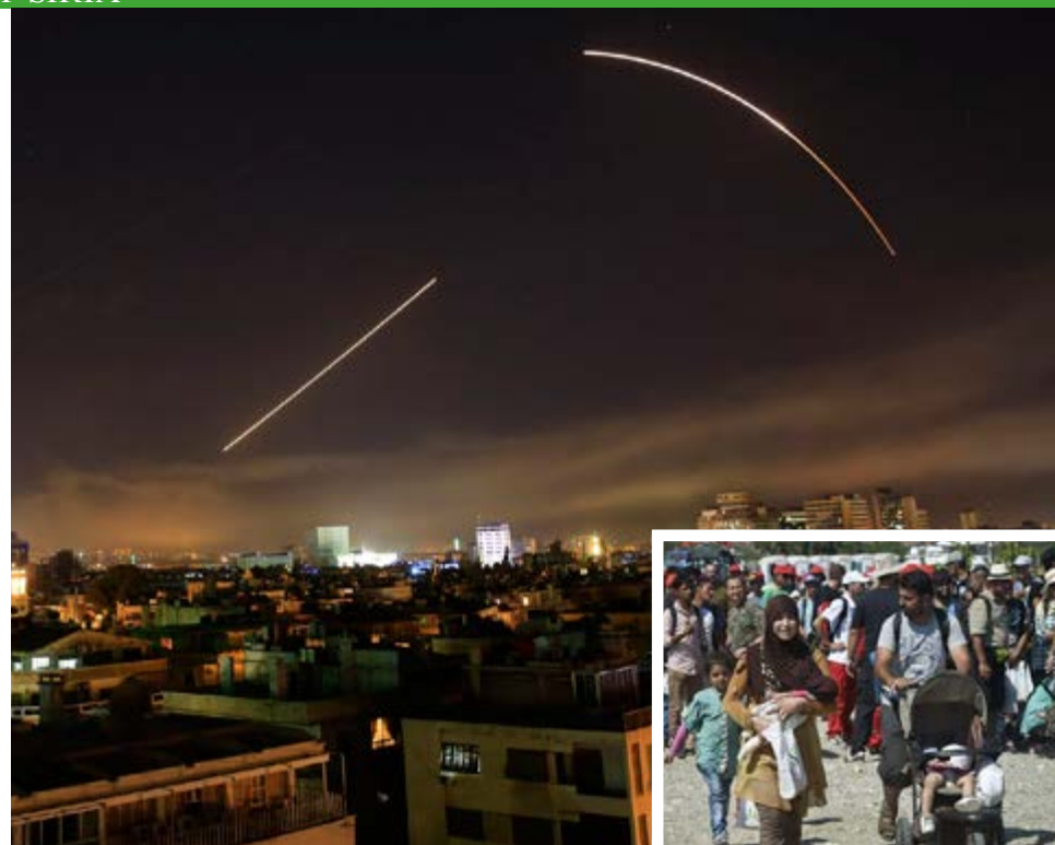
Contrasta el bombardeo a Siria como represalia contra el gobierno de al-Assad por los supuestos ataques químicos contra la población civil con la negativa a recibir refugiados sirios en EE.UU.

En un discurso posterior para informar sobre la operación, el jefe de Estado la justificó al decir que el presunto ataque químico masacró a civiles inocentes y, por tanto, era necesario hacer rendir cuentas al gobierno de al-Assad. Pero esa aducida simpatía hacia la población del país árabe, que enfrenta el peso de un conflicto de siete años en el cual ya fallecieron alrededor de 500 000 personas, choca con la realidad de que en lo que va de 2018 Estados Unidos solo ha recibido a 11 refugiados sirios. "Su compasión por las víctimas de la brutal guerra civil en Siria no se extiende a permitirles ingresar a Estados Unidos", señaló The Washington Post , que recordó cómo los refugiados sirios, y los de la mayoría de otros países acosados por conflictos y luchas, especialmente los musulmanes, han encontrado la puerta cerrada en esta nación. Durante el actual año fiscal, iniciado el 1 de octubre, la administración Trump solo permitió el arribo de 44 refugiados del territorio levantino, una disminución del 99 por ciento en comparación con los 5 800 llegados en igual etapa del año fiscal anterior.