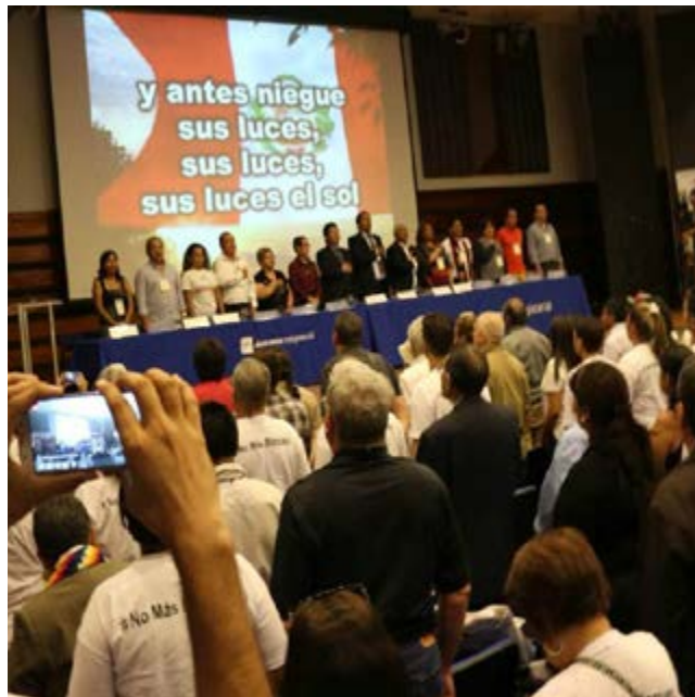
La Cumbre de los Pueblos culminó con la lectura de una declaración final.

Por Ulises Canales , enviado especial y Manuel Robles Corresponsal/Lima