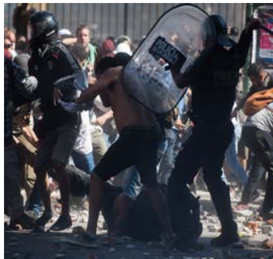
La defensa de sus conquistas durante los gobiernos progresistas hoy son reprimidas brutalmente.

El debilitamiento del aparato político desnuda la intervención —sin los mediadores clásicos— de los sectores económicos más poderosos. La cooptación de los sectores populares, concentrados en los sindicatos, gremios profesionales y productores agrícolas, se realiza también sin mediación alguna. La negociación se hace en forma abierta. La lealtad política deviene una mercancía. Se compran y se venden curules, togas e, incluso, los títulos de dirigentes. Las grandes corporaciones encabezan la ofensiva, con los políticos de los órganos de Gobierno e ideólogos de la llamada sociedad civil legalizando cada paso. Los diputados y ministros de Estado no gobiernan, no legislan y no ejecutan proyectos. Están en manos de los medios de comunicación, que sirven de voceros en las disputas. El marco de referencia de las peleas no es el país o algún proyecto de nación. Ni siquiera hay un referente ideológico.