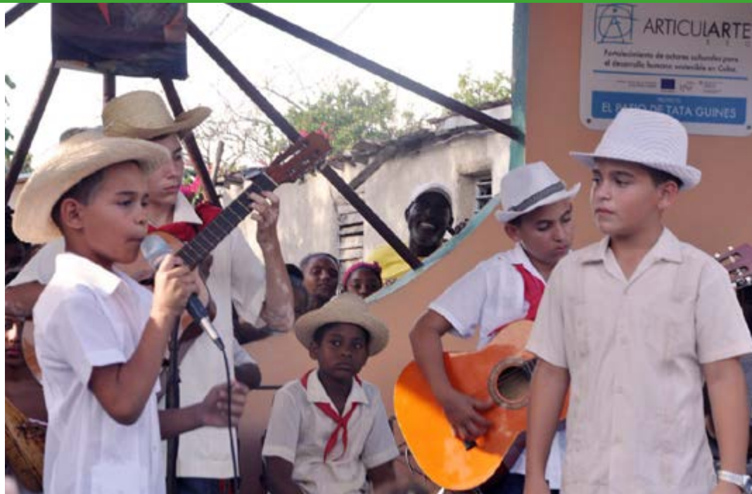
Niños de la mayor de la Antillas dan los primeros pasos en la ejecución del punto cubano.