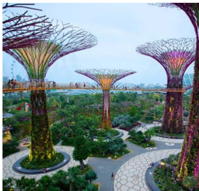
El megaproyecto conjuga perfeccionismo y colorido, naturaleza y modernidad, lo extraordinario y lo práctico.