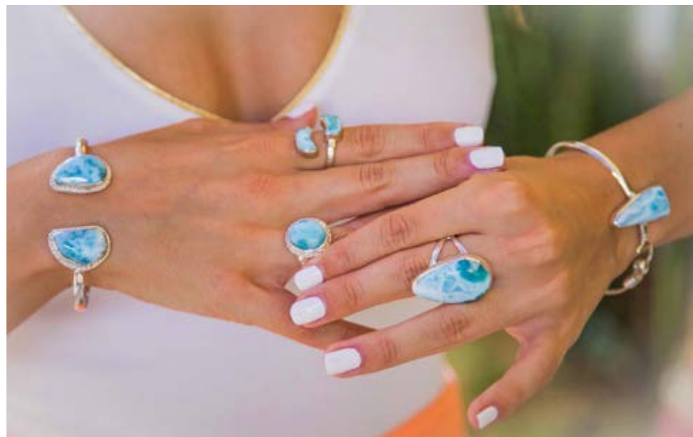
Usada en anillos, pulseras, collares y cuanta prenda la soporte, la calidad y el precio de la piedra los determinan su dureza y coloración.

La piedra es usada en anillos, pulseras, collares y cuanta prenda la soporte. Puede costar desde unos pocos dólares, si es algo sencillo y sobre un soporte económico, hasta miles si la joya se adquiere en una tienda de lujo. Según los conocedores, la calidad y el precio de las piedras los determinan su dureza y coloración, que puede ir del azul pálido al turquesa o a un intenso azul cielo. Se ubica entre los renglones líderes de la minería dominicana y es el principal componente de la artesanía local; no por gusto existe en la zona colonial de Santo Domingo un museo donde se exhiben diversas obras hechas con la piedra. Méndez, conocido como el padre de larimar, recibió el reconocimiento del Senado de la Repú-