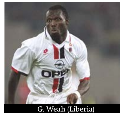
G. Weah (Liberia)