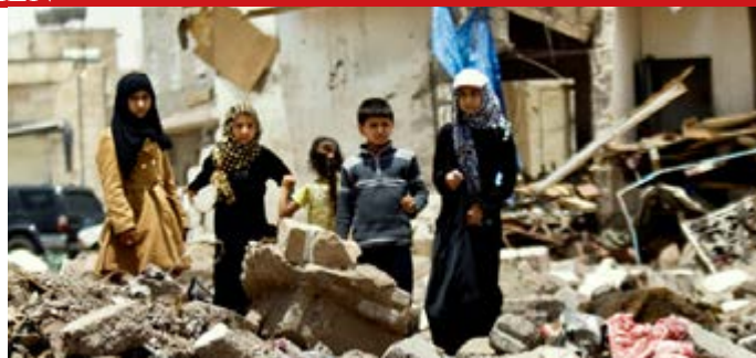
En el último trienio tres millones de personas se quedaron sin hogar, en tanto unos 20 millones necesitan asistencia humanitaria urgente.

Según cifras de Naciones Unidas, entre marzo de 2015 y diciembre de 2017 el 62 por ciento de los 5 500 civiles que murieron y de los más de 9 000 que resultaron heridos en Yemen estuvieron vinculados a los bombardeos de la coalición sobre zonas residenciales. Sin embargo, probablemente la consecuencia más devastadora de la guerra la padece la población de casi todo el país por los efectos indirectos del conflicto. Durante el último trienio unos tres millones de personas se quedaron sin