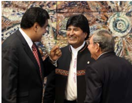
Los Gobiernos de Venezuela y Bolivia han sobrevivido gracias a la movilización popular.

Por Marco A. Gandásegui hijo* Para Firms Selectas de Prensa Latina