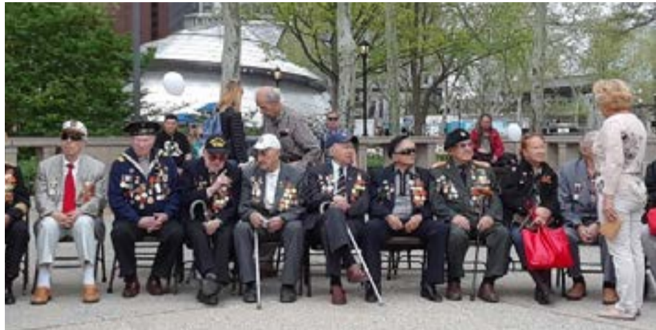
Veteranos de varias nacionalidades convergen cada mañana en Battery Park.

Además de brindar la mejor vista de la estatua a lo lejos y permitir admirar el paso de las embarcaciones por el puerto, es posible contemplar en estos fríos días primaverales, la presencia de veteranos de aquella contienda mundial, que estremeció la huma-