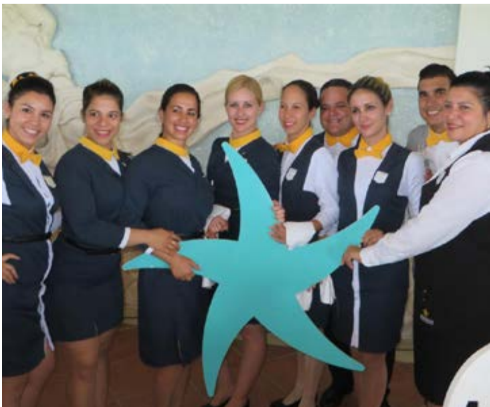
Participaron en la Feria 3 319 representantes del sector de 62 países.

En resumen, FITCuba 2018 resultó un exitoso encuentro de profesionales del turismo y símbolo de la industria de los viajes que es caracterizada además como de paz, donde confluyen las naciones, sus culturas, la tolerancia, frente a un mundo de guerras. 🌍