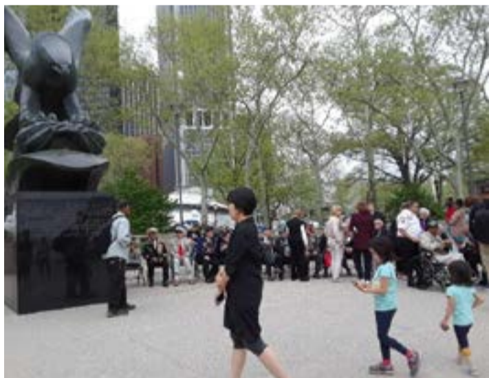
La imagen del águila que parece lista para emprender vuelo.

Menos aún son los que se detienen a comprar los globos blancos con el logotipo azul que recuerda el Memorial Day, dedicado a honrar a los caídos en las guerras, y que los veteranos venden para recaudar fondos con fines benéficos. Casi ninguno de los paseantes advierte que entre los vendedores, con sus pechos repletos de medallas, hay hombres de diversas nacionalidades; entre ellos altos oficiales norteamericanos, rusos, puertorriqueños y dominicanos. Todos están allí, serios, callados, con su mirada puesta en la lejana estatua que se pierde en la bruma de la fría tarde de una ciudad repleta de rascacielos a la que llaman la Capital del Mundo. 🌐