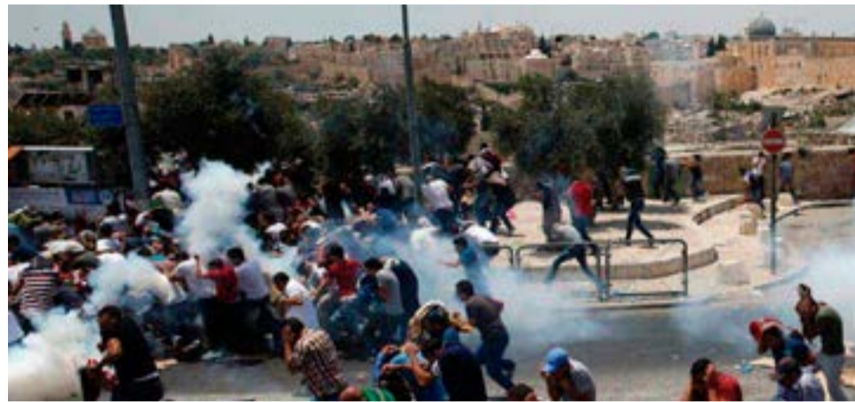
Desde el pasado marzo, los israelíes han matado a 97 civiles palestinos y herido a más de 10 000.

En total, desde que el pasado 30 de marzo comenzaron las manifestaciones de la Marcha por el Retorno todos los viernes en Gaza, el ejército israelí ha matado a 97 civiles palestinos, incluidos 12 niños, y herido a 12 271 personas, de ellas, 3 598 con munición de