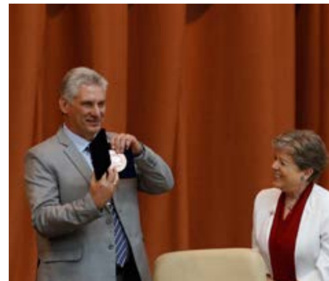
El presidente Miguel Díaz-Canel recibió la medalla 70 aniversario de esa organización regional en la 37 sesión de la Cepal, en La Habana.

La igualdad está en el foco del desarrollo porque provee a las políticas de un fundamento último centrado en un enfoque