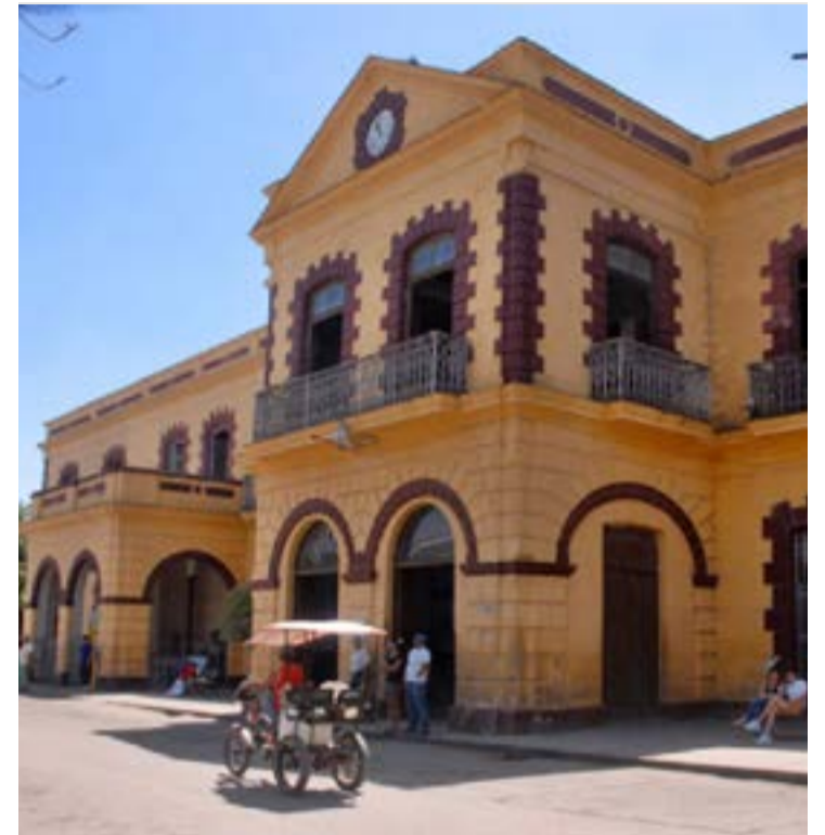
Los hoteles Encanto, renovados y modernizados, cuentan con lugares como el Sagua, uno de los más atractivos de su tipo.

La planta hotelera cubana se compone en estos momentos de 69 041 habitaciones, con el 63 por ciento de instalaciones de cuatro y cinco estrellas, y el 74 por ciento se encuentran en playas.