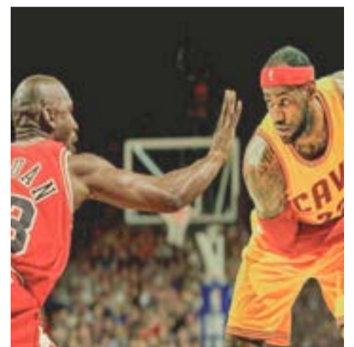
LeBron, el Rey.

Todos hablan de los seis títulos que ganó Jordan, pero no mencionan las nueve ocasiones en que fue eliminado: tres veces se quedó en primera ronda, dos en segunda y una en final de conferencia. Por cierto, también fallaba, perdía balones y le encajaban algún que otro tapón. Pero eso sería concentrarse en las manchas del sol, y no en todo su esplendor... como muchos haters hacen con LeBron.