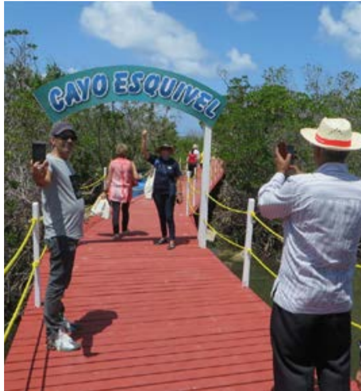
Los cayos del centro de Cuba atraen a nuevos turistas, y también a turoperadores.

El ministro de Turismo cubano, Manuel Marrero, agregó precisamente que La Habana cumple en 2019 sus 500 años de fundada