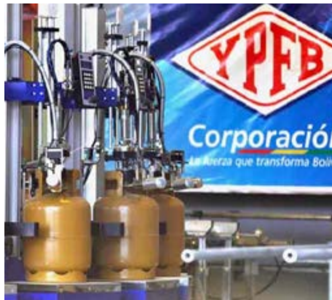
El sector de los hidrocarburos fue nacionalizado en 2006.

La institución gubernamental anunció que invitaron a varias empresas extranjeras a participar en la licitación para precisar la cantidad actual de las reservas, las cuales deben darse a conocer a mediados de 2018.