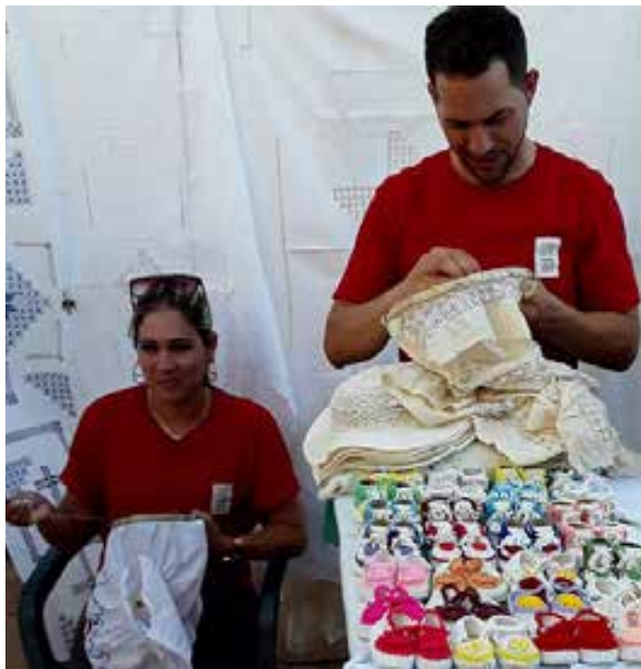
El bordado y los textiles resultan los trabajos más arraigados en la tercera villa fundada en Cuba.