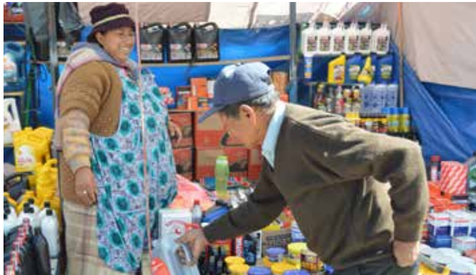
La feria 16 de julio ocupa más de 400 cuadras.

Esto es que la venta de algún producto principal se complementa con otros accesorios relacionados. Como ejemplo, este especialista toma la oferta de automóviles, la cual lleva a la comercialización de productos afines, como piezas de repuesto, y al establecimiento de oficinas legales ambulantes donde abogados procesan e inscriben legalmente las adquisiciones de