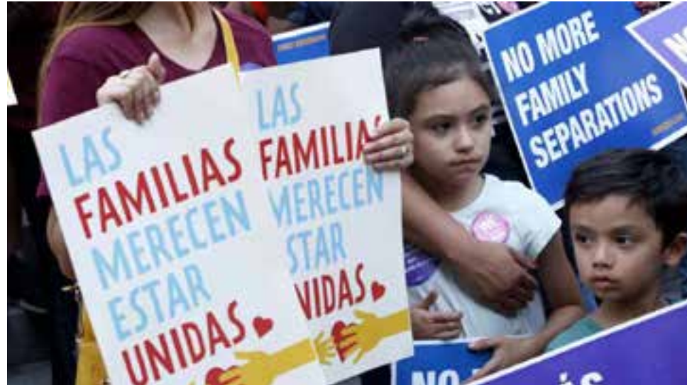
Defensores de los derechos humanos consideran que Trump ordenó un "encarcelamiento familiar".

Sin embargo, el diario The New York Times informó que, de acuerdo con el Departamento