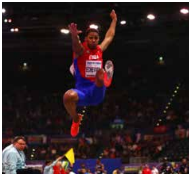
Juan Miguel Echevarría pudiera ser el primer saltador que rebase los 9 metros.

Desde ese momento, Juan Miguel ha logrado encadenar una serie de marcas impresionantes a lo largo de la temporada. El 16 de marzo durante la Competencia Final del Primer Macro ciclo en su tierra natal, puso sus spikes en los 8,40 metros al aire libre. Un mes después, el 31 de mayo,