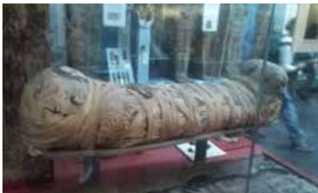
El museo alberga una vastísima colección de momias, tumbas y lápidas faraónicas.

Para suplir esa "falla", sin embargo, está el gigantesco busto de Ramsés II, quien sin dudas nunca pensó que la vida