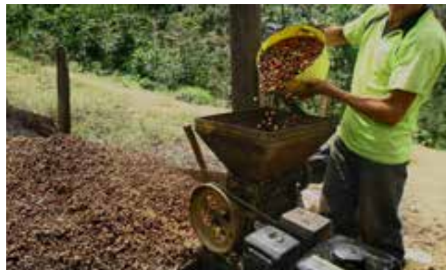
Las cadenas de valor también tienen el propósito de promover la transparencia y la toma de decisiones de forma participativa.

El desarrollo económico de los países, según expertos, se alcanza hoy mediante cambios en la estructura productiva que transformen la composición del producto, el comercio internacional y el empleo.