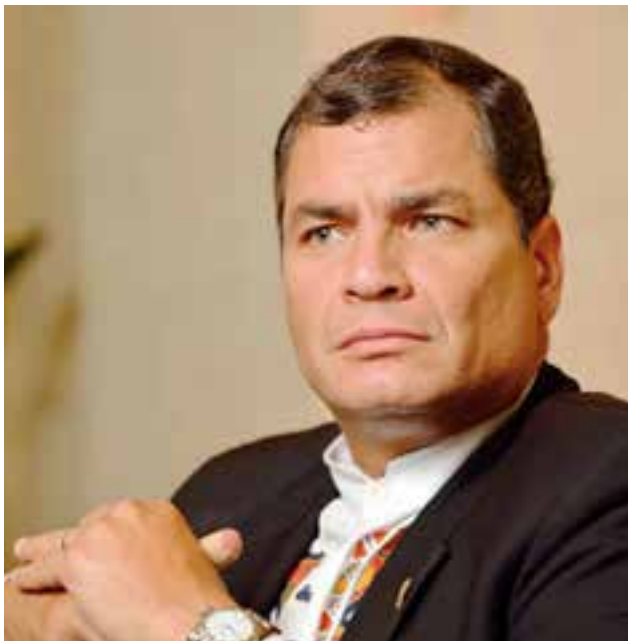
“Me quieren preso o fuera del país”, denunció Correa.

La decisión judicial, que se empezaría a aplicar a partir del 2 de julio, destapó severas críticas entre gente de pueblo, exfuncionarios del gobierno de Correa y letrados, incluso algunos contrarios a su gestión de 10 años.