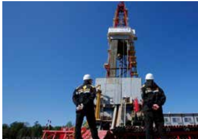
El petróleo sigue representando el 33% del balance energético comercial global.

También influyeron coyunturas geopolíticas en el Medio Oriente y otras zonas productoras,