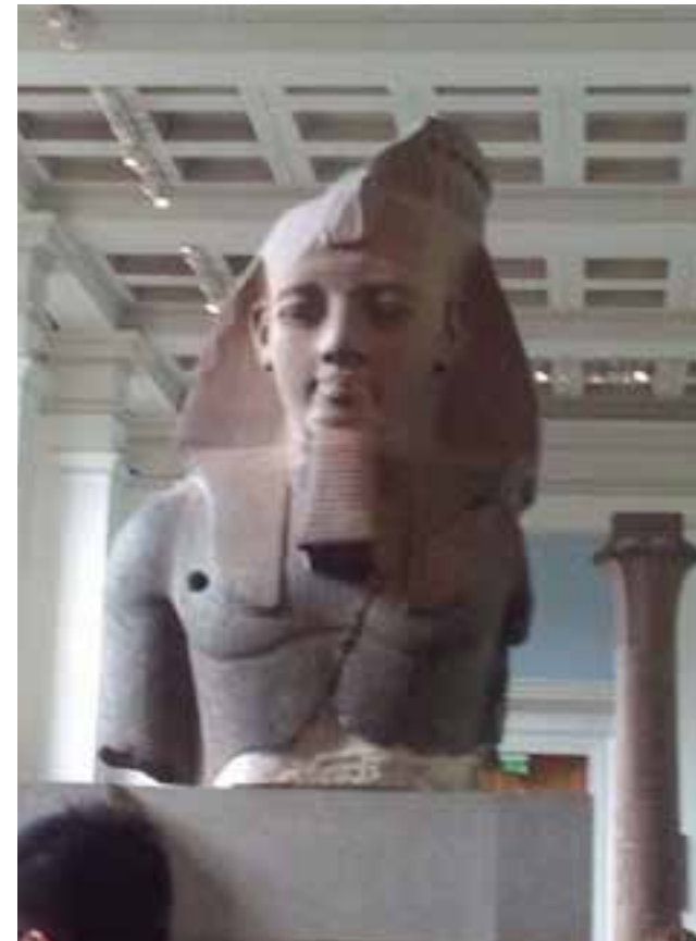
La vasta colección del museo británico constata el saqueo imperial sufrido por la humanidad.

Según los expertos británicos, solo el museo londinense cuenta con las condiciones adecuadas para conservar esos objetos de valor.