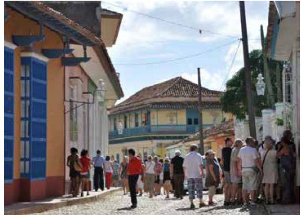
Más de 500 años de tradiciones trinitarias atraen a miles de visitantes nacionales y extranjeros.

El expediente presentado en 2015 al WWC tuvo en cuenta todos estos aspectos, comenta la especialista de la Asociación Cubana de Artesanos Artistas (Acaa) en entrevista con nuestra publicación.