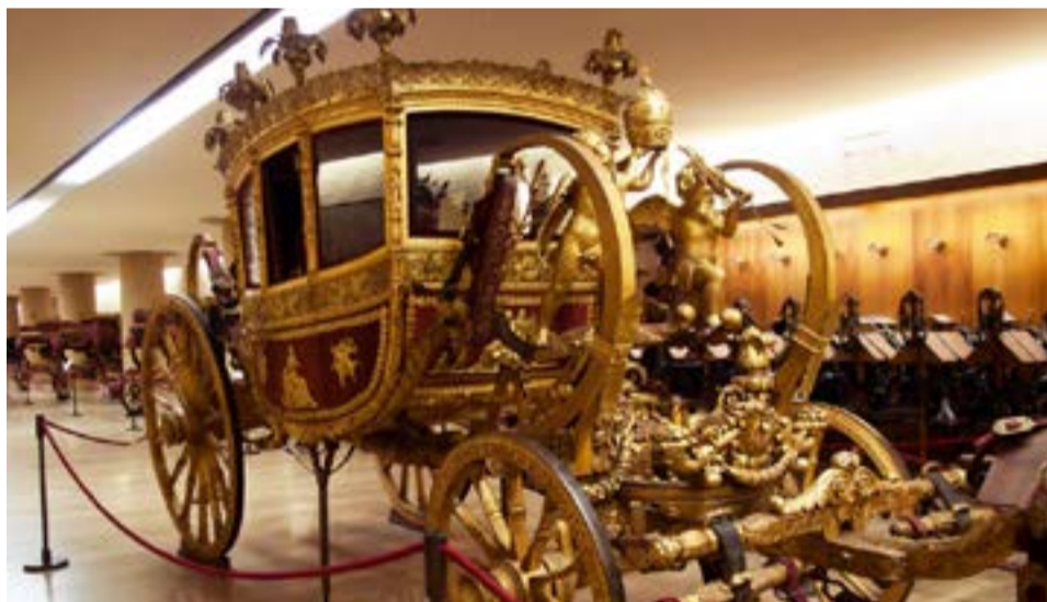
Se exhibe el carro papal hecho en 1825 durante el Pontificado del papa León XII.

La escalera helicoidal, diseñada por el arquitecto italiano Giuseppe Momo entre 1929 y 1932 a instancia del papa Pío XI, constituye uno de los grandes tesoros arquitectónicos, por donde el visitante desciende al final de un recorrido inigualable.