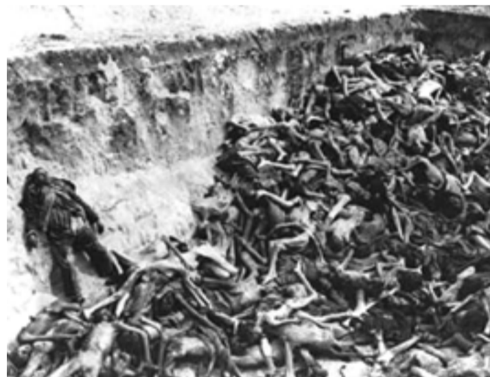
En zanjas y campos yacían los cadáveres de la población masacrada, en su mayoría niños y mujeres.