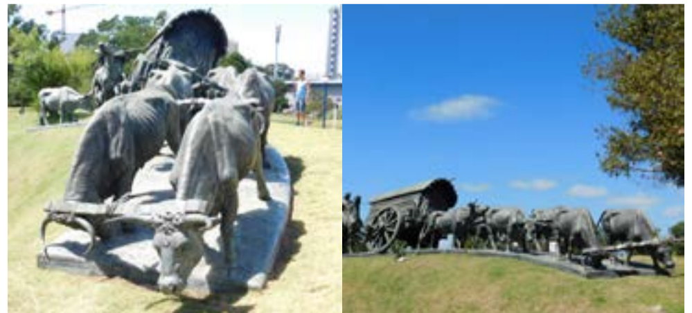
El monumento La Carreta mide 22 metros y tiene 150 toneladas de peso.