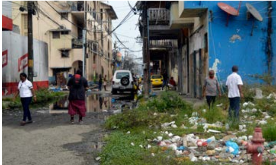
El 3,2 por ciento de la población de Colón sobrevive en la indigencia y el 15,8 en la pobreza, según datos oficiales.

El economista Juan Jované, precandidato presidencial, consideró que el "desempleo crónico" sobrepasa el 15 por ciento en los jóvenes, los cuales se refugian en las pandillas y el crimen organizado, que mantienen un ambiente violento e inseguro entre los habitantes.