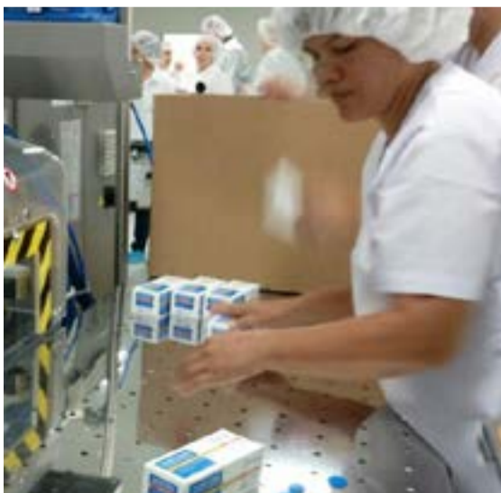
En un primer momento se producirán 15 millones de vacunas contra la influenza.

Etienne, quien recientemente visitó el país, reconoció que este proyecto se ha podido concretar gracias a la cooperación para el desarrollo entre el gobierno de Nicaragua y Rusia, y el mismo permitirá producir cambios trascendentales en el área.