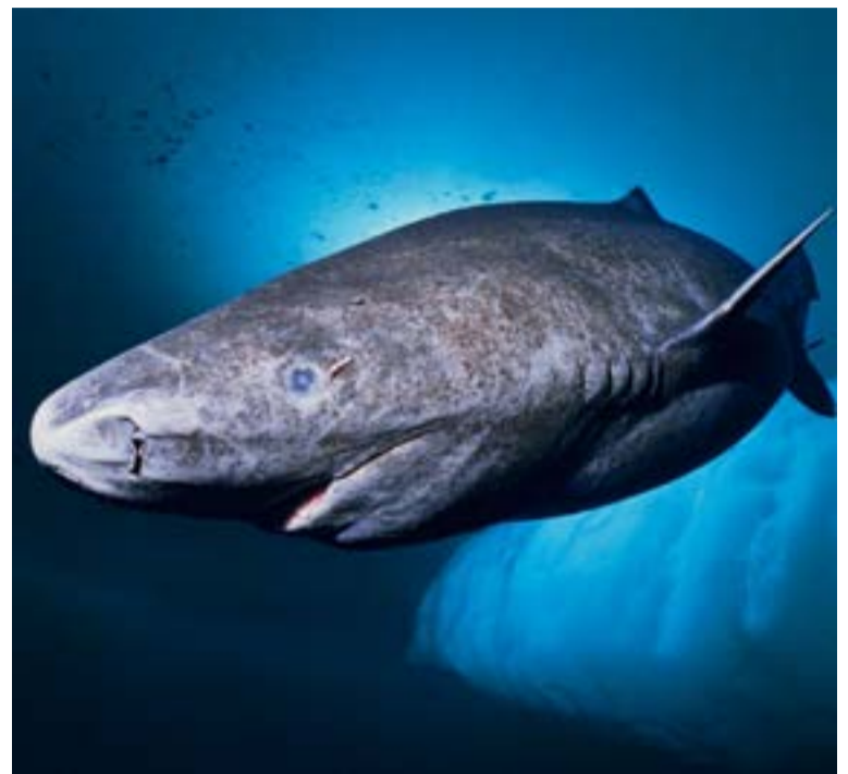
Estos tiburones tienen una esperanza de vida promedio de 390 años y son ciegos.