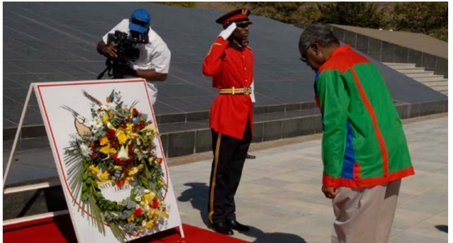
La población no olvida a los mártires de aquella sangrienta jornada.

"Decenas, cientos de personas fueron asesinadas. Nuestras tropas, una unidad pequeña (cubana) que estaba a cierta distancia, acudieron en su auxilio y lograron salvar a los que no habían podido todavía asesinar.