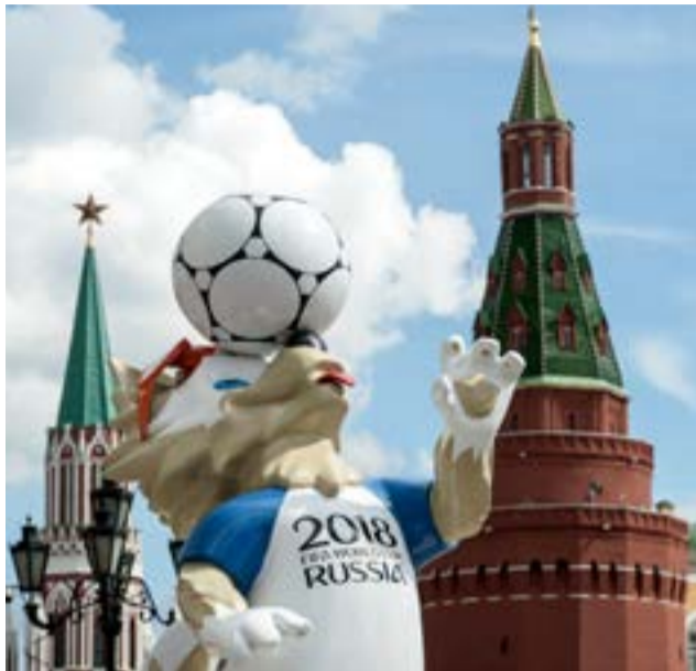
El mundo tendrá la mirada fija en Rusia entre el 14 de junio y el 15 de julio próximos.

Las urbes de Moscú (con dos estadios), San Petersburgo, Kazán, Rostov del Don, Sochi, Samara, Saransk, Ekaterimburgo, Nizhni Novgorod, Kaliningrado y Volgogrado,