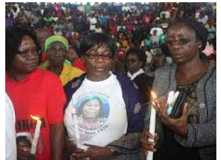
Sobrevivientes del genocidio cometido por las tropas racistas contra la población desarmada.

"Lograron salvar allí a algunos centenares de ancianos, mujeres y niños con el sacrificio de la vida de algunas decenas de combatientes, además de algunas decenas de heridos. Nunca lo podremos olvidar, y fue una prueba de cómo actúan estos elementos racistas y fascistas, un acto de terror inconcebible", subrayó el líder cubano.