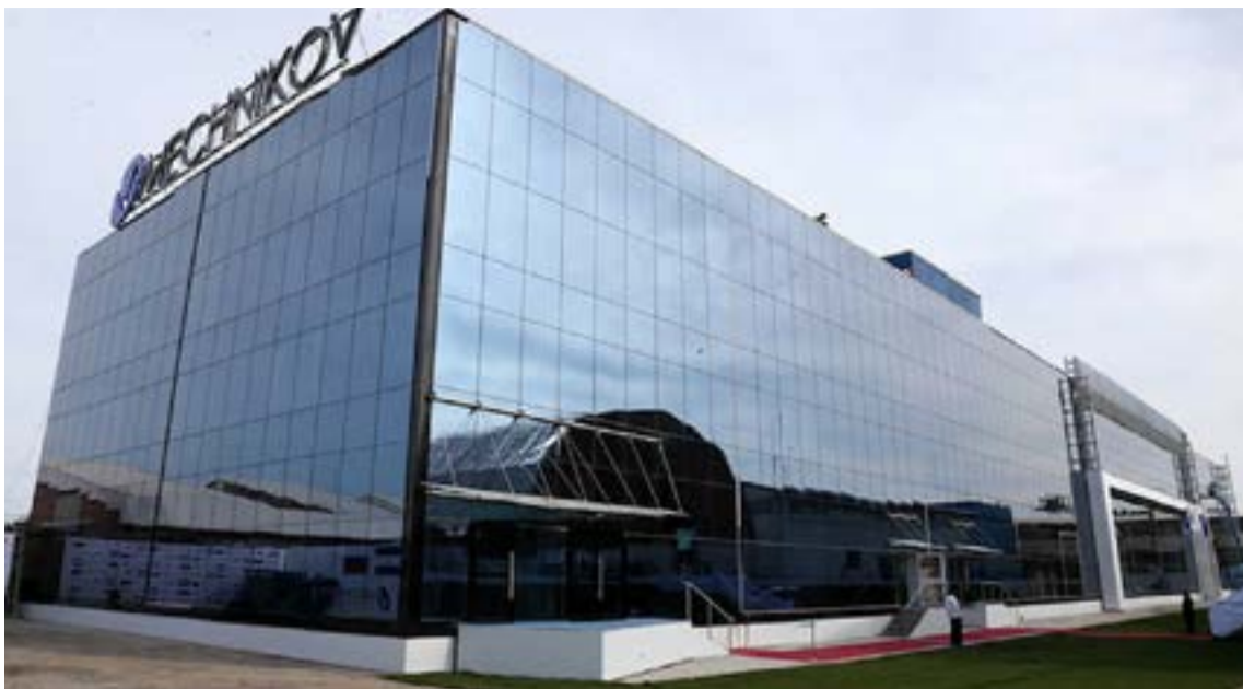
El Instituto Latinoamericano de Biotecnología Mechnikov fue construido con capital mixto de Rusia y Nicaragua.