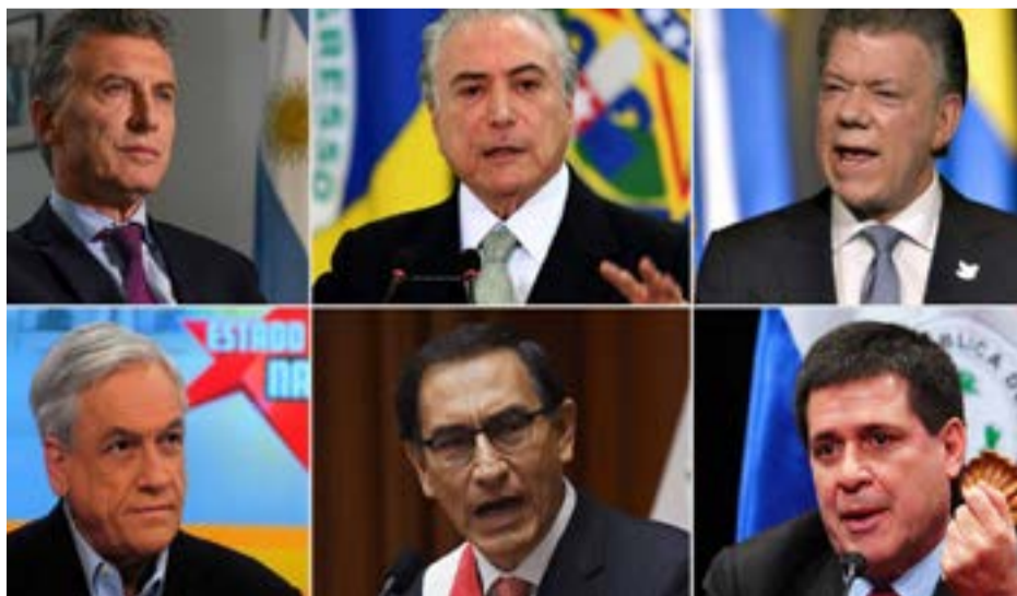
Los presidentes de Argentina, Brasil, Colombia, Chile, Perú y Paraguay pusieron condiciones para su regreso al organismo suramericano.

El 23 de mayo de 2008 se aprobó el Tratado Constitutivo de este organismo regional —vigente desde el 11 de marzo de 2010— en el cual se designó como sede permanente de la Secretaría General a Quito, capital ecuatoriana, y del Parlamento a Cochabamba, Bolivia.