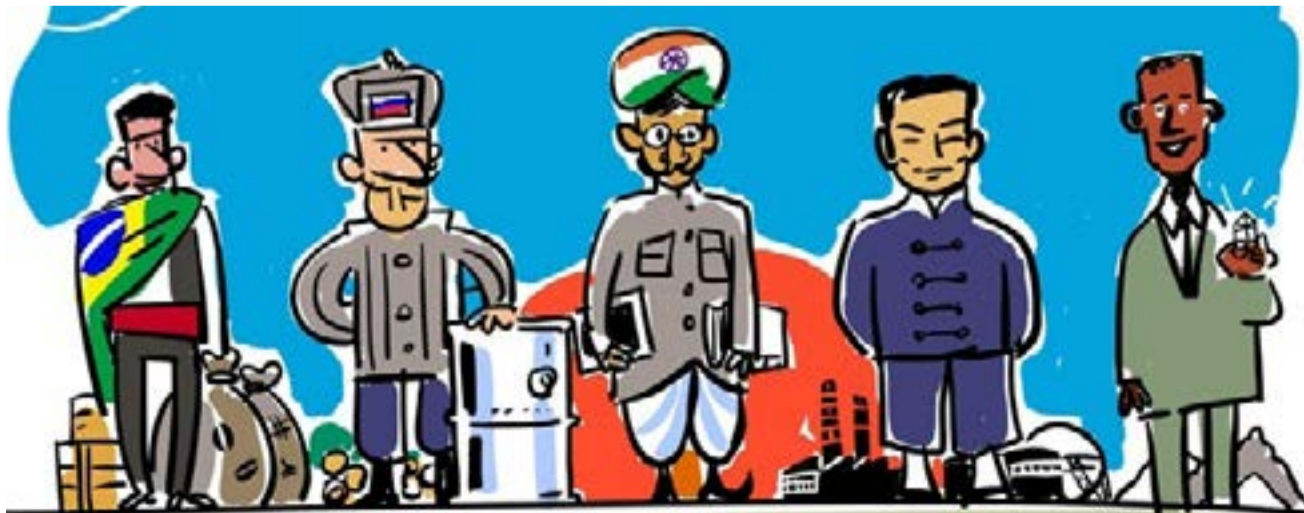
Las economías de China, India, Brasil, Rusia, México, Indonesia y Turquía liderarán el mercado mundial para 2040.

Se señalan como condicionantes esenciales el desarrollo constante y eficaz de la educación, infraestructura, tecnología, innovación, diversificación de la economía, y vencer el reto de la desigualdad social. 🗣️