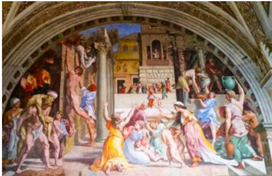
La idea original de abrir las exposiciones permanentes de pinturas, fue del papa Pío XI, en 1932.

La idea original de abrir las exposiciones permanentes de pinturas, corresponde al papa Pío XI, quien en 1932 exhibió las obras maestras llevadas a París por Napoleón a través del Tratado de Tolentino (1797) y devueltas a Roma por disposición del Congreso de Viena en 1815.