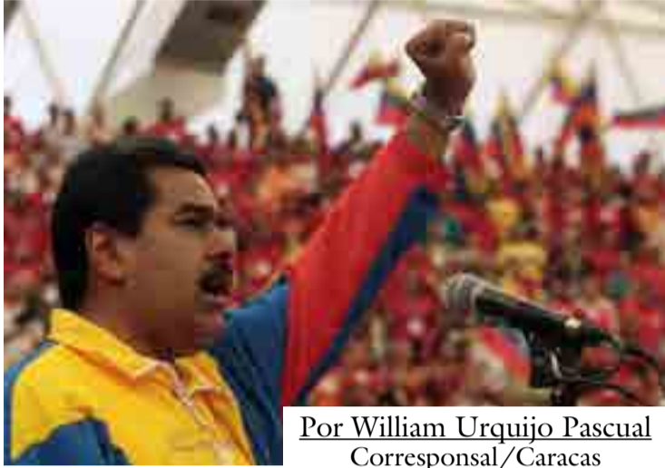
Por William Urquijo Pascual Corresponsal/Caracas

La oficialización de las candidaturas a las elecciones presidenciales del venidero 22 de abril centró esta semana el acontecer en Venezuela, al conocerse los principales aspirantes a dirigir el país en el período 2019-2025, en un clima marcado por la unidad de las fuerzas políticas afines al Gobierno y las contradicciones en el seno de la oposición.