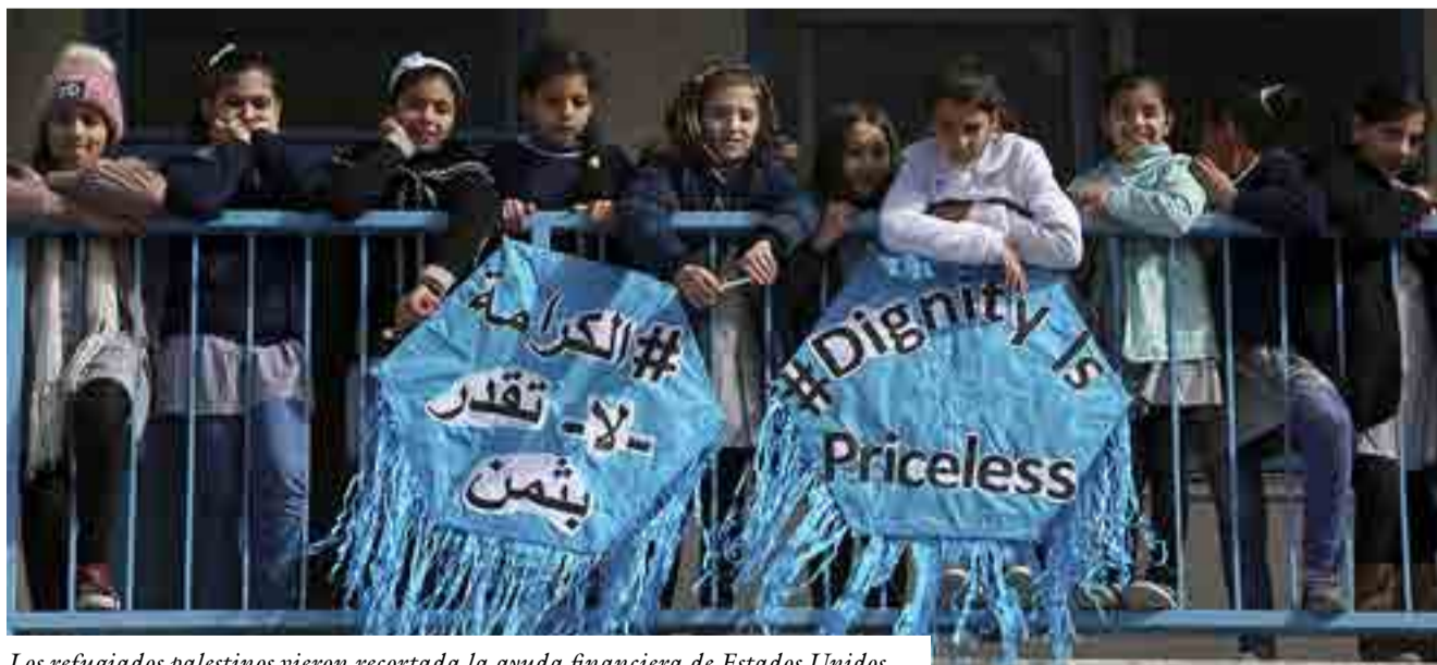
Los refugiados palestinos vieron recortada la ayuda financiera de Estados Unidos.

Las negociaciones de paz deben basarse en la legitimidad internacional y en la Iniciativa de Paz Árabe de establecer un Estado palestino independiente con Jerusalén Oriental como su capital, enfatizó.