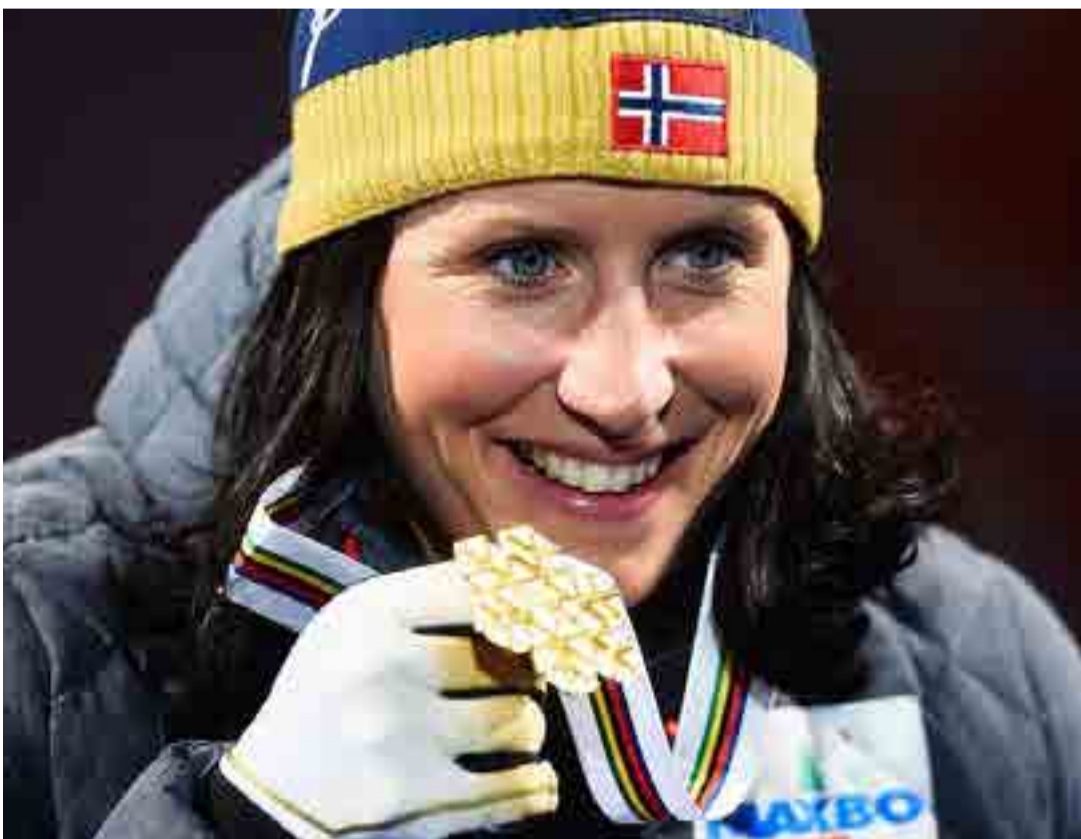
Marit Bjorgen, la atleta más laureada de la historia de esta justa.

A partir de ahora, otra vez serán cuatro los años que servirán para perfilar desarrollo y estrategias. Europa y Norteamérica tratarán de robustecer su jerarquía, Asia de impulsar su desarrollo, mientras que Latinoamérica continuará afilando sus esperanzas y espíritu de superación.