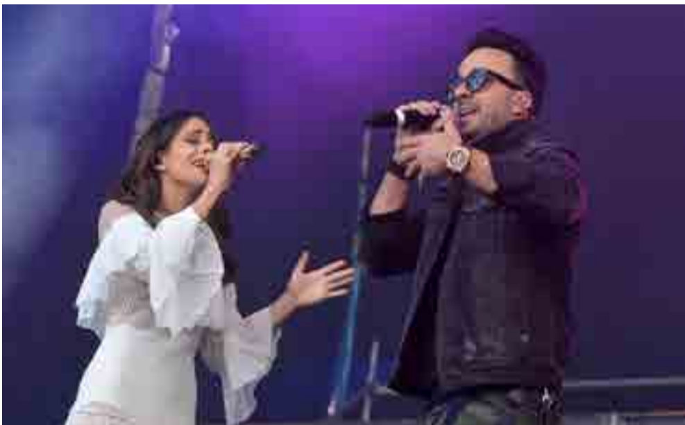
Luis Fonsi interpretó su éxito Échame la culpa junto a Tini Stoessel.