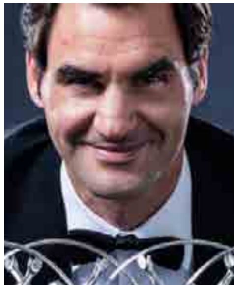
Federer, el rey de los Laureus.

El premio al Mejor Equipo recayó en la escudería de Fórmula Uno Mercedes, el primero en su historia. El conjunto alemán había sido nominado en tres ocasiones consecutivas, de 2015 a 2017, aunque en ellas perdió frente a la selección germana de fútbol, la escuadra de rugby de Nueva Zelanda y los Cubs de Chicago de las Gran-