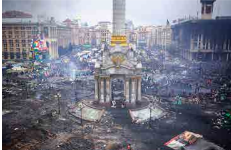
El país europeo permanece sumido en un conflicto desde el golpe de Estado ocurrido en 2014.

Todo ello ocurre después que entró en vigor la llamada ley de reintegración del Don-