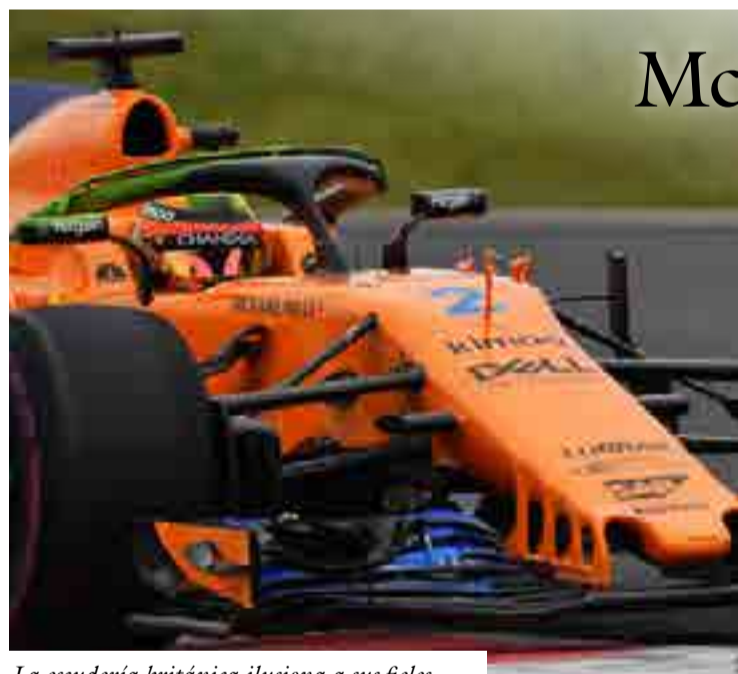
La escudería británica ilusiona a sus fieles.

En la gala también se premió con la distinción al Logro Excepcional al exfutbolista del Roma, Francesco Totti, por desarrollar toda su carrera en el conjunto italiano y para el Logro de Vida al exatleta estadounidense Edwin Moses, ganador de dos oros olímpicos e invicto durante nueve años en los 400 metros con vallas.