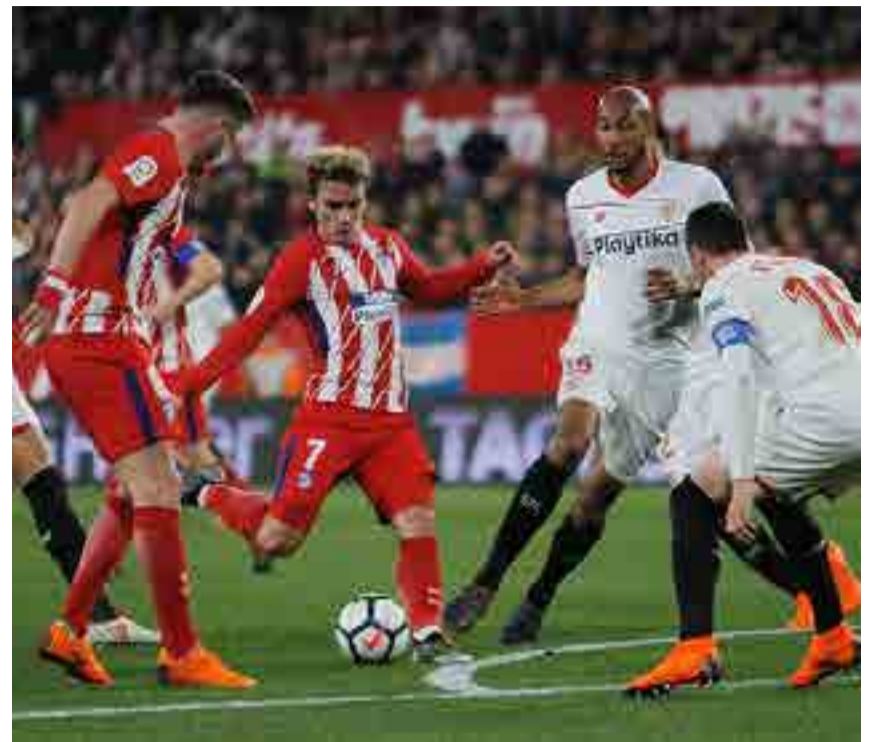
Griezmann y el Atlético le dan brillo a la Liga Europa.