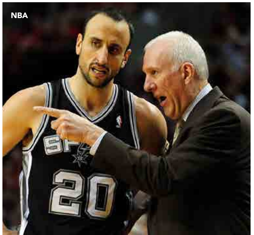
Durante su carrera en el banquillo de los Spurs, Greg Popovich ayudó a encumbrar en la NBA a jugadores como el argentino Manu Ginóbili.

En esta fase de cuartos de final, Barcelona, Real Madrid, Bayern y Manchester City portarán los pesados carteles de favoritos en sus respectivas series.