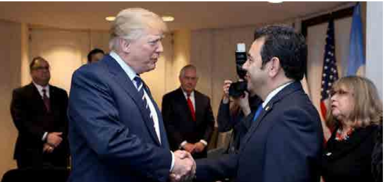
El presidente de Guatemala, Jimmy Morales, secundó la idea de Trump de establecer la capital de Israel en Jerusalén frente al rechazo internacional.

Claro que, tras estas salidas de tono estafalarias, hay una agenda de extrema de-