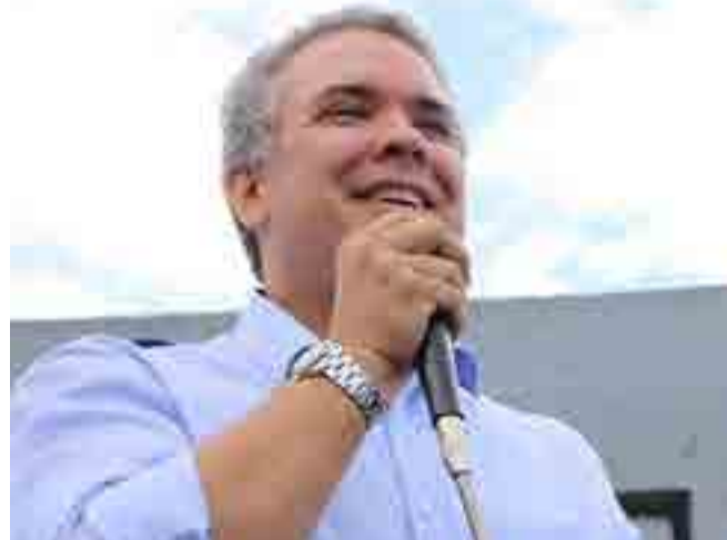
Iván Duque se presenta como el candidato del uribismo.