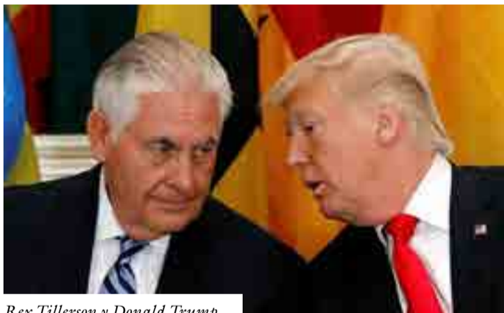
Rex Tillerson y Donald Trump.

El senador del partido azul Cory Booker (Nueva Jersey) consideró que la diplomacia de Trump consiste en “contradicciones, subvaloración, torpeza, confusión, cortes colosales, caos e inconsistencias”, y predijo que esa situación continuará. Mientras, la representante Barbara Lee (California) fue más lejos, al afirmar que Tillerson fue ineficaz al frente del Departamento de Estado, “pero Pompeo podría ser aún peor”.