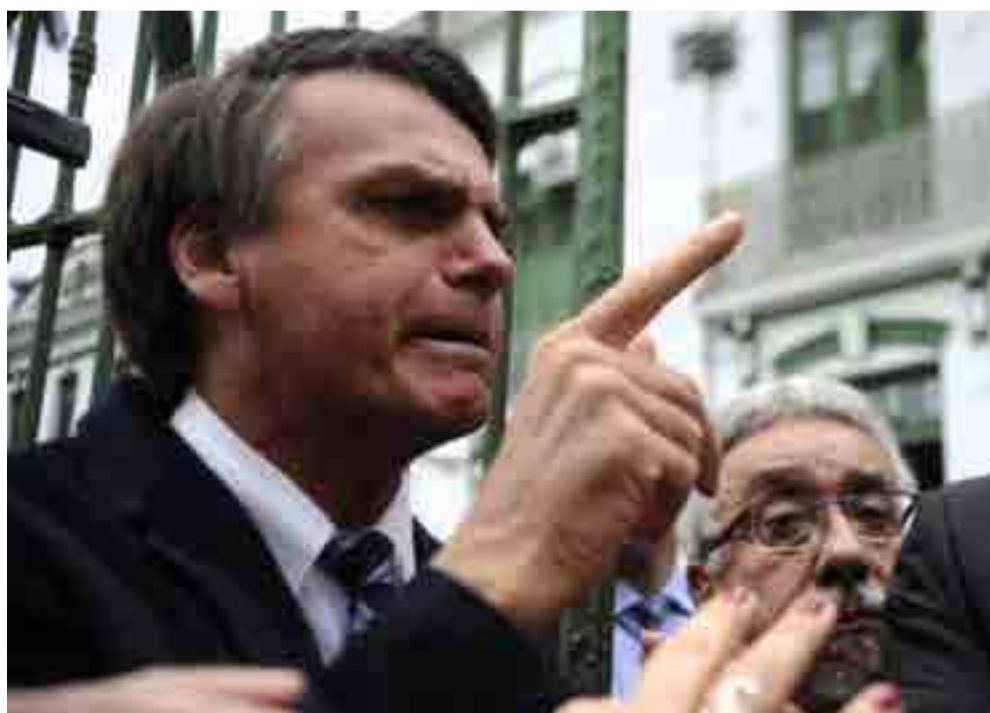
El diputado Jair Bolsonaro es un defensor abierto de la dictadura militar en Brasil.

*Historiador, novelista, presidente de la Asociación para la Unidad de Nuestra América en Costa Rica. Tomado del portal Firmas Selectas de Prensa Latina www.firmas.prensa-latina.cu . Usted puede encontrar en ese sitio más artículos de este y otros destacados intelectuales.