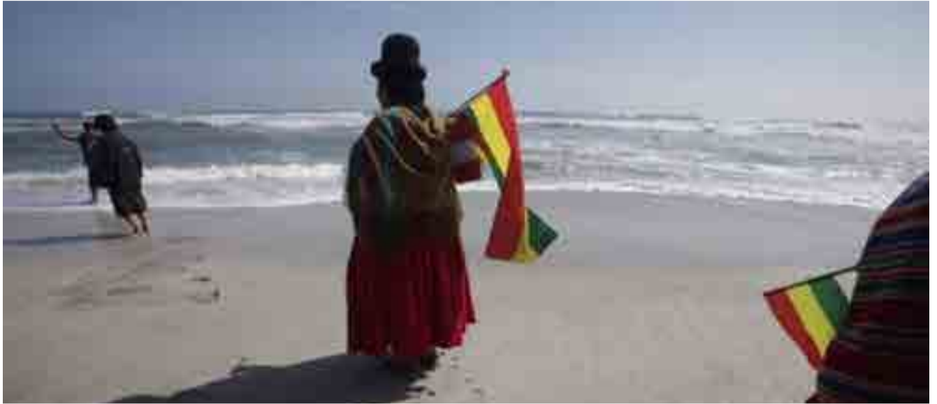
Ambos países ventilan su diferendo marítimo ante la Corte Internacional de Justicia.

La comitiva boliviana, encabezada por el presidente Morales —es la primera vez que un jefe de Estado asiste a una audiencia de ese tipo en la Corte—, demostró con documentación y hechos irrefutables que en algún momento Chile reconoció que después de todo "no es mala idea sentarse y escuchar a su contraparte".