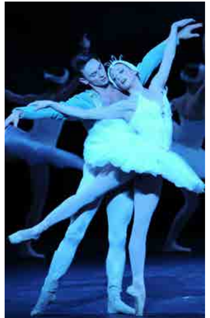
Los aportes del coreógrafo francés perduran hasta nuestros días.

Las obras de Petipa cautivan además por presentar retratos de la fastuosidad de las cortes y, al mismo tiempo, ofrecer recreaciones de las danzas folclóricas practicadas por distintos pueblos del continente europeo: rusas, húngaras, italianas y españolas, a modo de ejemplo.