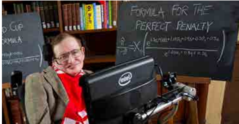
Considerado el heredero de Albert Einstein, Stephen Hawking también fue deportista.

Otros elementos como el clima y la distancia también fueron estudiados por el científico. "Un aumento de cinco grados reduce las opciones de victoria en un 59 por ciento y tenemos el doble de opciones si jugamos por debajo de los 500 metros sobre el nivel del mar".