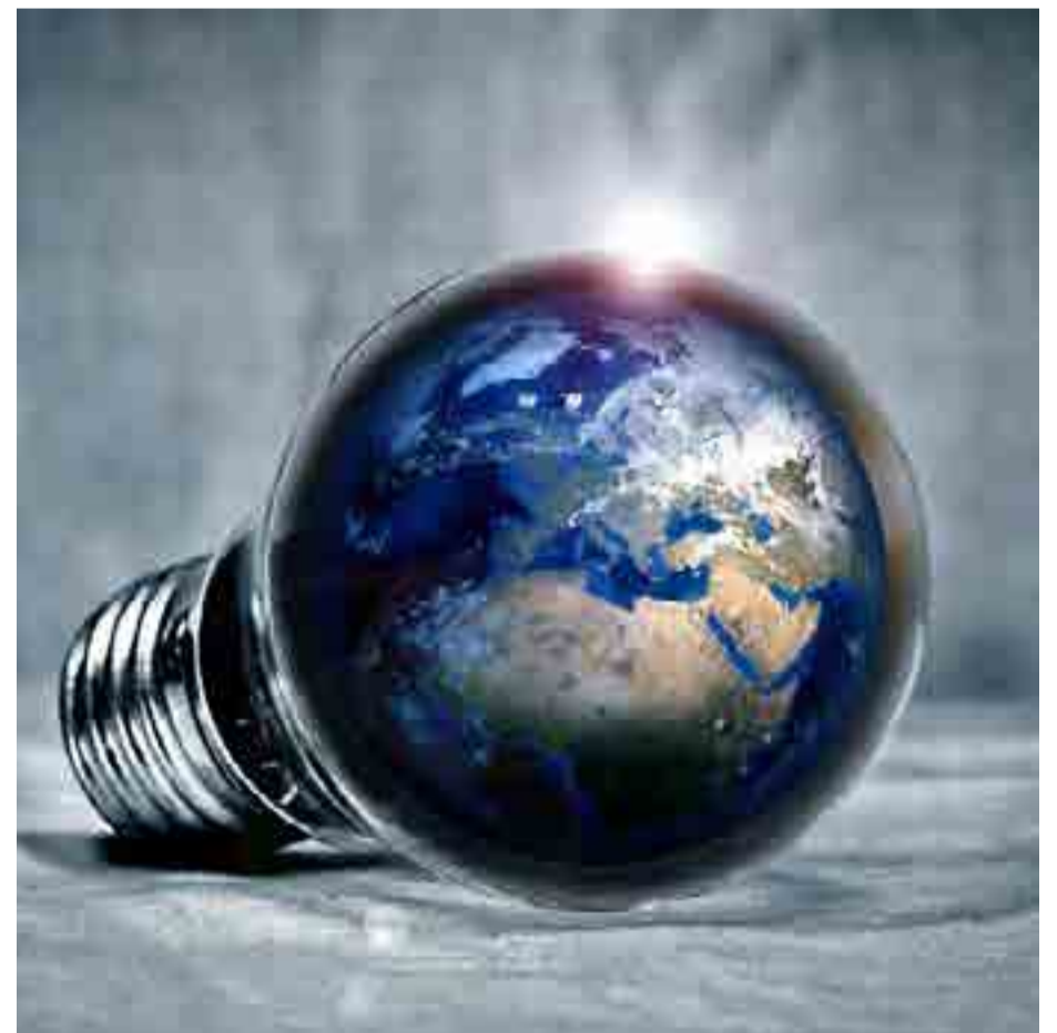
La Hora del Planeta tendrá lugar este sábado en más de 150 países.

Tenlo en cuenta: el sábado 24 de marzo, de 20:30 a 21:30, estés donde estés —excepto si eres cosmonauta y estás de misión—, apaga las tuyas.