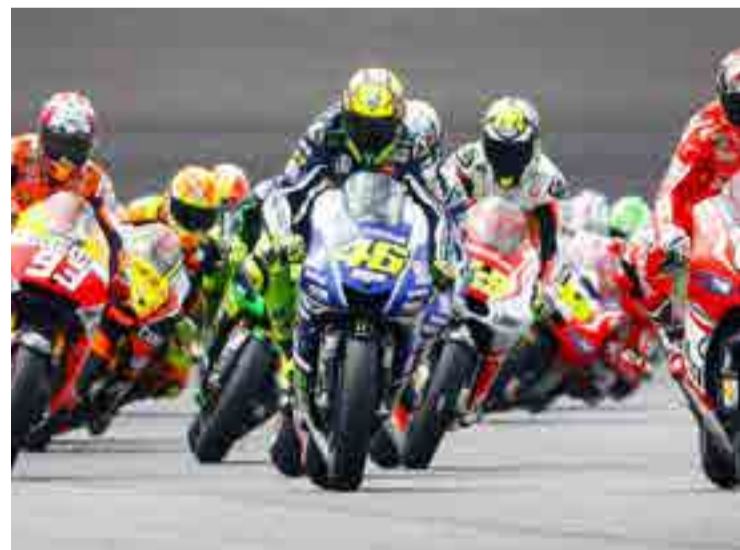
Dovizioso mostró su ambición en Losail.

Tal y como se esperaba, la primera carrera del año fue emocionante de principio a fin, con altos y bajos, y una disputa cerrada entre los dos mejores pilotos del momento: el actual campeón mundial, el español Marc Márquez (Repsol Honda) y el italiano Andrea Dovizioso (Ducati).